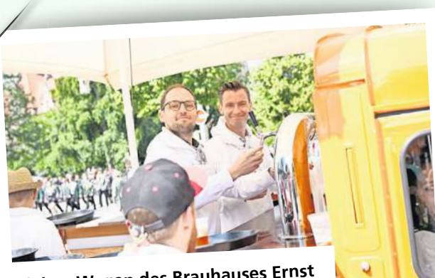
Auf dem Wagen des Brauhauses Ernst August zapften die Chiefs persönlich.