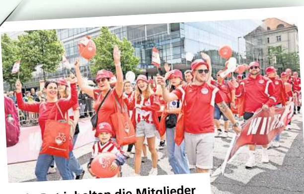
Ganz in Rot jubelten die Mitglieder des VfL Eintracht im Jubiläumsjahr.