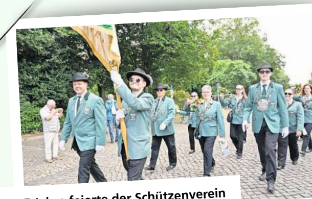
125 Jahre feierte der Schützenverein Stöcken beim Ausmarsch.