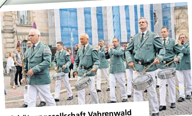
Die Schützengesellschaft Vahrenwald feierte ihren 175. Geburtstag mit Musik.