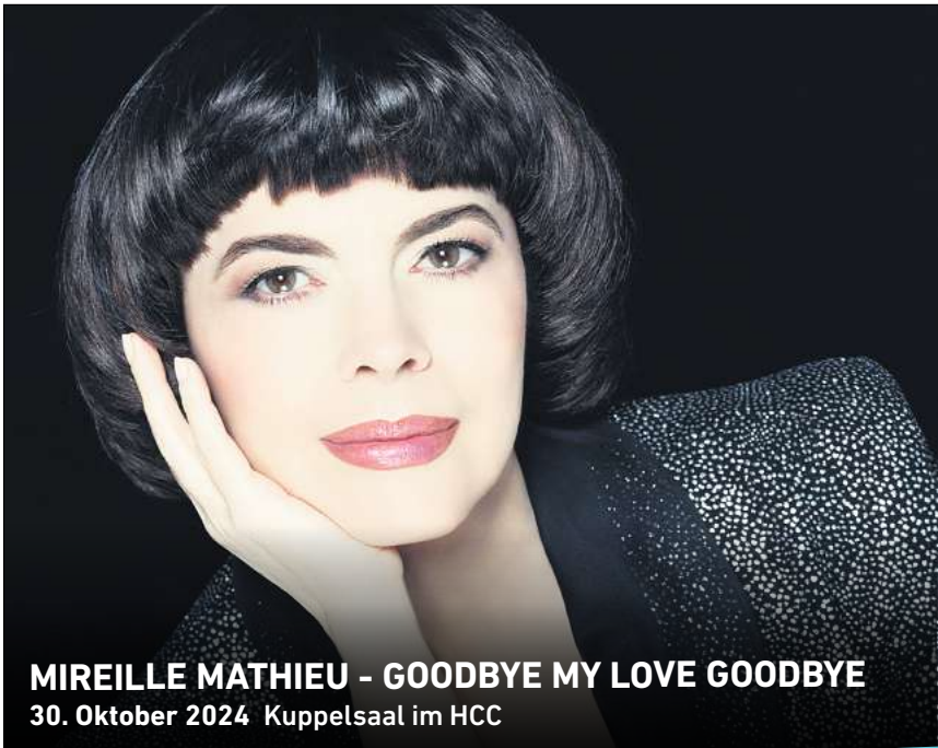
MIREILLE MATHIEU - GOODBYE MY LOVE GOODBYE 30. Oktober 2024 Kuppelsaal im HCC

► Übersicht aller Angebote: hannover.de/bewegungstraume