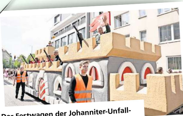
Der Festwagen der Johanniter-Unfall-Hilfe war ein echter Blickfang.