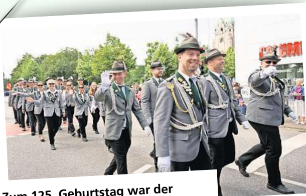
Zum 125. Geburtstag war der Schützenverein Nenndorf zu Gast.