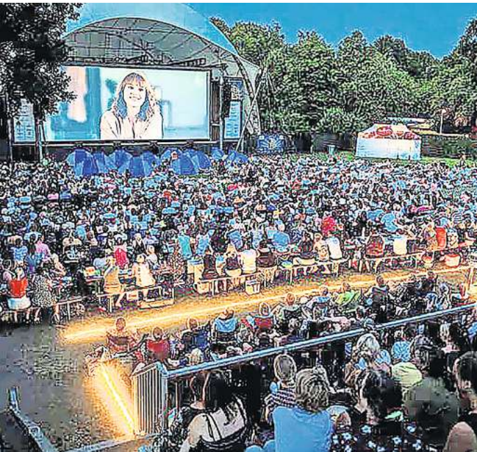
Ein tolles Ambiente bietet das Seh-Fest auf der Gilde-Parkbühne.

14. Juli, bis Sonnabend, 5. August, der Eintritt kostet wie im Vorjahr 9 Euro. Einlass ist jeden Abend ab 20 Uhr, Filmbeginn ab etwa 21.30 Uhr. Sonntags ist Pause. 1400 Gäste pro Abend