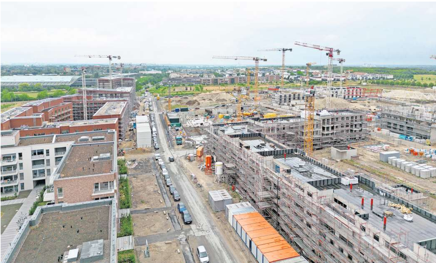
Nachfrage nach Wohnungen bleibt hoch: Am Südrand des Kronsbergs wird nun auch der letzte Abschnitt des Neubaugebiets Kronsberg mit weiteren 1200 Wohnungen entwickelt.