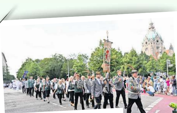
Die Ritzebütteler Schützengilde war aus Cuxhaven nach Hannover gereist.