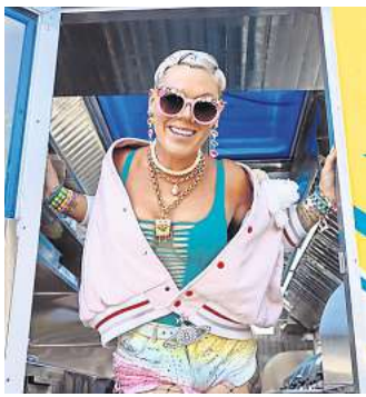
Pink kommt kommende Woche für zwei Shows nach Hannover.

Pink ist am Mittwoch und Donnerstag, 12. und 13. Juli, bei gleich zwei Auftritten hintereinander in der Heinz-von-Heiden-Arena in Hannover zu sehen und zu hören. Begleitet wird sie dabei von der irischen Rockband The Script, von der deutschen Electropop-Band ClockClock und von DJ und Produzent Kid-CutUp. Für beide Shows gibt es noch Karten ab 95 Euro.