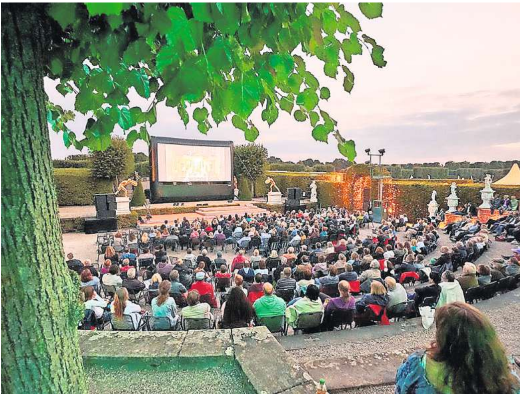
Die Sommernächte im Gartentheater laden zum Freiluftkino ein.

► Fünf Filme an zwei Wochenenden präsentiert der Bürgerverein Kleefeld, der am 12. und 13. sowie vom 25. bis 27. August seine mobile Leinwand im Kleefelder Bad (Annabach), Haubergstraße 17, aufbaut. Zur Eröffnung am 12. August, 20 Uhr, begleitet das Caspervik Trio live die teuerste Produktion in der