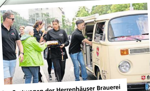
Am Festwagen der Herrenhäuser Brauerei wurden Erfrischungen gereicht.