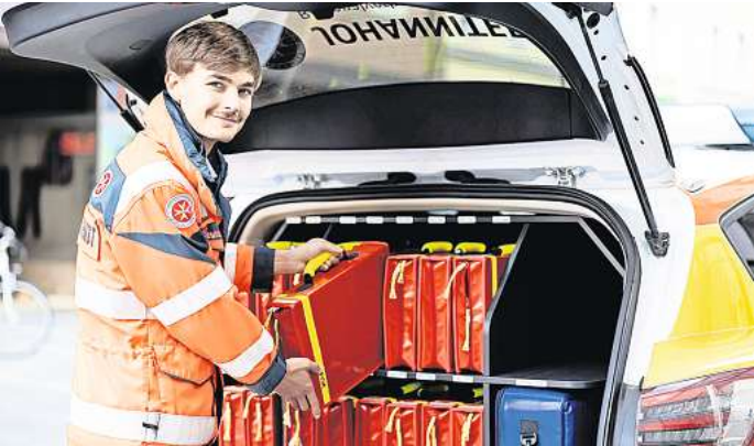
Ein Freiwilligendienstleistender der Johanniter im Bereich Hausnotruf.

Info-Abend: Alle Fragen rund um das FSJ beantworten die Johanniter am Donnerstag, 13. Juli von 18 bis 20 Uhr in der Johanniter-Dienststelle, Kabelkamp 3, 30179 Hannover. www.johanniter.de/fsj-hannover