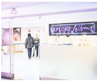
Die Ausstellung „Explore! Leibniz“ widmet sich dem Universalgelehrten.