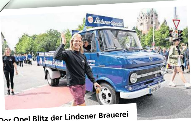
Der Opel Blitz der Lindener Brauerei stammt aus dem Jahr 1968.