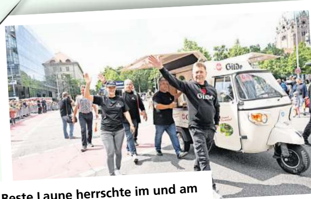
Beste Laune herrschte im und am Oldtimer der Gilde-Brauerei.