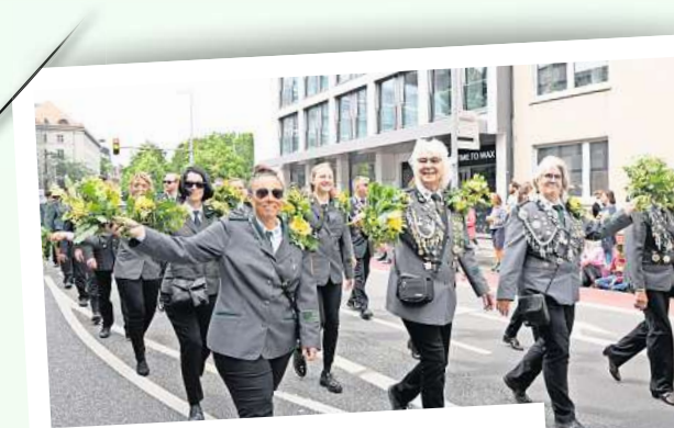
Mit Blumen grüßte der Schützenverein Engelbostel die Besucher am Rand.