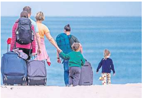
Auch wenn die Sonne lockt: Das unentschuldigte Fernbleiben vom Unterricht kann mit einer Geldbuße von bis zu 1000 Euro geahndet werden