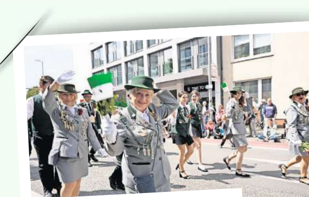
Die Misburger Schützengesellschaft hatte grün-weiße Fahnen zur Hand.