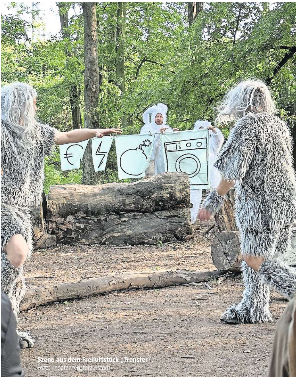
Szene aus dem Freiluftstück „Transfer“

Das THEATER FENSTERZURSTADT begibt sich mit „Transfer“ ins offene Gelände des Schulbiologiezentrums