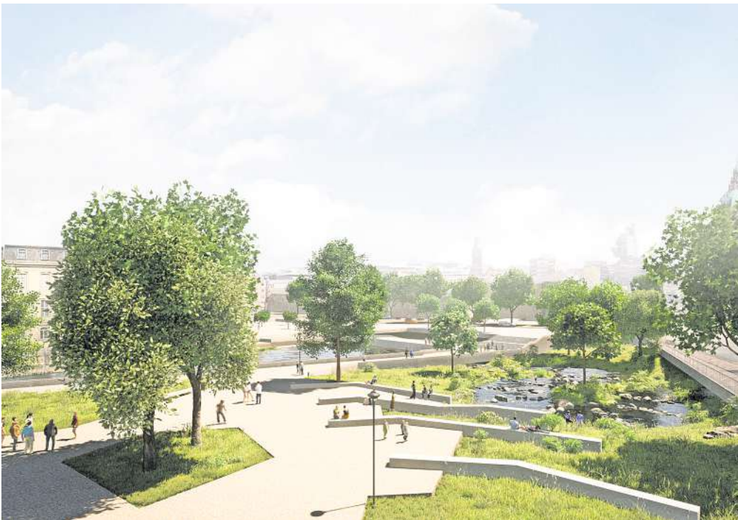
So könnte die Leine renaturiert werden: Visionen vorgestellt von Leinewelle und cityförster mit Fischereiverband und Anglerverein.