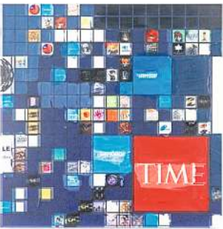
Simon Denny: Metaverse Landscape 21: The Sandbox Land (-2, -23), 2023.

Die Ironie dabei: Für die Gewinnung dieser anorganischen Chemikalien werden durch den Menschen Schäden in natürlichen Ökosystemen verursacht, die mehr als „nur“ die Pflanzenwelt vernichten. Am Ende, auf den Punkt gebracht, den Lebensraum, auf den der Mensch angedeutet wiesen ist. Vielleicht braucht der Mensch ja auch die künstliche Intelligenz, weil die naturgegebene und selbst vertiefte an manchen Stellen versagt hat? Wer Lust hat,