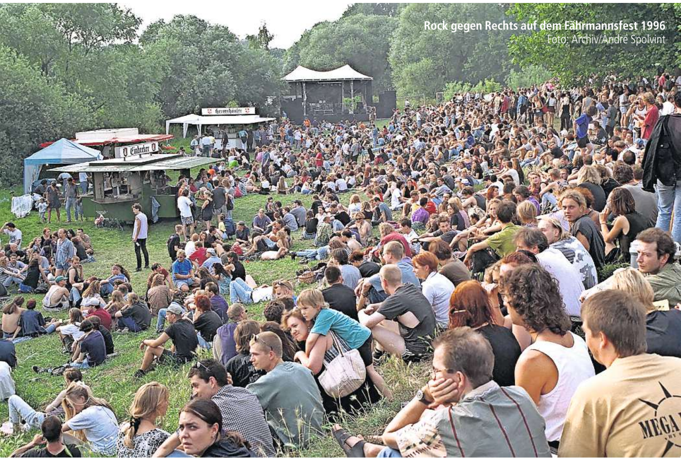
Rock gegen Rechts auf dem Fährmannsfest 1996