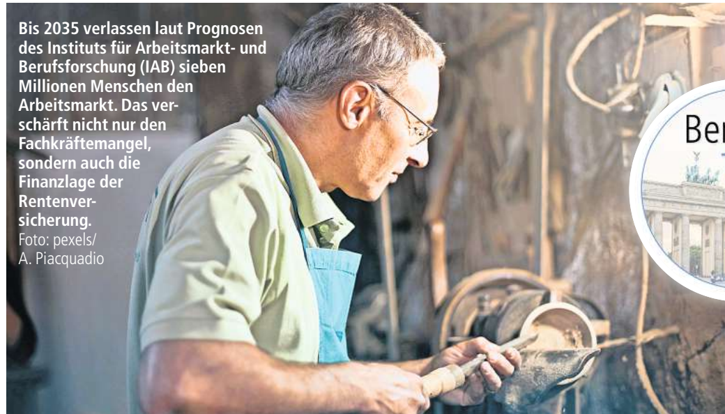
Bis 2035 verlassen laut Prognosen des Instituts für Arbeitsmarkt- und Berufsforschung (IAB) sieben Millionen Menschen den Arbeitsmarkt. Das verschärft nicht nur den Fachkräftemangel, sondern auch die Finanzlage der Rentenversicherung.

Doch der DEMOGRAFISCHE WANDEL schlägt wohl nicht so stark zu wie befürchtet