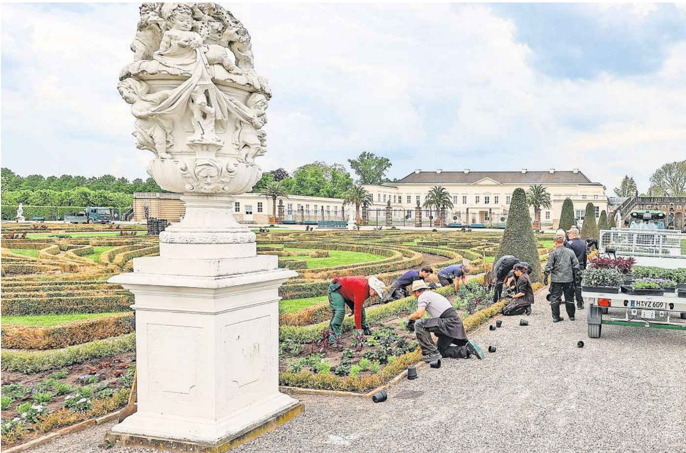
Viel zu tun: Bis Pfingsten sollen im Großen Parterre der Herrenhäuser Gärten rund 30.000 Pflanzen im Boden sein. Insgesamt sind es fast 75.000.

„Je nach Pflanzenart können wir Lichtverhältnisse, Tempera-