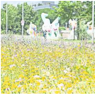
Hannover blüht auf: Wie hier am Leibnizufer.

An den neuen Flächen stellt die Stadtverwaltung kleine Informationsschilder auf, die auf den besonderen Wert der Areale für den Artenschutz und die Artenvielfalt hinweisen: „Hier entsteht eine Blühfläche für Insekten“ oder „Hier entsteht ein Habitat für Insekten“, heißt es da. Wildbienen und Falter etwa sind auf diese heimischen Wildpflanzen spezialisiert. „Deshalb ver-