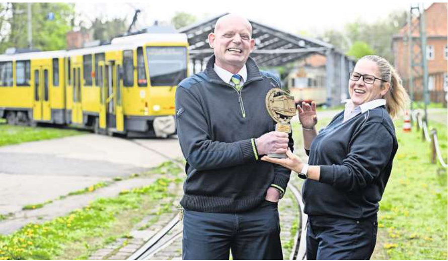
Die Europameister der Üstra im Tramfahren trainieren im Straßenbahnmuseum Sehnde für die Titelverteidigung.

Am 3. Juni treten nun im rumänischen Oradea 25 Teams gegeneinander an – aus Barcelona, Basel und Bordeaux, aus Warschau und Wien. Die Mission des Üstra-Duos dabei ist klar: „Wir wollen