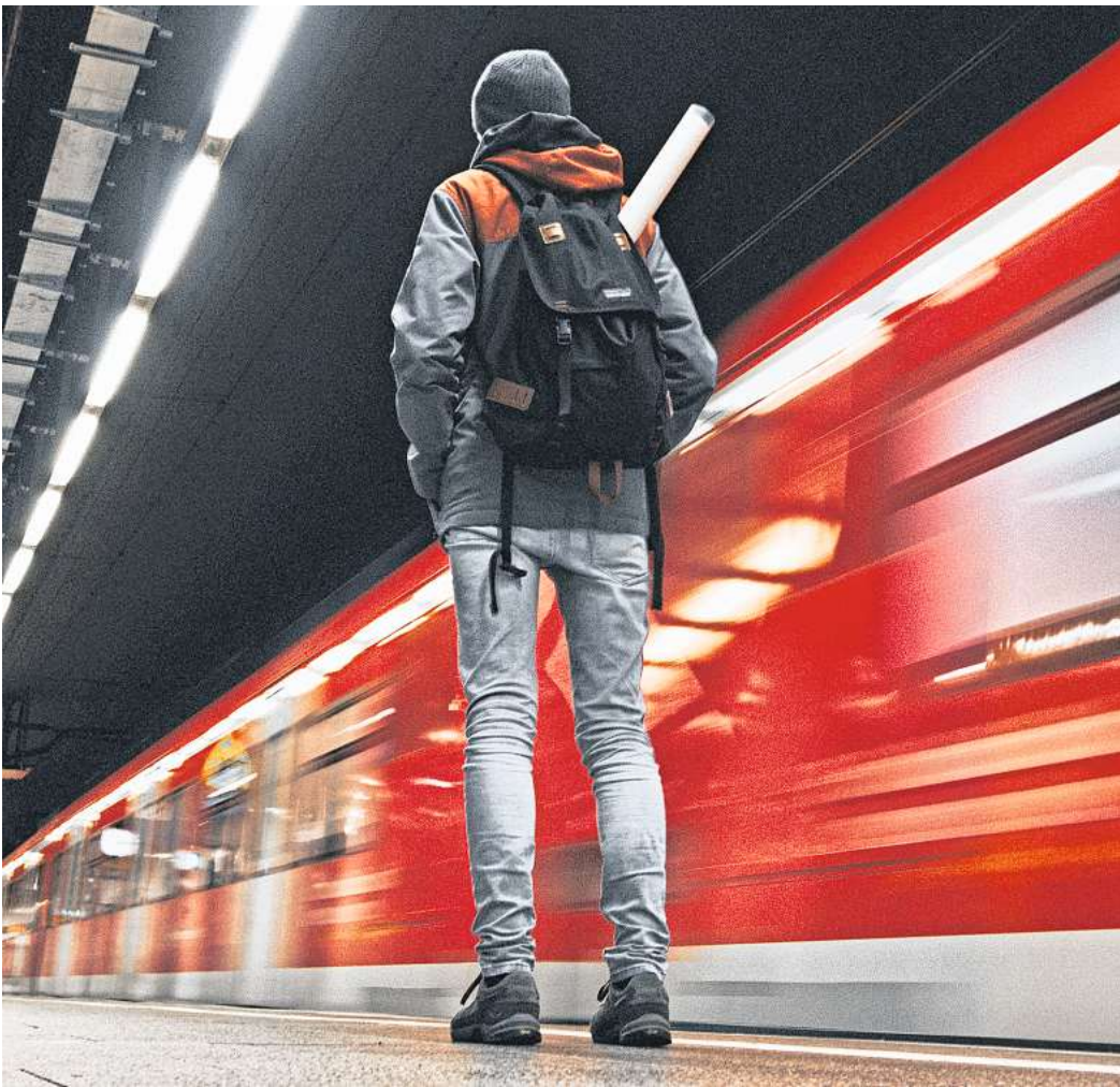
Mit dem 49-Euro-Ticket zur Arbeit fahren, statt das Auto zu nutzen: Funktioniert das in der Praxis?