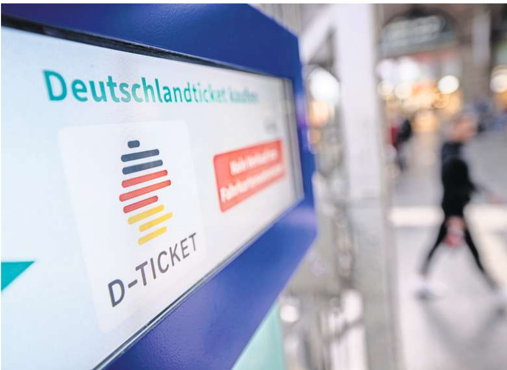
Nahverkehrskundinnen und -kunden in der Region Hannover mussten sich gedulden: Beim Deutschlandticket hatte es Verzögerungen gegeben. Nun ist es für 49 Euro im Monat erhältlich.

Nach Angaben von van Zadel handelt es sich bei dem Computervirus, der von den Hackern um eine sehr aggressive Variante.