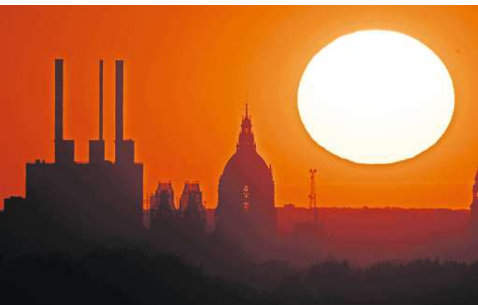
Hitzeaktionspläne sollen auf lokaler Ebene die Bevölkerung schützen.

Für die zweite Hälfte des Jahrhunderts sagen Experten einen höheren Jahresmittelwert für die Temperaturen von 1,1 bis 3,4 Grad voraus. Kommt der höhere Wert zum Tragen, hätte die Region Werte, wie sie aktuell in Mailand oder Venedig gemessen werden. Mit bis zu 80 Sommertagen und bis zu 16 heißen