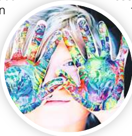
Kunterbunter Ferienspaß.