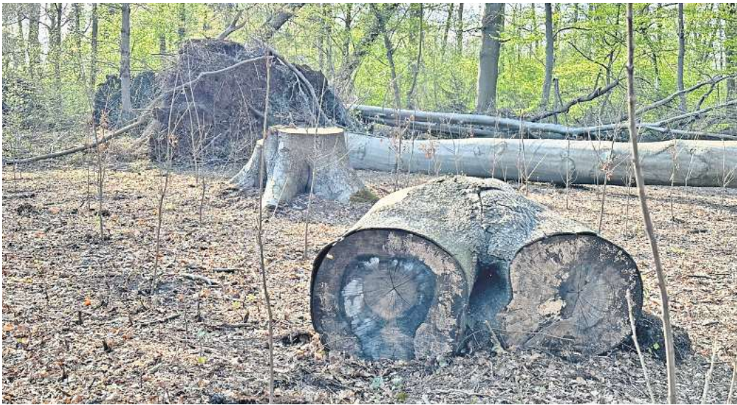
Umgestürzte Bäume in der Seelhorst.