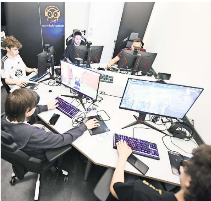
Sieht aus wie Freizeit, ist aber Arbeit: Die Spieler der beiden E-SportsTeams der hannoverschen Dr.-Buhmann Schule trainieren.

Studierende fordern E-Sport-Vermarktungszweig, Fach macht Hochschule bekannt