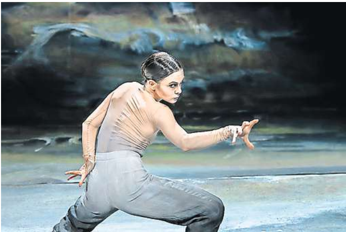
„Ganz nah dran“: Der Fotograf Ralf Mohr hat das Staatsballett in Hannover begleitet.

Die GAF, Seilerstraße 15d, ist Donnerstag bis Sonntag von 12 bis 18 Uhr geöffnet. Der Eintritt ist frei. RED