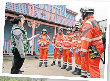
Aufmerksam: Die A-Mannschaft des Ortsverbandes Hannover-Wasserturm beim Wettkampf.