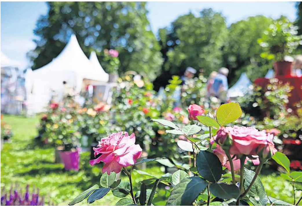
Das Gartenfestival Herrenhausen lädt zum Bummeln ein.