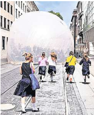
Das Städtoskoop kommt nach Misburg.