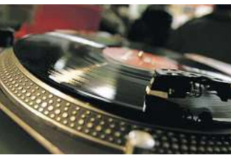
Oft totgesagt aber immer noch da: Die Schallplatte. Am 22. April ist wieder Record Store Day.

was den Tag ausmacht“, sagt Olaf Töpelmann von Ohrwurm. Denn auch der Laden mit der nach eigener Aussage „größten CD-Auswahl Hannovers“ beteiligt sich beim Plattenladen-Tag. Laut Laden-Finder, der offiziellen Website, machen in Hannover die Plattenläden 25 Music in der Kronenstraße 12, Monster Records im Skate-Shop Titus in der Goseriede 13A, Ohrwurm in der Deisterstraße 32 und Rockers Records in der Weckenstraße 1 bei dem Aktionstag mit einer Auswahl an Platten mit. „Wir konnten nur einen Teil der Releases bestellen, das sind schnell Investitionen in Höhe eines Neuwagens“, sagt Olaf Töpelmann von Ohrwurm. Die Geschäfte müssen die teilweise sehr teuren Platten vorbestellen und bezahlen – durchaus ein Geschäftsrisiko, wie sich die letzten Jahre zeigte. „Wir denken aber, dass wir eine gute Auswahl getroffen haben“, so Töpelmann. Teil des Feiertags für Platten sind auch In-Store-Konzerte.