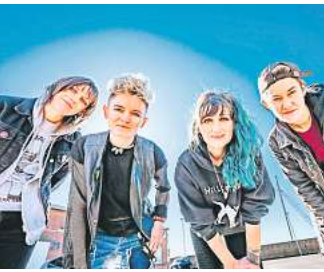
Die Ramonas rocken im Béi Chéz Heinz.

Mädels auch noch viel besser aus als die Originale Joey, Johnny, Dee Dee und Tommy. Auf dem Programm steht neben Ramones-Songs auch Material von ihrer neuen Platte „Haphazard“. Und natürlich eine furiose explosive Show, von der auch Ritchie und CJ Ramone Fans sind.