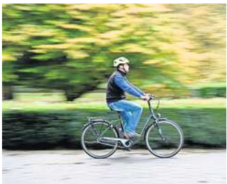
Eine Studie der MHH zeigt: Pedelec-Fahren hat trotz elektrischer Unterstützung positive Effekte auf den Körper.

alltägliche körperliche Aktivität. „Viele Pedelec-Nutzer waren vorher nicht unbedingt Radfahrer. Die Hemmschwelle ist deutlich niedriger, wenn in hügeligem Gelände oder bei starkem Gegenwind auf die Unterstützung zurückgegriffen werden kann“, sagt Boeck. Die E-Bike-Fahrer verzichteten deshalb öfter auf das Auto als die anderen Radfahrer.