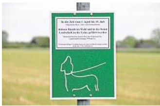
Brut- und Setzzeit: Vom 1. April bis zum 15. Juli müssen Hunde in der freien Natur an die Leine. Auf den städtischen gekennzeichneten Hundelaufflächen gilt weiterhin keine Leinenpflicht.

„Es gibt zu viele Hundebesitzer, die sich nicht an die Leinenpflicht halten“, sagte Stadthüter Pyka. Doch woran liegt das? „Viele Hundebesitzer achten auf die Pflicht, einige sind aber auch sehr arrogant. Kürzlich hat mir