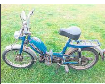
Suche altes Mofa Moped Motorrad auch defekt oder total verrostet ☎ (01 51) 11 52 02 65

Verkaufe meinen Renault Clio 16V, Bj 2011, 105.000 km, Farbe Grau Silber, TÜV Neu 01.2025 Allwetterreifen Neu, Service Neu Scheckheft gepflegt 4.5L Verbrauch günstig im Unterhalt. Fahrzeug im top Zustand. Von privat. Preis: 4750,- Euro 01782488730