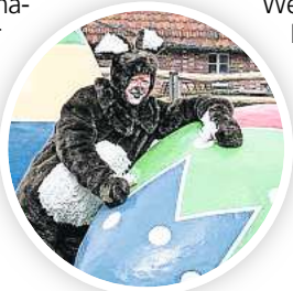
Der Osterhase auf Meyers Hof.

Georgengarten geht es mit dem GOP-Ballon hoch hinaus, am Milchhäuschen sind gegen Aufpreis Kutschfahrten möglich – für beide Angebote gilt: gutes Wetter vorausgesetzt. Im Berggarten lässt es sich schlendern durch die Schauhäuser, im Freiland bei den Frühlingsblumen oder durch die Fotoausstellung „Die besten Gartenfotos der Welt“. Mit Ausnahme der Kutschfahrten sind die Aktionen im regulären Garteneintritt enthalten. Auch im Zoo Hannover verteilt der Osterhase von 9 bis 15 Uhr Süßes für kleine Gäste. In der Dorfschule auf Meyers Hof gibt es beim Kinderschminken die Möglichkeit, selbst zum Häschen und anderem Getier zu werden. Die Aktion ist im Zoo-Eintrittspreis enthalten.