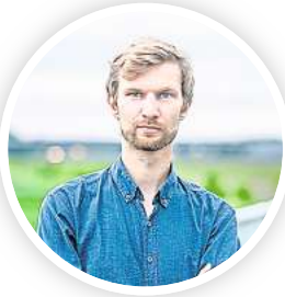
Der Fotograf Jonas Kakó

Schließlich posierten sie, reich umschwärmt und mit einem Lä-