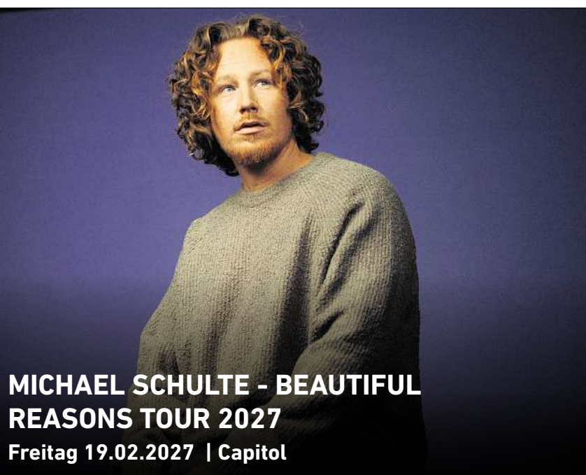
MICHAEL SCHULTE - BEAUTIFUL REASONS TOUR 2027 Freitag 19.02.2027 | Capitol