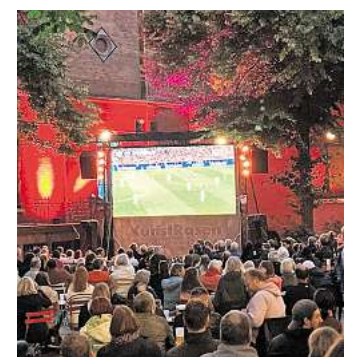
Zur Fußball-EM 2024 feierte der KunstRasen seine Premiere.

Public Viewing. Der Eintritt zu allen Veranstaltungen im Rahmen des KunstRasen ist frei. Das Platzangebot ist begrenzt. Bei Regen werden die Top-Spiele und das Kinoprogramm im Kino im Künstlerhaus gezeigt.