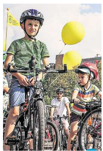
Die „Kidical Mass“ versteht sich als bunte Mitmachaktion für Familien, ist zugleich aber auch eine politische Demonstration.

➔ Weitere Informationen zur Veranstaltung gibt es im Internet unter velohannover.de/kidicalmass .