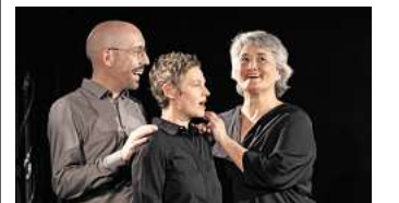
Auf Zuruf: „Tapetenwechsel“.