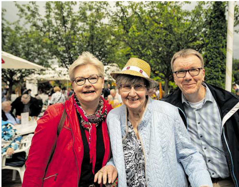
Die Hahne Residenz „Haus der Ruhe“ lädt am 7. Juni 2026 ihren diesjährigen Sommer-

fest ein. Unter dem Motto „Aloha – ein Nachmittag im Inselgarten“ verwandelt sich das Gelände der Residenz in eine sommerliche Oase voller Musik, Begegnungen und guter Stimmung.