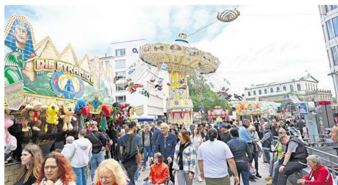
Autoscooter an der Oper, Wellenflieger am Kröpcke: Es ist wieder Kirmes mitten in der Innenstadt.

HANNOVER. Die Fahrgeschäfte drehen sich wieder: Die City-Kirmes ist zurück. Nach der Premiere im vergangenen Jahr bringt die Arbeitsgemeinschaft für Volksfeste Hannover (AGVH) das bunte Innenstadtfest erneut mitten ins Herz der Landeshauptstadt. Seit zwei Tagen und noch bis 17. Mai verwandeln sich Georgstraße, Kröpcke und erstmals auch der Opernplatz in eine große Jahrmarktsmeile zwischen Einkaufsbummel, Fahrspaß und Budenzauber.