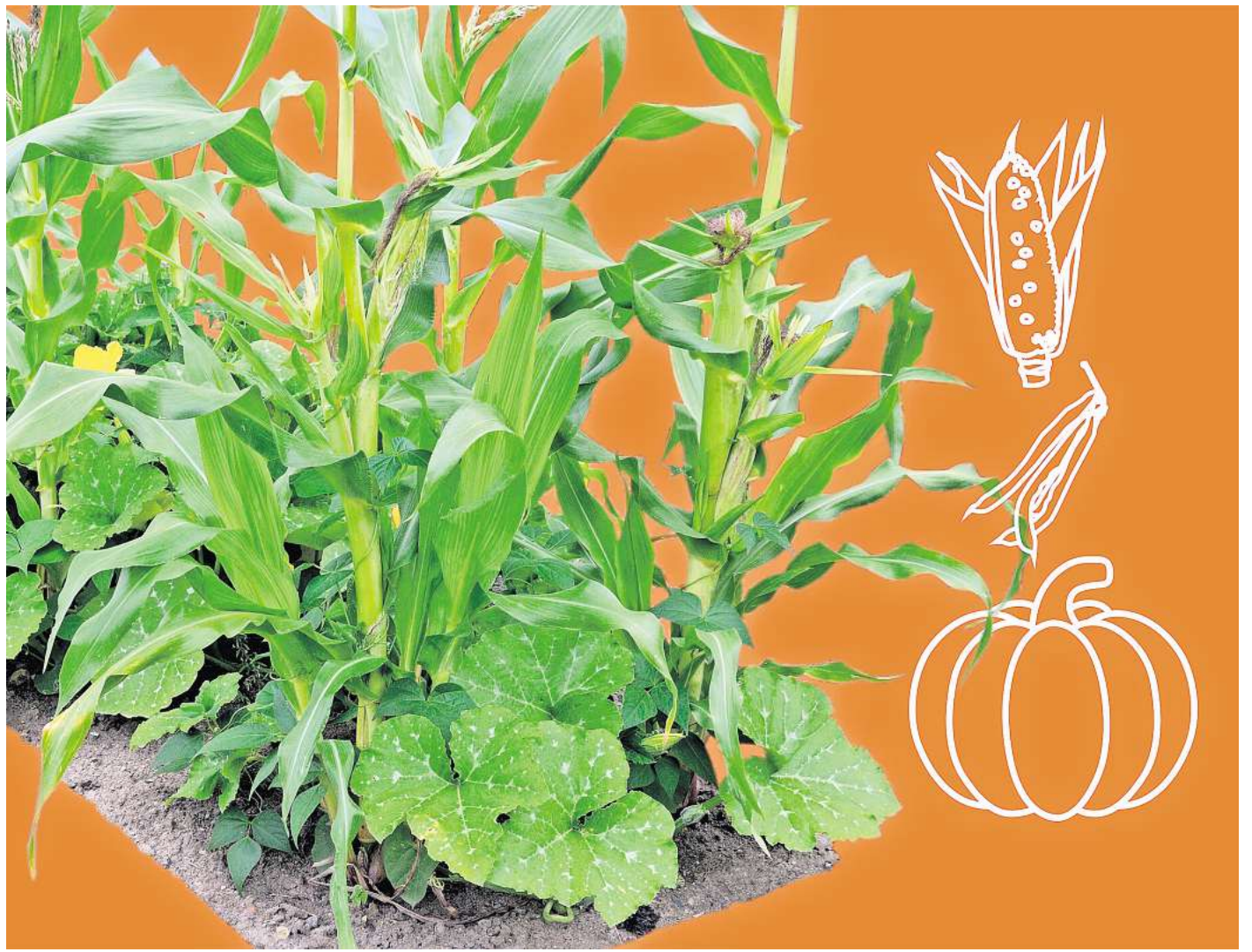
Ideal in einem Beet: Hinter den „Drei Schwestern“ verstecken sich die drei Gemüsepflanzen Mais, Bohnen und Kürbis. MONTAGE: PATAN/RND; FOTO: WILDLIFE/PICTURE ALLIANCE

Trotz der Vielfalt im Beet braucht der Anbau der drei Schwestern keine großen Flächen: Das Milpa-Prinzip funktioniert bereits auf rund 1,5 mal 1,5 Metern – in angepasster Form sogar im Hochbeet oder in großen Kübeln. Entscheidend sind ein warmer Standort, humoser