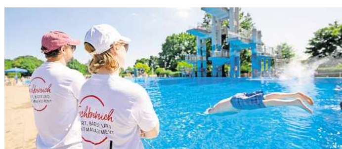
Werden vor allem im Sommer gebraucht: Rettungsschwimmer im städtischen Lister Bad.

„Wir können auch noch im Laufe des Sommers einstellen“, berichtet Bernath. Benötigt würden zusätzliche Kräfte am Be-