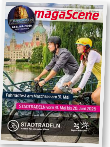
Fahrradfest am Maschsee am 31. Mai STADTRADELN vom 31. Mai bis 20. Juni 2026 STADTRADELN 25 Jahre

etwas Spektakuläres sein! Bei der Salzgitter AG kann man auch in diesem Jahr aus Metallteilen eine Rose basteln. Und es wird dort wieder lange Schlangen geben, für ein vergleichsweise einfaches Exponat. Für einen anderen Aussteller war