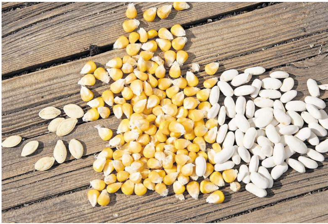
Teamwork im Beet: Mit Kürbis, Mais und Bohnen werden drei unterschiedliche Samenkulturen ins Milpa-Beet gesetzt.

quelle, Bohnen sind äußerst proteinreich und Kürbis bietet Vitamine, Mineralstoffe und sekundäre Pflanzenstoffe als Ergänzung – und als Drei-Schwester-Eintopf schmeckt das Ganze auch noch ausgesprochen lecker.“