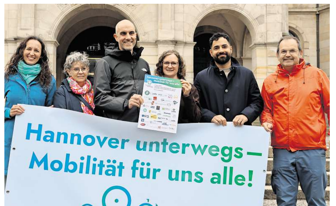
Übergabe des offenen Briefs an Oberbürgermeister Belit Onay (3. v.l.): Vertreterinnen und Vertreter des Bündnisses „hannover unterwegs“ kamen vor dem Neuen Rathaus in Hannover zusammen, um ihre Forderungen deutlich zu machen.

Die Unterzeichner fordern unter anderem breitere und barrierefreie Gehwege, sichere Querungen an Schulen und Kitas, ein besser ausgebautes Radwegenetz sowie mehr Verkehrsberuhigung in Wohnquartieren. Auch Tempo 30 als Regelschwindigkeit innerhalb geschlossener Ortschaften gehört zu den zentralen Forderungen. Tempo 50 soll nach Vorstellung des Bündnisses künftig nur noch auf geeigneten Hauptverkehrsstraßen gelten.