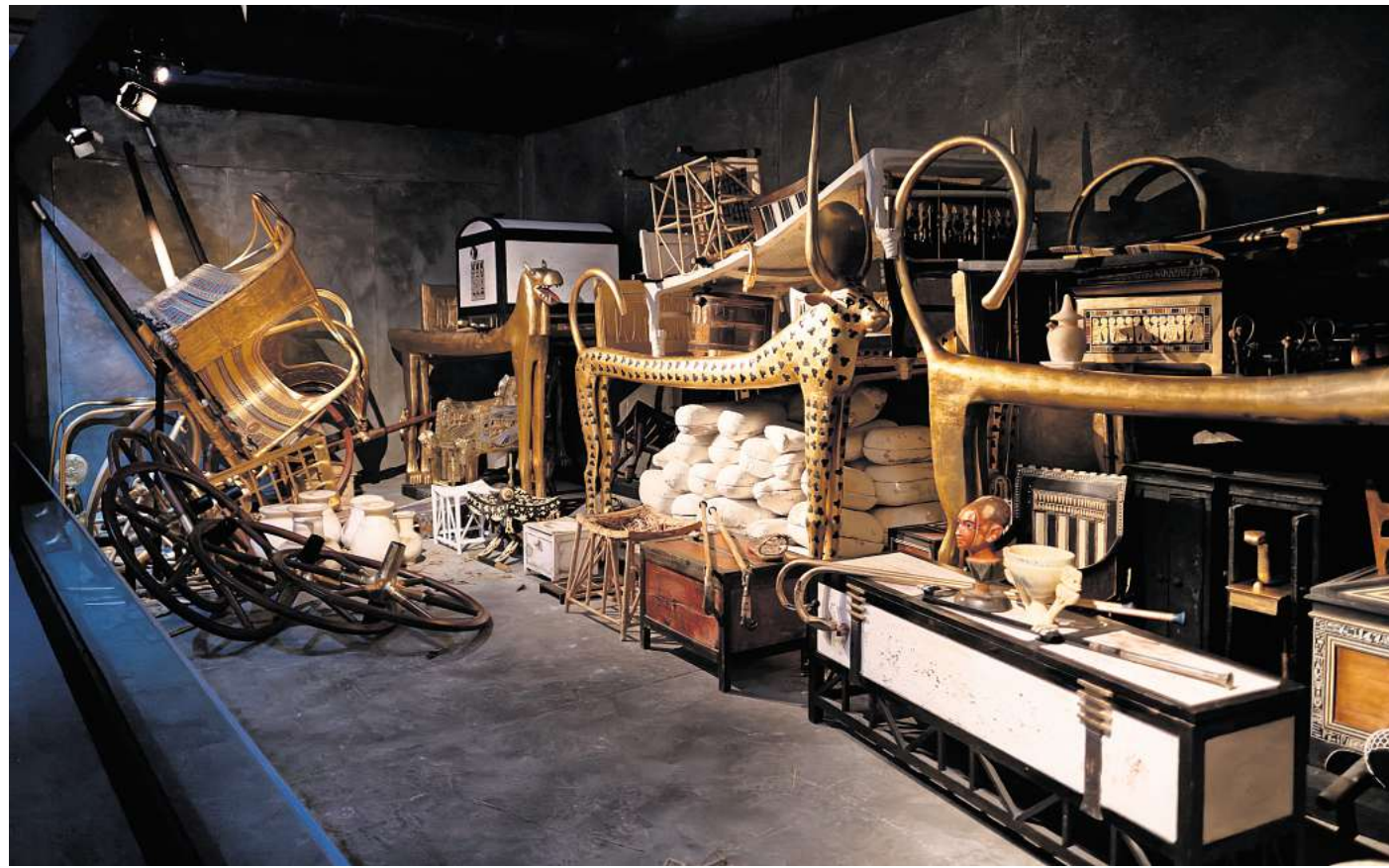
Über 800 Repliken: Das Herzstück der Ausstellung ist die Nachbildung der Grabkammern, wie Howard Carter sie 1922 entdeckte.