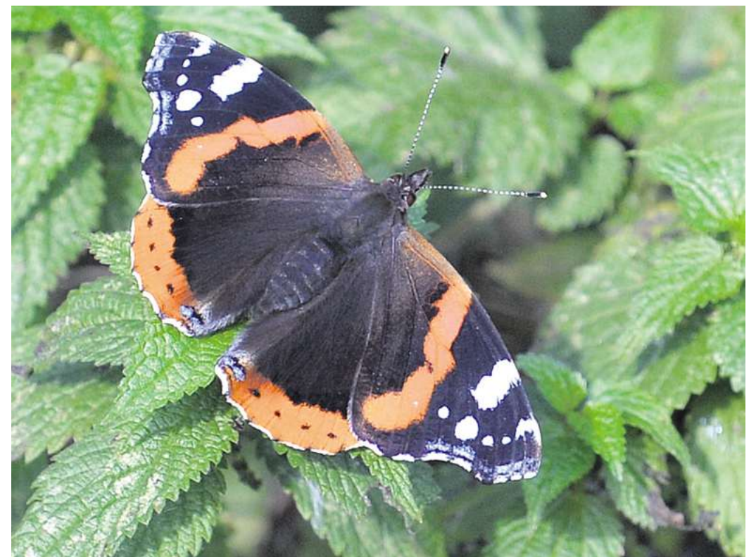
Mehr als Unkraut: Brennnesseln sind eine wichtige Nahrungsquelle für Admiral-Raupen.

Blut-Weiderich: Mit seinen rosa Blüten ist der Blut-Weide-