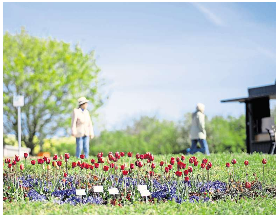
Da blüht was: Die Landeskartenschau läuft bis zum 18. Oktober 2026.

Denn am Ende ist es oft weniger der einzelne Trick, der über Erfolg oder Misserfolg entscheidet, sondern das große Ganze. Krause empfiehlt deshalb, Pflanzen immer passend zum Standort auszuwählen – also abhängig von Boden, Klima, Licht und Wasserverfügbarkeit. „Es sollte das Motto gelten: Gärtnern mit der Natur und nicht gegen sie.“