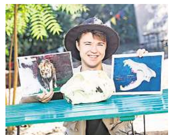
Zoo-Scouts vermitteln Wissen rund um Tiere.

Der Eintritt zum Familienfest ist im regulären Zooeintritt enthalten, Jahreskarten gelten ebenfalls. Einige Mitmachangebote werden gegen einen Selbstkostenbeitrag angeboten. RED