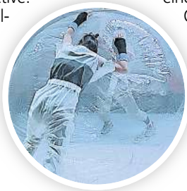
Das tilted collective zeigt die Performance „Couldn't care less“.

HANNOVER. Zwischen Tanz, Objekttheater und feministischer Performance bewegt sich die neue Produktion „Couldn't care less“ des Künstlerinnen-Netzwerks tilted collective.