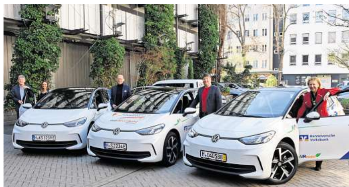
Im Rahmen des Sozialprojekts VRmobil wurden drei Initiativen aus der Region mit Fahrzeugen ausgestattet.