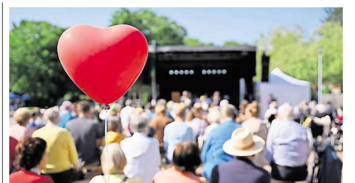
Das Stephansstift lädt zum Jahresfest ein.