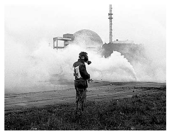
Ein Mann mit Gasmaske in Tschernobyl: Die Fotografien von Hermine Oberück dokumentieren die Folgen der nuklearen Katastrophe.

tin Anja Ritschel. Begleitend präsentieren sich mehrere Initiativen mit Informationsständen, darunter der energy-Fonds proKlima, die Klimaschutzagentur Region Hannover und die Bürgerinitiative Umweltschutz. Auch die Ausstellung von Hermine Oberück bleibt an diesem Abend geöffnet. Die Teilnahme an der Diskussion ist ebenfalls kostenlos. RED