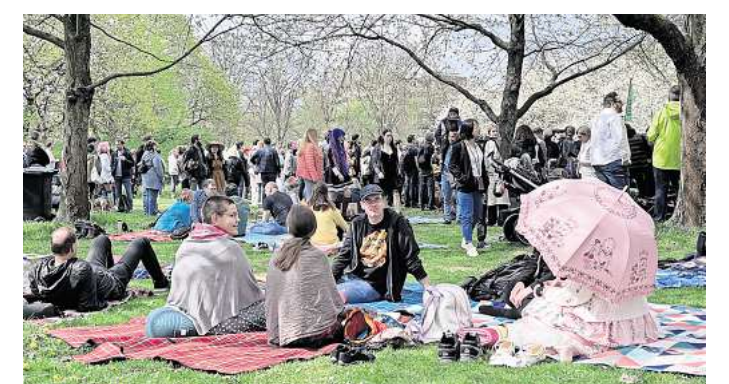
Kirschblütenfest im Hiroshima-Hain.

der schwierigen Parksituation wird die Anreise mit Bus und Bahnen empfohlen mit der Linie 6 (Haltestelle: Bult / Kinderkrankenhaus auf der Bult) oder den Bus-Linien 800/128/134/373 (Haltestelle Mensingstraße/ Kinderkrankenhaus auf der Bult). Bei schlechtem Wetter muss die Veranstaltung ausfallen. Aktuelle Informationen dazu gibt es online unter hannover.de sowie auf facebook.com/twincitieshannover . R/HR