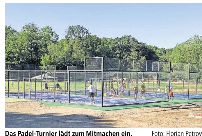
Das Padel-Turnier lädt zum Mitmachen ein.