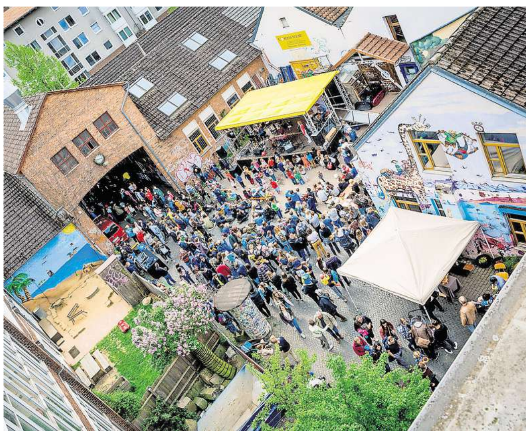
Buntes Treiben im Mittelgang: Zwischen Kinderprogramm, Mitmachaktionen und Info-Ständen gibt es beim 1. Mai-Fest für alle Generationen etwas zu entdecken.

schichtigen Indie-Sound präsentiert. Am frühen Abend bringt Gönnermusik 79 ab 18.30 Uhr mit Hip-Hop und Pop die Stimmung nach oben, ehe Milli um 19.45 Uhr mit schnellen Beats