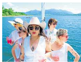
Live: fab bringen Synthie-Punk auf die Hauptbühne.

Übrigens: Wer reinfeiern will, ist am Donnerstag, 30. April, in der 60er-Jahre-Halle und im Mephisto auf dem Faust-Gelände richtig. Dort geht es ab 22 Uhr (im Mephisto ab 24 Uhr) mit „Faust in den Mai“ mit zwei Floors, auf denen getanzt wird. In der 60er-Jahre-Halle legen itshelggaby, Dan Hammond und Fräulein Holle auf, im Mephisto gibt's ein Newcomer-Lineup. Der Eintritt kostet an der Abendkasse 14 Euro. R/HR