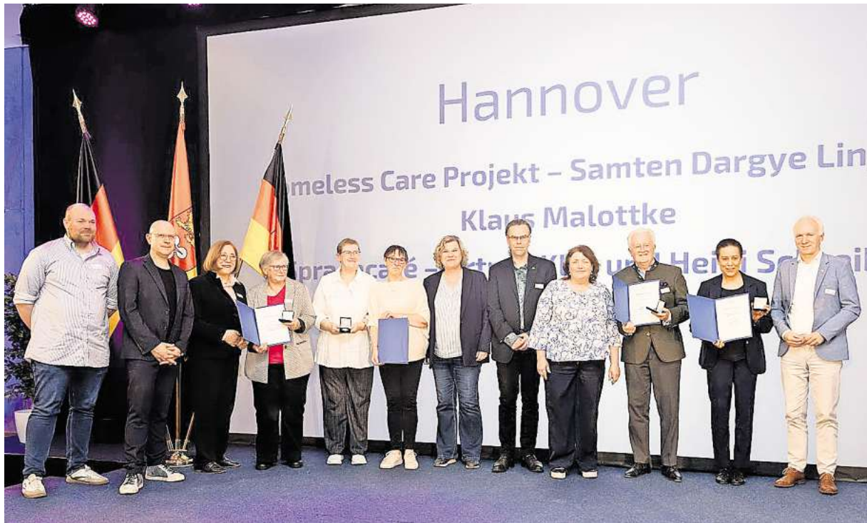
Die ausgezeichneten Ehrenamtlichen aus Hannover bei der Preisverleihung.

Ein Beispiel ist das Homeless Care Projekt des Vereins Samten Dargye Ling am Tibet Zentrum. Seit 2020 versorgen Ehrenamtliche wohnungslose Menschen in der Innenstadt von Hannover mit Lebensmitteln. Mehrmals pro Woche sind sie mit Lastenrädern unterwegs, um entlang fester Routen Unterstützung zu leisten. Neben der Versorgung mit Essen gehört auch das Gespräch dazu – ein Angebot, das