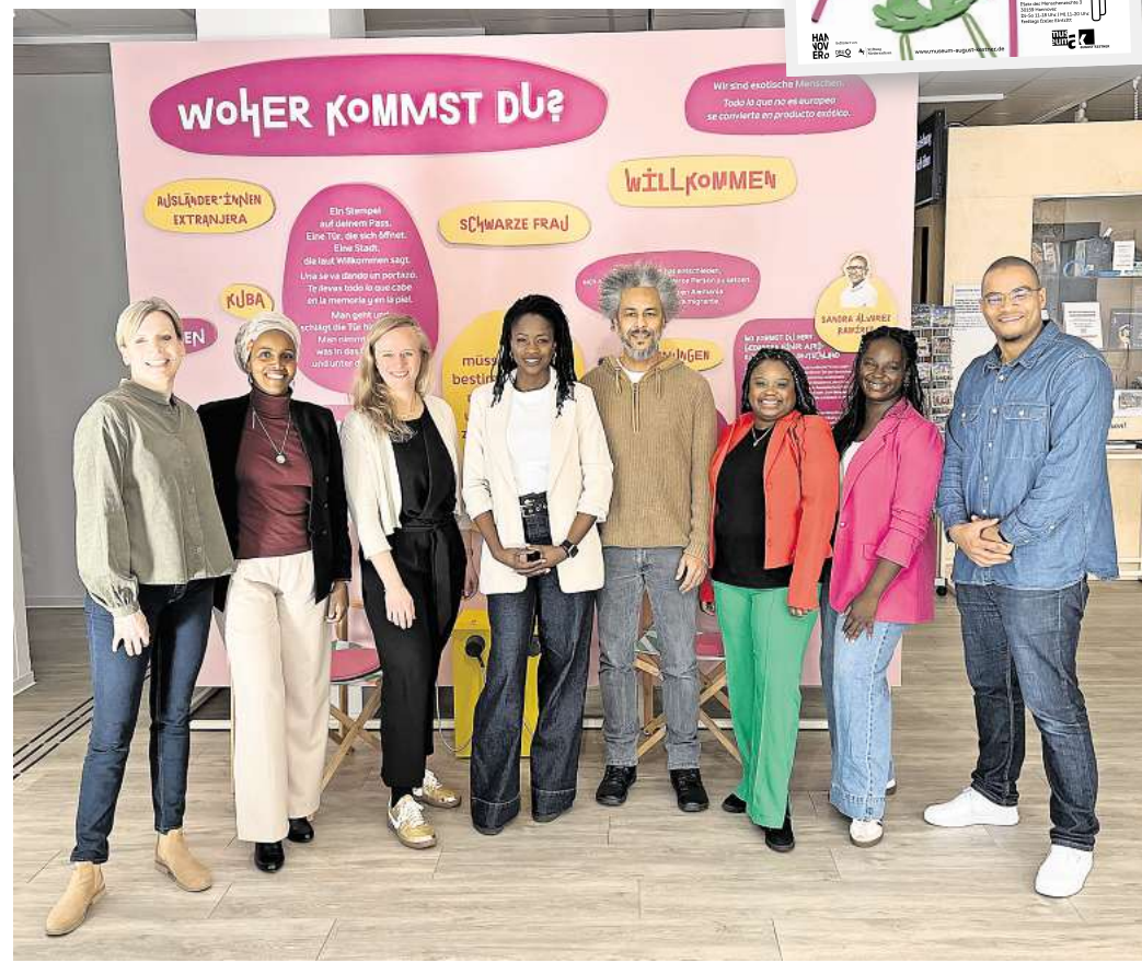
Das Projekt- und Kuratorenteam im Hannover Kiosk.