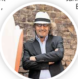
Kamel Louafis Lebenswerk wird in einer Wanderausstellung thematisiert.

Der Besuch der Ausstellung sowie aller Veranstaltungen ist kostenlos. Sie kann zu den Öffnungszeiten des Bürgersaals im Neuen Rathaus besucht werden. RED