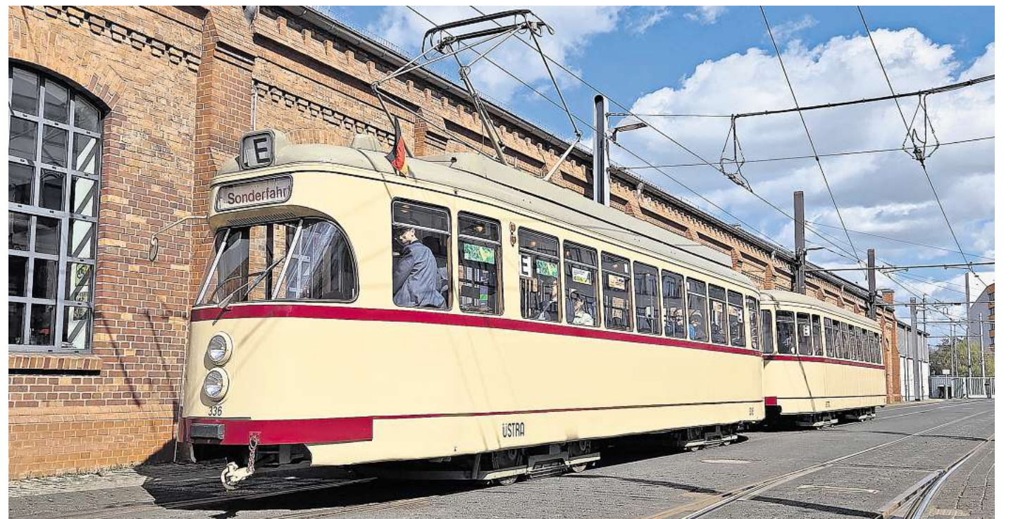
Sonderfahrt mit dem einzig noch erhaltenen Großraumwagen TW 336 und seinem Beiwagen 1304.

Zu beachten ist, dass die historischen Fahrzeuge nicht barrierefrei sind. Aufgrund ihrer Bauweise müssen beim Ein- und Aussteigen Stufen überwunden werden, auch im Innenraum gibt es Einschränkungen. Rollstühle, Fahrräder und große Kinderwagen können nicht mitgenommen werden. Zudem gelten weder reguläre ÜSTRA-Tarife noch Deutschland- oder Niedersachsensticket für diese Sonderfahrt. RED