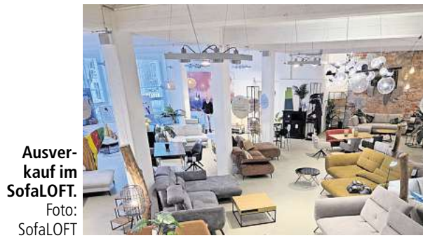
Ausverkauf im SofaLOFT.