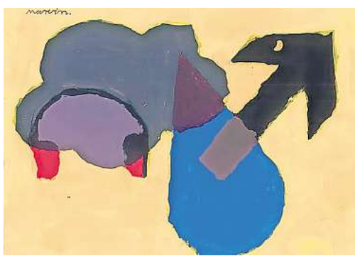
Junge Kunst aus Niedersachsen – Stier-Marvin: Gefühle