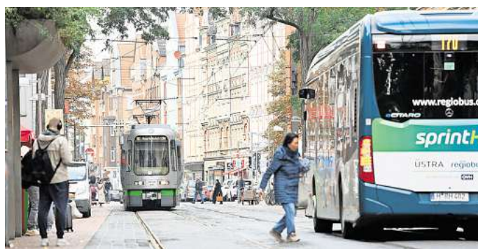
Bus und Bahn auf der Limmerstraße: „Wir wollen weitere Fahrgäste mit dem eTarif gewinnen.“