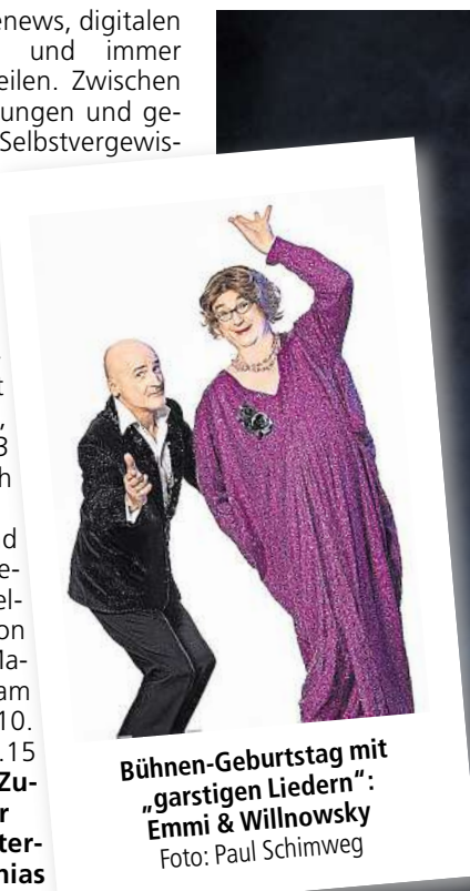
Bühnen-Geburtstag mit „garstigen Liedern“: Emmi & Willnowsky

Mit „JA SORRY!“ ist Timo Wopp am Dienstag, 17. März, ab 20.15 Uhr im Apollo zu Gast. In seiner Zusatzshow bewegt sich der preisgekrönte Stand-up-Comedian zwischen Selbstironie und gesellschaftlicher Analyse. Er nimmt eigene Widersprüche ebenso ins Visier wie aktuelle Debatten und lotet