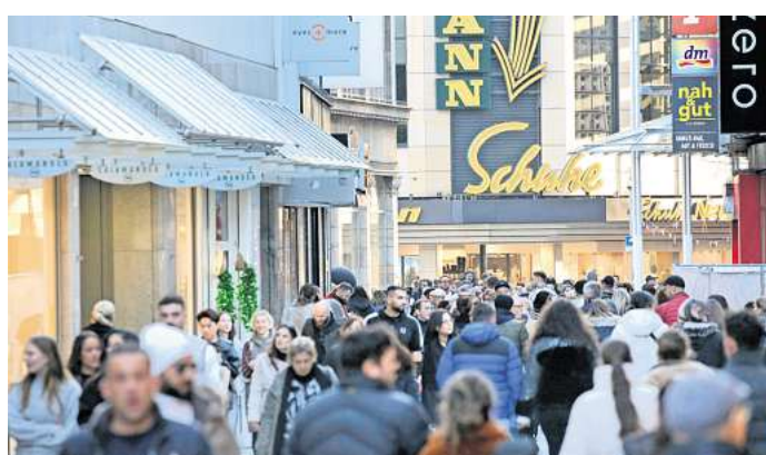
Viele Besucher kommen zum verkaufsoffenen Sonntag in Hannover.