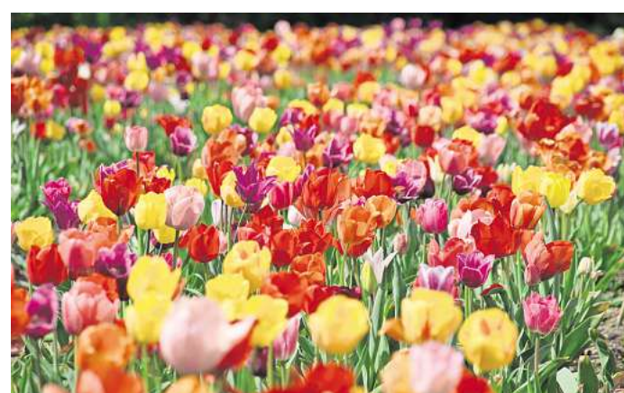
In einer hohen, schmalen Vase wachsen sie am besten: Tulpen.

Sie sind der Klassiker unter den Winterblumen – bereits zum Jahresbeginn gibt es Tulpen überall zu kaufen. In einer hohen, schmalen Vase wachsen sie am besten, erläutern die Fachleute. Nach dem Kauf lässt man sie am besten kurz im Papier ruhen. Tulpen brauchen nur eine kleine Schicht Wasser und in den ersten Stunden keine Schnittblumennahrung.