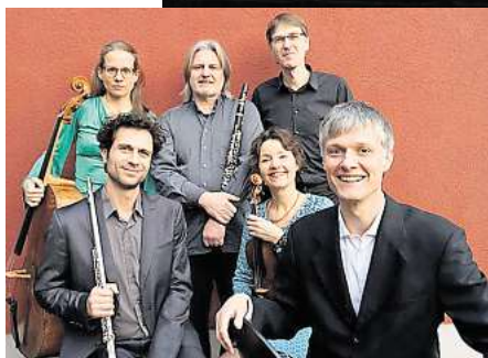
Das Neue Ensemble spielt sein „Neujahrskonzert à la Valentin“.

aus fünf Jahrzehnten und spontanen Gesangseinlagen entsteht eine mitreißende Silvestersause, die Generationen verbindet. Der Einlass beginnt um 20 Uhr, Tickets kosten im Vorverkauf 41,60 Euro, ermäßigt 35 Euro, an der Abendkasse 45 Euro beziehungsweise 40 Euro.