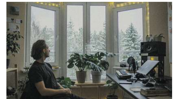
Planung und Reflexion: Im Winter ist im Garten weniger zu tun.

Im Winter fällt Licht anders als im Sommer, aber genau das macht die Beobachtung wertvoll. Ein paar Tage lang lässt sich