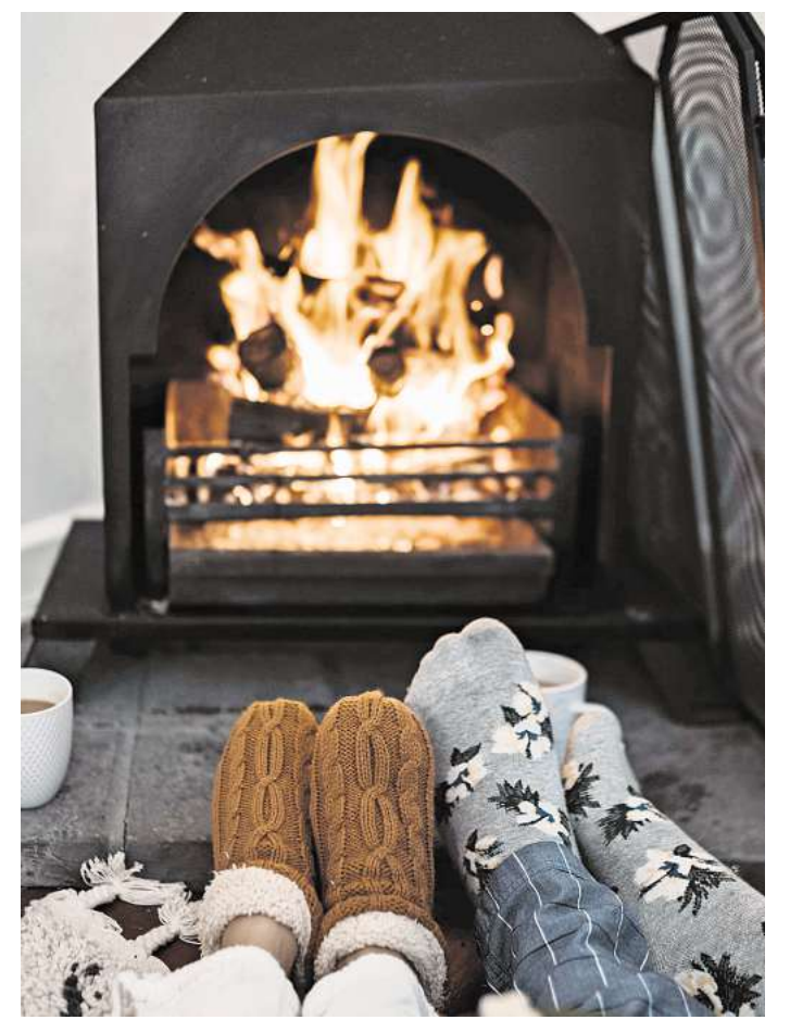
Eine kleine Auszeit vor dem Kamin (oder an der Feuerzone) spendet wohlige Wärme und Energie für bevorstehende Aufgaben.

fen noch alles ändern muss. Vielleicht ist sie genau deshalb so wertvoll: weil sie uns erlaubt, uns selbst wieder einzusammeln, bevor wir ins neue Jahr hinübertreten.