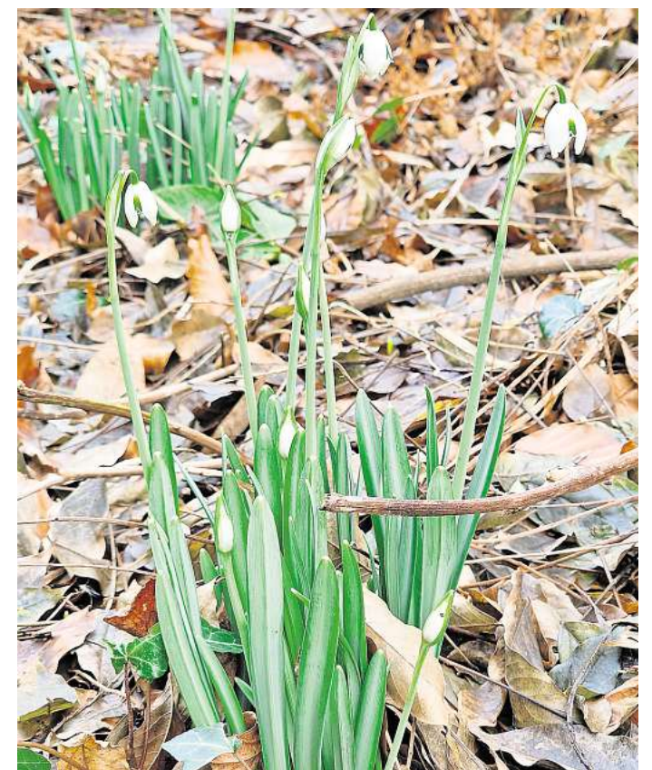
Die meisten Stauden, Knollen- und Zwiebelpflanzen ziehen sich in ihre Überdauerungsorgane im wärmeren Boden zurück und verbringen dort den Winter, bevor sie im Frühjahr wieder austreiben.

Das können manche Pflanzen ähnlich gut wie wir: Wenn man sich einer Sache nicht stellen möchte, setzt man auf Flucht. Das machen zum Beispiel viele Stauden und Gräser. Sie sterben nach der Blüte oberirdisch ab - ihr Laub wird braun und vertrocknet - und treiben erst im wärmer werdenden Frühjahr oder Sommer, seltener im Herbst, wieder aus. So entgehen sie den harten Bedingungen, die im Winter über der Erde herrschen. Doch sie sind natürlich nicht tot, vielmehr ziehen sie sich in ihre Überdauerungsorgane (Wurzeln, Zwiebeln, Knollen oder Rhizome) im Boden zurück. Dort lagern sie wichtige energiereiche Speicherstoffe ein, die es ihnen erlauben, im nächsten Jahr wieder kraftvoll auszutreiben. Zwiebelblumen wie Narzissen legen bis zum Winter sogar bereits eine kleine Version der späteren Blätter, Staubgefäße und Blüten in ihrer Zwiebel an. So können sie im neuen Jahr be-