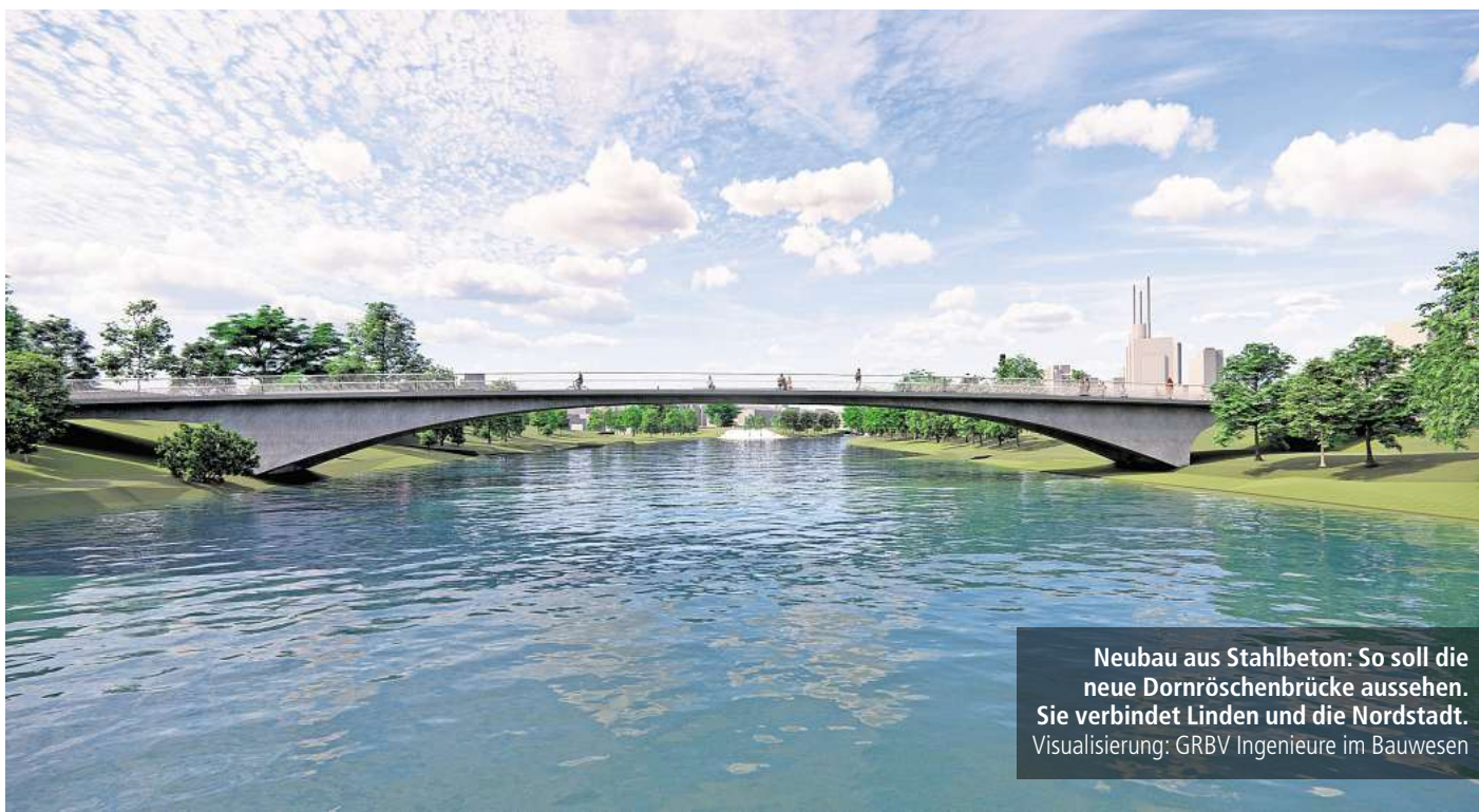
Neubau aus Stahlbeton: So soll die neue Dornröschenbrücke aussehen. Sie verbindet Linden und die Nordstadt. Visualisierung: GRBV Ingenieure im Bauwesen