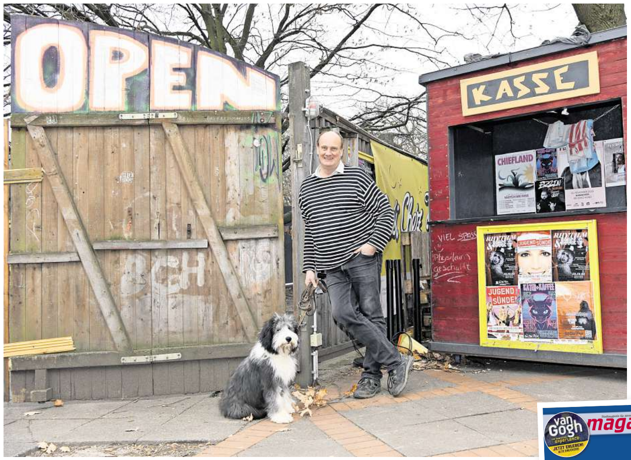
„Unser Programm hat sich immer gewandelt und geht mit der Zeit.“

magaScene: Kommen wir zum Umzug ins Musiktheater BAD. Ihr dürft sicher bis Ende 2026 in den alten Räumen bleiben. Vielleicht sogar auch noch ein halbes Jahr länger. 2027 soll, wenn alles gut läuft, im BAD eröffnet werden. Wie sieht das ideale Béi Chéz Heinz in den Räumen des Musiktheaters BAD für Dich aus? Grambeck: Ideal wäre, dass wir das komplette Gebäude durchsanieren und wir dort drei Indoor-Areas haben. Ähnlich wie hier eben. Eine für rund 400 Leute und zwei kleinere für um die 40 oder 50 Leute. Die genauen Kapazitäten müssen wir aber noch prüfen. Wenn ich sanieren sage, meine ich auch den Keller, das Erdgeschoss und auch, dass oben der Dachstuhl komplett ausgebaut ist. Den brauchen wir, um all unseren Mitarbeitenden gute Arbeitsbedingungen zu bieten. Dazu gehört auch, dass das Haus komplett barrierefrei wird. Zumindest erstmal das Erdgeschoss und das Souterrain. Ein absolutes Highlight