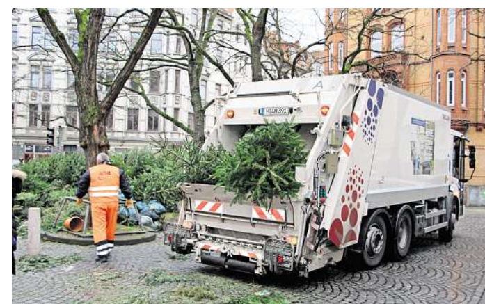
Die Abfallwirtschaft bietet auch 2026 wieder über 200 Sammelplätze im Stadtgebiet. Rund 170.000 Weihnachtsbäume werden eingesammelt.

Gut zu wissen: Große Bäume müssen gekürzt werden, damit sie in die Müllfahrzeuge passen. Eine Länge von 1,50 Meter darf