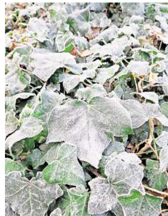
Efeu produziert wie viele andere Pflanzen sein eigenes Frostschutzmittel mit Hilfe von eingelagertem Zucker. Dieses setzt den Gefrierpunkt herab und sichert im Winter das Überleben der Pflanze.

sonders schnell und vor vielen anderen Pflanzen austreiben. „Es gibt übrigens auch wintergrüne Stauden“, so Henze: „Sie wachsen zumeist sehr kompakt, das Laub ist sehr dicht, was die innenliegenden Blätter und Knospen vor dem Frost von außen schützt. Schöne wintergrüne Polsterstauden sind zum Beispiel der Rosa Günsel oder das Farn-Fiederpolster. Mit ihnen lassen sich während der