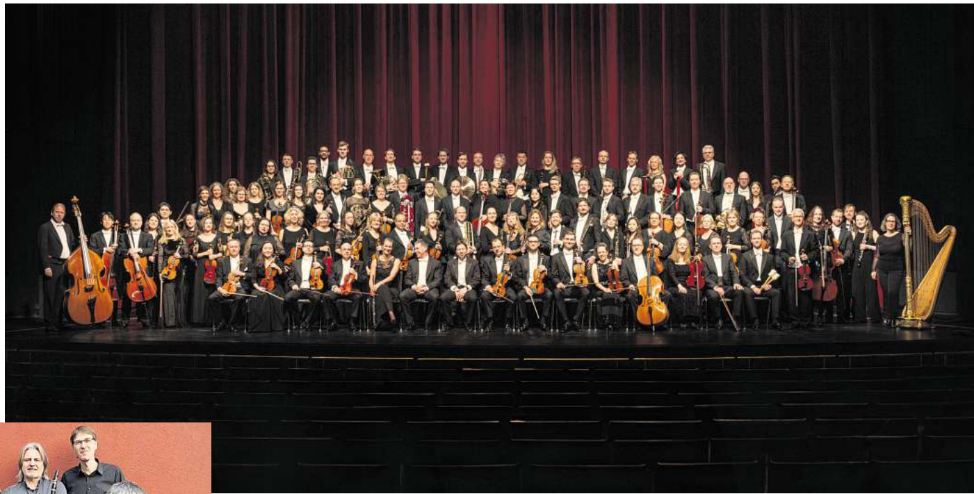
Das Niedersächsische Staatsorchester Hannover spielt gleich zwei Neujahrskonzerte am 1. Januar 2026: ab 12 Uhr und ab 19.30 Uhr.

Wer den Jahreswechsel tanzend feiern möchte, ist am 31. Dezember ab 21 Uhr im Kulturzentrum Pavillon, Lister Meile 4, richtig. Carsten „Erobique“ Meyer verwandelt die Bühne in eine vibrierende Disco-Oase voller Improvisation, Funk und Humor. Zwischen Disco-Zitaten