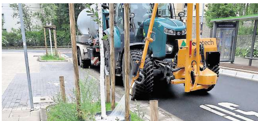
Einer der acht Bewässerungstraktoren der Stadt im Einsatz.

HANNOVER. Rund 50.000 Straßenbäume und bis zu 170.000 Bäume in Grünanlagen stehen im Stadtgebiet von Hannover. Der Bestand wächst seit zehn Jahren stetig, in den vergangenen zwei Jahren sind um die 2000 Bäume hinzugekommen. Was zunächst gut klingt, ist jedoch beim Blick auf den Zustand der Bäume bedenklich: Vielen von ihnen geht es schlecht. Der jetzt vorgestellte Jahresbericht der Stadt für 2023/2024 zeigt, wie klimatische und städtebauliche Herausforderungen vor allem für die wichtigen Altbäume zum Problem werden. Aktuellere Zahlen liegen nicht vor.