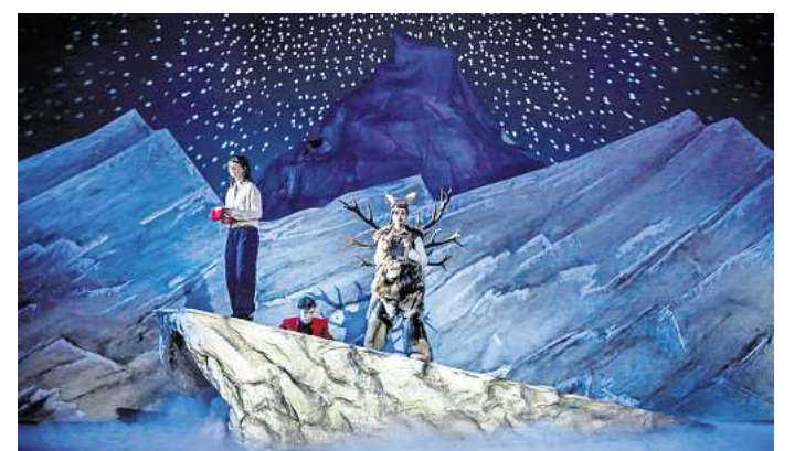
Wintermärchen: Das Schauspielhaus zeigt „Die Schneekönigin“.

► Weitere Termine und Tickets: staatstheater-hannover.de