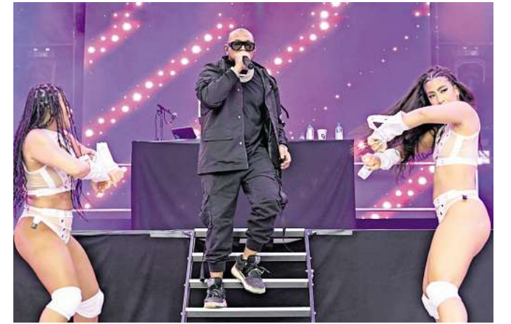
Auch dabei: Dancehall-Star Sean Paul.

All das gilt auch für das NDR 2 Plaza Festival am Vortag, dem 29. Mai. Dafür sind bereits seit Ende Oktober die beteiligten Künstler und Bands bekannt: Peter Maffay, Roxette, The Boss Hoss, Blue und ClockClock.