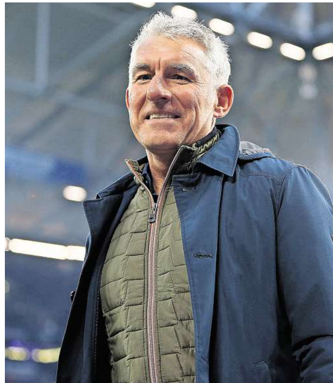
Mirko Slomka ist zu Gast beim Fußballtalk der Neuen Presse am 17. Dezember in der Alten Druckerei.

Die Saison schreitet voran, es geht direkt auf das Weihnachtsfinale zu. Die Zweitliga-Tabelle bleibt eng und Hannover 96 mischt weiter ganz oben mit. Auch wenn nicht immer alles perfekt läuft, präsentiert sich das Team stabil. Einer, der genau weiß, wie sich solche Drucksituationen anfühlen, ist Mirko Slomka. Für die Fans ist er untrennbar mit den erfolgreichsten Jahren von Hannover 96. Beim NP-Anstoß am 17. Dezember wird die Trainerlegende zurück auf alte Zeiten blicken. Vor allem aber geht es um die Perspektive der Zukunft. Und da traut Slomka den Roten schon in dieser Saison Großes zu. Slomka kommt nicht nur, um in Erinnerungen zu schwelgen. Er ist ein präziser Beobachter des heutigen Fußballs, kennt die Strukturen bei 96 immer noch gut und kann einschätzen, wie weit die aktuelle Mannschaft unter Trainer Christian Tietz wirklich ist.