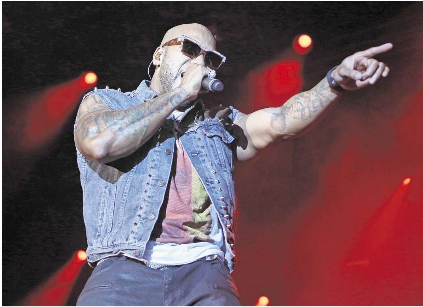
Rapper Flo Rida kommt zum N-Joy Plaza Festival 2026.