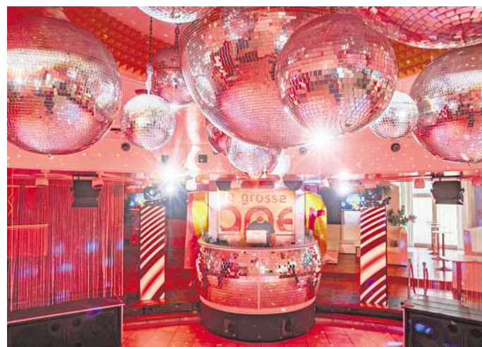
Schöne Glitzerwelt: In der Osho Baggi geht's am 19. Dezember auf Zeitreise in die Achtziger- und Neunziger.

HANNOVER. Es fühlt sich ein bisschen wie ein Nach-Hause-Kommen an: „We are forever young“ – Wir sind für immer jung – ist die Party, die alle Ü-40ziger mit auf eine Zeitreise nimmt. Und wo geht das besser als in der Kultdisco Osho Baggi? Am Freitag, 19. Dezember, geht es zurück in die Achtziger und Neunziger. DJ Giorgio und Kanzler-DJ Michael Gürth stehen am Mischpult und spielen die legendären Hits aus dieser Zeit. Kein neumodisches Zeug. Oldschool. Ein besonderer Abend, der alte Erinnerungen weckt. „Für mich ist das ein ganz besonderes Fest. Ich bin selbst in diesen Disco-Zeiten groß gewor-