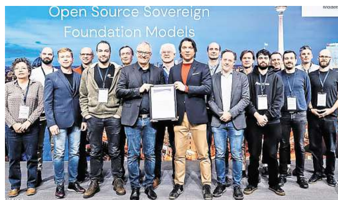
Europa will in Sachen Künstlicher Intelligenz unabhängig werden von US-Unternehmen wie OpenAI (ChatGPT) und Google. Dazu ist nun „SOOFI“ gestartet, ein Millionenprojekt des Bundes. Mit dabei: die Leibniz Universität Hannover.