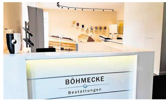
In den Räumlichkeiten an der Günther-Wagner-Allee ist auch eine Auswahl an Särgen und Urnen zu sehen.

„Wir haben schon mit vielen Besuchern gerechnet“, sagt Ohle. Aber der große Andrang sei dann doch überraschend. Niemand der Mitarbeitenden könne sich auch nur eine kurze Pause gönnen. Das liege nicht allein an der „Maxton-Hall“-Begeisterung, sondern auch am sonnigen Wetter. Heute und Morgen und dem kommenden Wochenende hat Schloss Marienburg wieder geöffnet, jeweils sonneabends und sonntags von 10 bis 16 Uhr. Allerdings unter Vorbehalt, es komme auch darauf an, wie das Wetter sei, sagt Ohle. Bei Dauerregen fürchtet er, dass die alten Böden unter den dann möglicherweise nicht so sauberen Schuhen der Besucher leiden könnten.