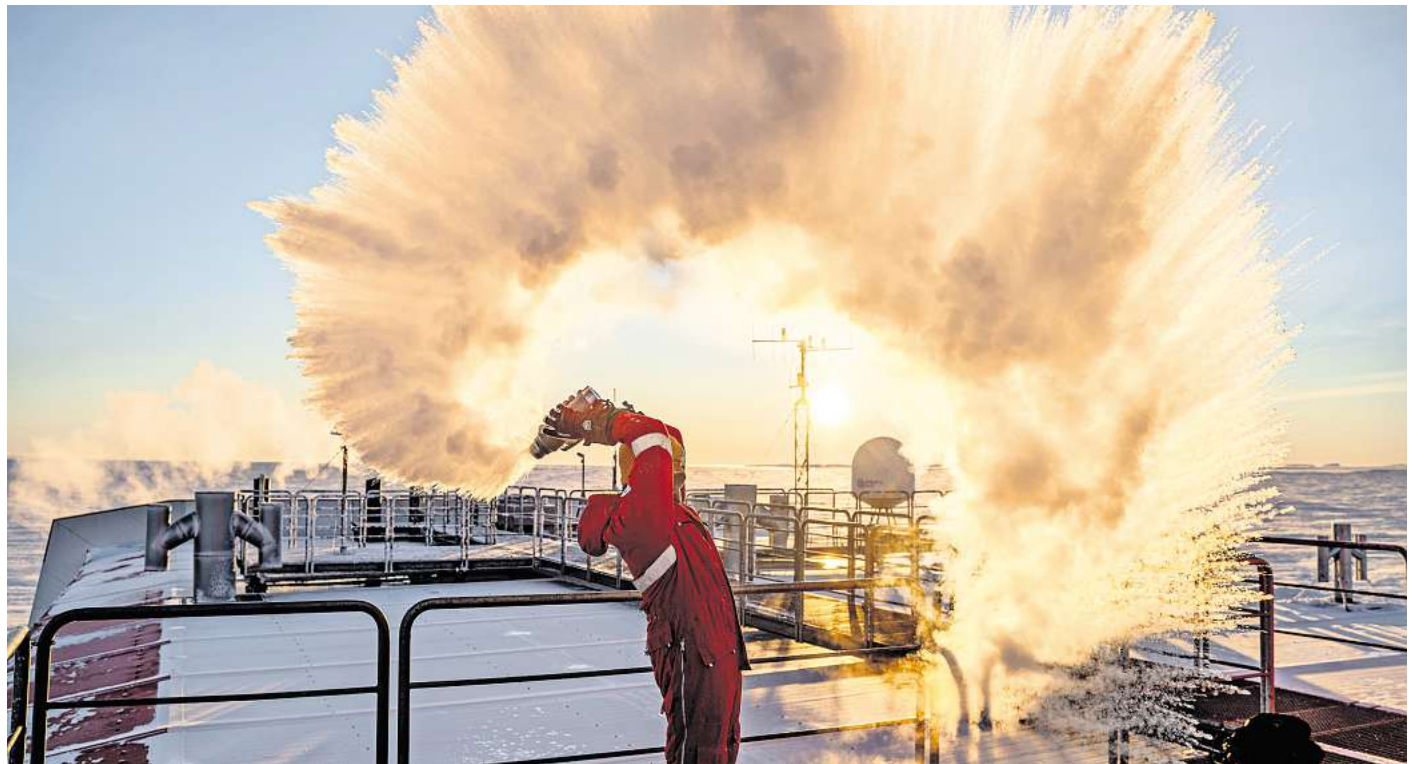
Schnee, selbst gemacht: Ein Kollege von Michael Trautmann leert in der Antarktis eine Kanne mit heißem Wasser in einem Schwung. Es gefriert sofort.

Derzeit arbeitet man an der Station mit Dieselmotoren, die als Blockheizkraftwerke laufen. Das sind bewährte LKW-Motore, die 24 Stunden am Tag mit Polardiesel laufen. Das ist ein spezieller Kraftstoff, der bei extremer Kälte nicht ausflockt. Wichtig ist es, auf simple und bewährte Technik zu setzen. Natürlich entstehen dabei Abgase, aber da die nächste Station 400 Kilometer entfernt ist, kann man deren Einfluss vernachlässigen. Es gibt auch ein Windrad, mit dem Strom erzeugt wird. Der Plan ist, den Anteil der Windkraft noch weiter auszubauen.