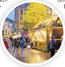
Weihnachtsmarkt an der Marktkirche.

Gleich nebenan steht ein Zirkuswagen, in dem eine Märchenzählerin Geschichten vorliest. Das geschieht täglich um 15.30 Uhr und um 16.30 Uhr und kostet nichts. Umsonst ist auch das Kasperlentheater vor dem Irish Pub. Täglich um 16, 17 und 18 Uhr können Kinder ein Abenteuer mit Kasper und seinen Freunden erleben. Wie man Weihnachtsgeschenke bastelt, erfahren Kinder am 30. November, 7. Dezember, 14. De-