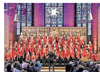
Der Mädchenchor Hannover gibt Adventskonzerte in der Marktkirche.

➤ Der Knabenchor Hannover und London Brass geben ihre traditionellen Adventskonzerte am 4., 5. und 6. Dezember, jeweils ab 20 Uhr in der Marktkirche, Hanns-Lilje-Platz 2. Am 7. Dezember beginnt am gleichen Ort das Familienkonzert um 15.30 Uhr. Tickets (ab 17,50 Euro) über knabenchor-hannover.de . R/H/R