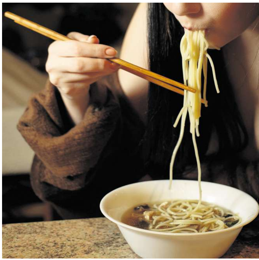
Bewusstes, langsames Essen ohne Ablenkungen: Das Sättigungsgefühl entsteht durch ein Zusammenspiel verschiedener Organe und Hormone.

„Hara hachi bu“ steht genau für eine gegensätzliche Ernährungsweise: „Wenn wir uns bewusst mit unserer Ernährung auseinandersetzen und uns Zeit nehmen, um zu schmecken, zu genießen und das Essen wirklich zu erleben, wie es ‚Hara hachi bu‘ betont, können wir wieder eine Verbindung zu unserem Körper herstellen, die Verdauung unterstützen und uns für nahrhaftere Lebensmittel entscheiden“, sagte Pigott. Die Studienlage zur Wirksamkeit von