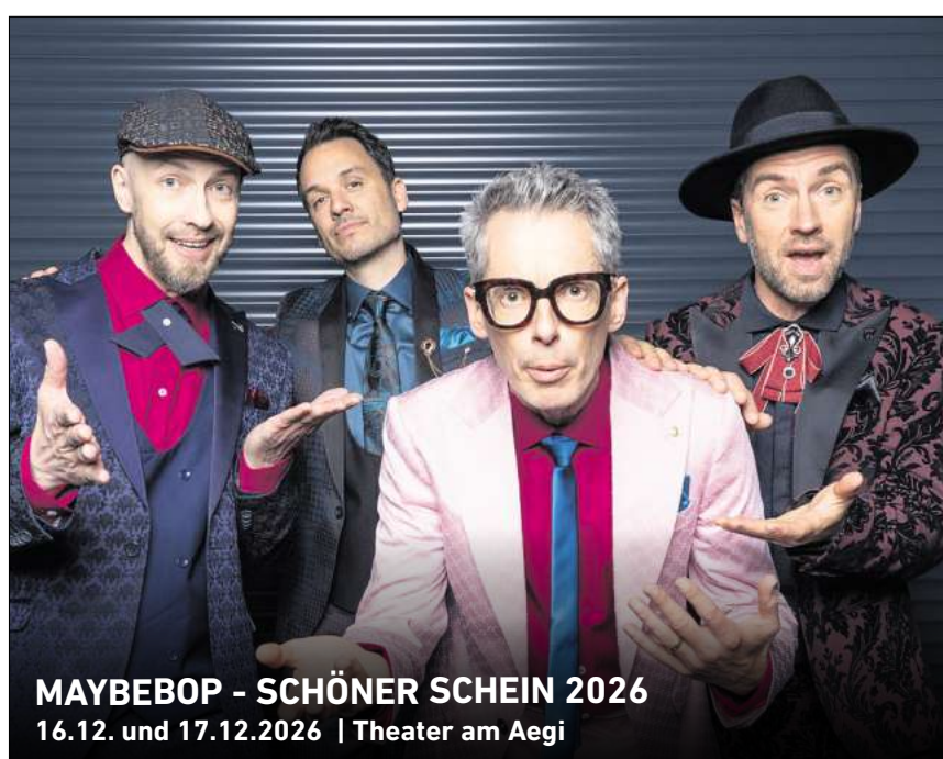
MAYBEBOP - SCHÖNER SCHEIN 2026 16.12. und 17.12.2026 | Theater am Aegi

Ihr persönlicher Ticketservice der HAZ & NP