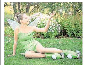
Der ERC präsentiert mit „Die kleine Tinkerfee“ ein Märchen auf Rollen.

HANNOVER. Am ersten Adventswochenende lädt der Eis- und Rollsport-Club Hannover (ERC) zum Rollkunstmärchen „Die kleine Tinkerfee“ ein. Mehr als 50 Läuferinnen und Läufer in liebevoll gestalteten Kostümen erwecken die fantasievolle Geschichte auf Rollschuhen zum Leben. Aufführungen sind am Sonnabend, 29. November, ab 14 und ab 17 Uhr und Sonntag, 30. November, ab 13 und ab 16 Uhr in der Sporthalle der IGS Bothfeld am Hintzefoh. Eintritt: 10 Euro, ermäßigt 6 Euro. Vorverkauf über erc-hannover.de , Restkarten gibt es an der Tageskasse. R/H/R