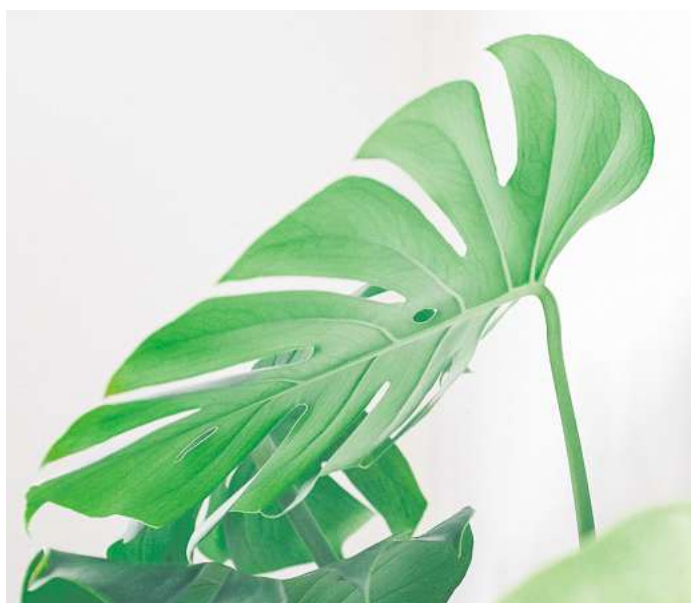
Klassiker im Bad: die Monstera.

Ebenfalls für eher dunkle Badezimmer, hohe Luftfeuchtigkeit und wenig Licht geeignet: die Calathea (Korbmaranten), die es mit Flammemuster auf den Blättern oder etwa mit Streifen gibt. Auch Calathea sind laut Plants & Flowers Foundation nicht sehr widerstandsfähig gegen Zugluft und Kälte. Direkt vor das Fenster sollte man sie also besser nicht stellen. Gegossen werden die Pflanzen am besten mit lauwarmem Wasser, das