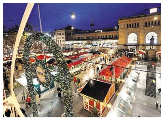
Tolles Ambiente: Der Weihnachtsmarkt am Bahnhof ist bis zum 30. Dezember geöffnet.

in, ehe sie nach Kriegsende nach Celle geflüchtet ist.“ Sein Opa stammt aus einer Schausteller-Familie, gemeinsam legten die