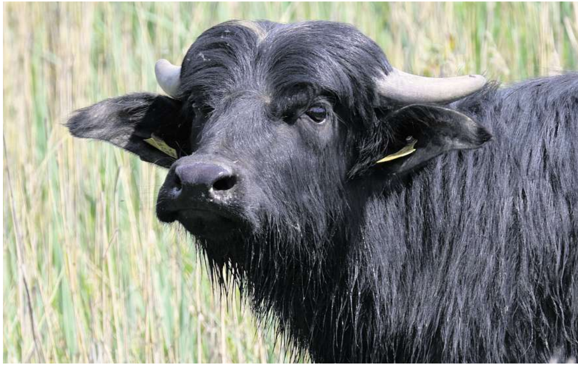
Imposante Tiere: Ein Wasserbüffel steht in einem Teich auf einer Feuchtwiese im Landschaftspark Rudow-Altglienicke bei Schönefeld. Wasserbüffel sollen jetzt auch in Hannover die Landschaft pflegen.

Weil sumpfiges Gelände den Tieren keine Probleme bereitet,