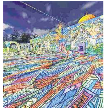
Christmas Garden Hannover