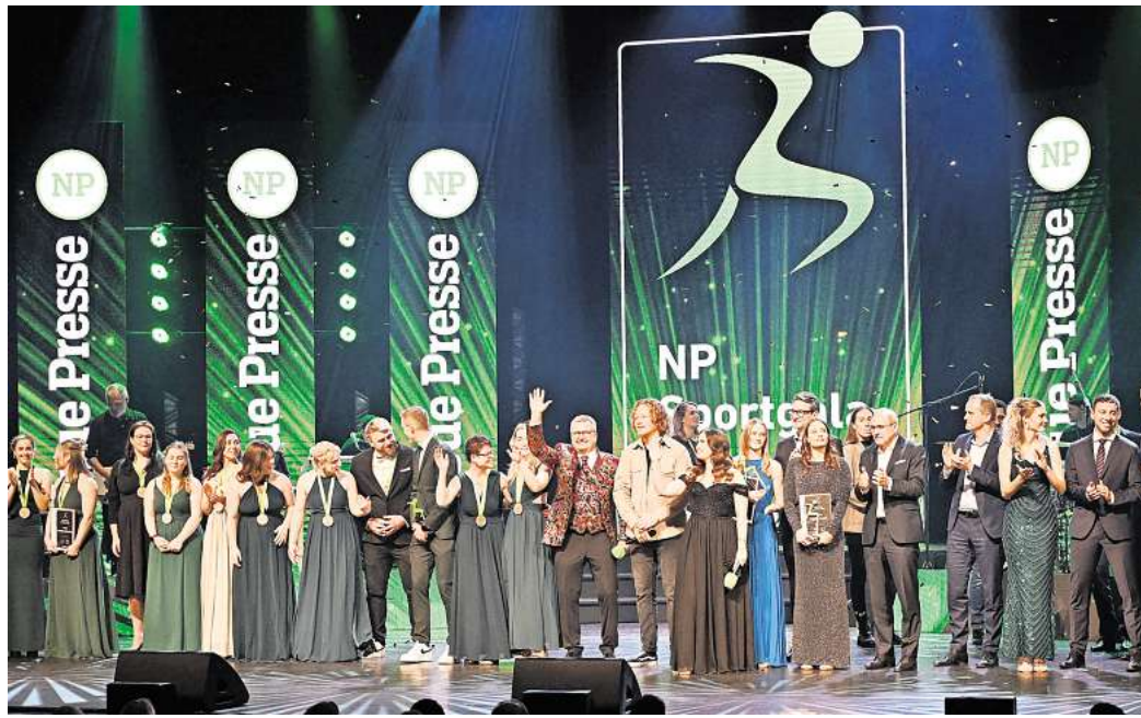
Abschluss der NP-Sportgala in diesem Jahr.