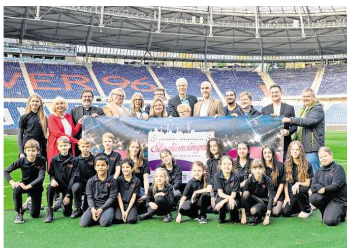
Die Veranstalter, der Kinderchor der Staatsoper sowie die Sponsoren und Unterstützer des Stadionsingens 2025 in der Heinz von Heiden Arena.