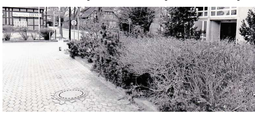
Tatort Hänigsen: Im Januar 1992 wurde hier eine 19-jährige Abiturientin nach dem Feuerwehrball vergewaltigt und erwürgt aufgefunden. In der Hecke wurde ihre Leiche gefunden.

Es war ein besonderer Abend für Hänigsen, doch der Morgen danach begann für den kleinen Ort bei Burgdorf mit einer schockierenden Nachricht. Nur wenige Meter von der Gaststätte „Zum Sachsenross“, wo noch Stunden zuvor etwa 250 Menschen den Feuerwehrball gefeiert hatten, wurde am Morgen des 19. Januar 1992 der leblose Körper einer 19-jährigen Abiturientin gefunden. Die Polizei wurde alarmiert, eilte zum Tatort, sperrte alles ab, sicherte Spuren. Schnell stand fest: Die junge Frau, die noch ihr Ballkleid trug und die so viele im Ort gemocht und geschätzt haben sollen, wurde überfallen, überwältigt, vergewaltigt und erwürgt. Doch wer konnte das getan haben? Der 6000-Seelen-Ort war geschockt – und das Misstrauen ging plötzlich um in Hänigsen und unter den Besuchern des Feuerwehrballs.