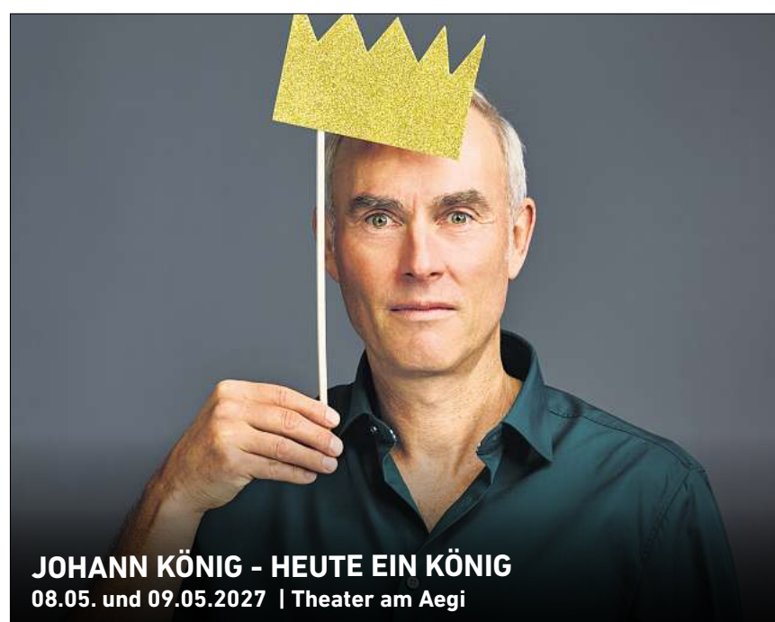
JOHANN KÖNIG - HEUTE EIN KÖNIG 08.05. und 09.05.2027 | Theater am Aegi

Ihr persönlicher Ticketservice der HAZ & NP