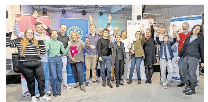
Gute Stimmung: Bei der Charity-Boutique kamen rund 12.000 Euro für den guten Zweck zusammen.

Mit großem Engagement und Herzblut trugen die Rotarierinnen und Rotarier dazu bei, Gutes zu tun und gleichzeitig ein besonderes Event für die Gemeinschaft zu schaffen.