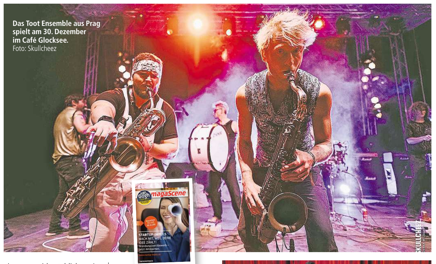
Das Toot Ensemble aus Prag spielt am 30. Dezember im Café Glocksee.

Zum krönenden Abschluss des Festivals tritt dann endlich Königliche Braut auf. In strammem Blau, mit Promille und Hackfahne, rempelt sich Königliche Braut per Bleifuß dauerhypend durch den Melodien-Traffic, um die Liebe zu preisen. Das klingt doch nach