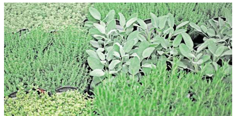
Kraftvolle Kräuter für die Gartenapotheke: Aus Thymian, Rosmarin und Salbei lassen sich natürliche Hausmittel zubereiten, die bei Erkältungen helfen.

Der süß-scharfe Hustensaft hält sich im Kühlschrank zwei bis drei Tage und kann bei Bedarf neu angesetzt werden. Vorsicht: