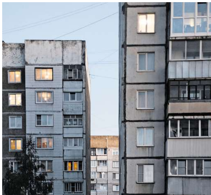
Zwischen Leerstand und Überbelegung: verwahrloste Häuser.