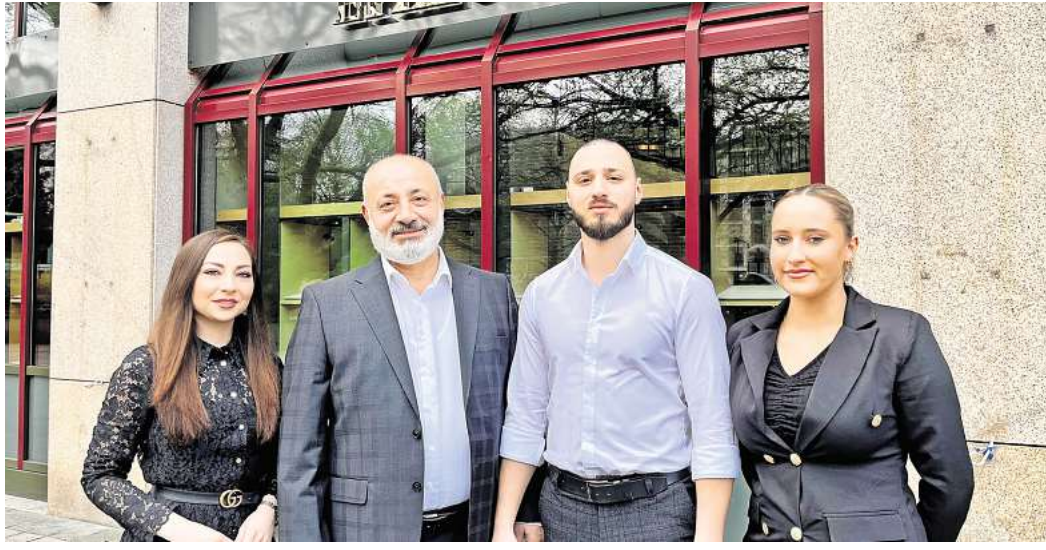
Das Team der Gold- und Silberschmiede Ephesus entwirft und fertigt Schmuckstücke nach den Vorstellungen der Kunden – seit 30 Jahren.

Die GOLD- UND SILBERSCHMIEDE EPHEBUS feiert zwei Wochen lang mit attraktiven Geburtstagspreisen