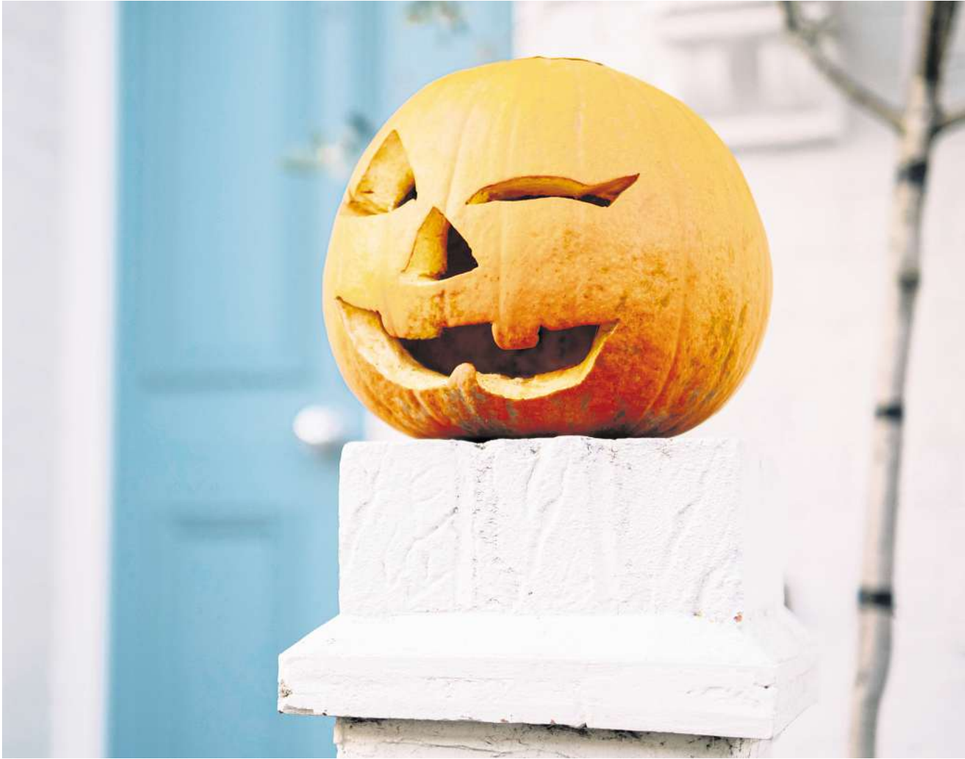
MIT EIN PAAR TIPPS KANN MAN IHRE LEBENSDAUER VERLÄNGERN: Geschnitzte Kürbisse sind eine beliebte Dekoration im Herbst und zu Halloween.

sich so problemlos acht bis 12 Wochen, je nach Sorte sogar bis zu einem Jahr. Anders verhält es sich mit geschnitzten Halloween-Kürbissen. Kürbis-Fratzen bleiben fünf bis zehn Tage frisch, legen Sie also nicht zu früh los.