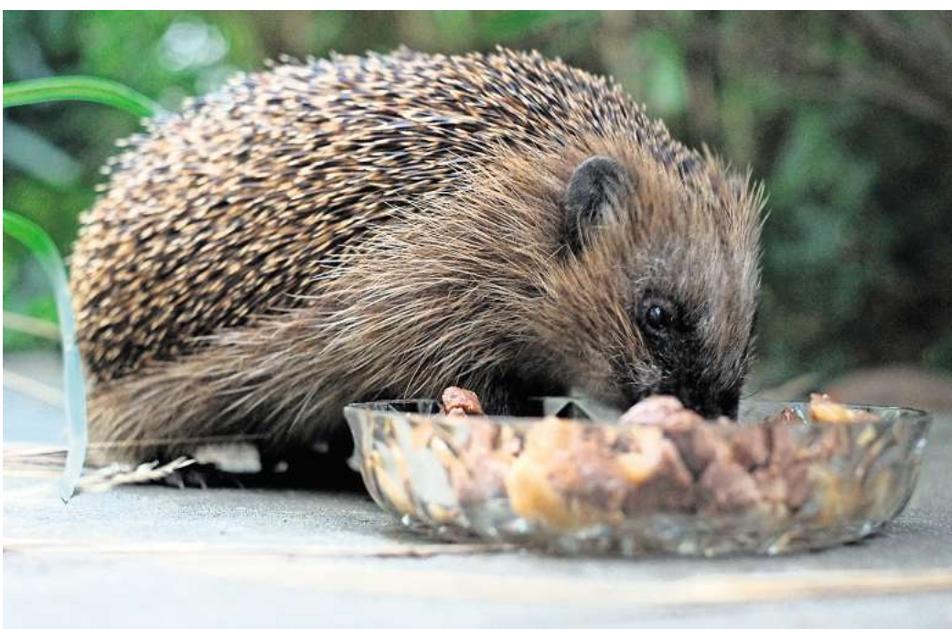
Ein Igel Frisst sich ein Winterpolster an: Katzenfutter serviert man am besten in einer flachen Schale.