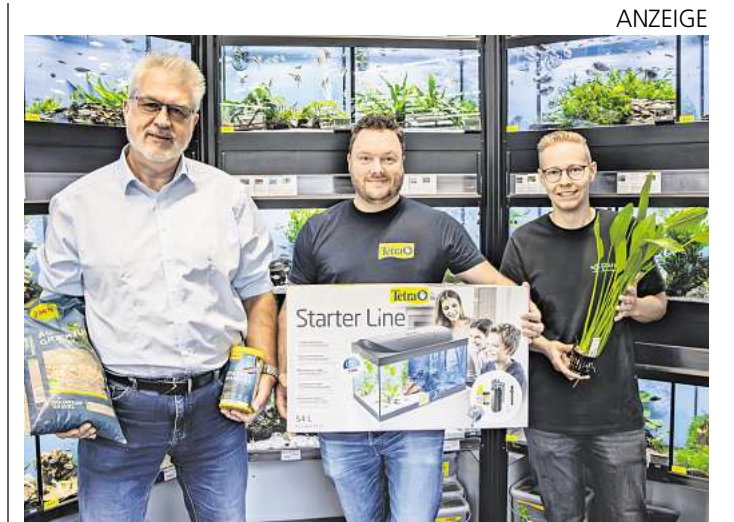
Das Naturdeko-Sortiment hat das Stanze-Team gerade erst deutlich erweitert. Zudem wird mit einer großen Zierfisch- und Wasserpflanzenauswahl gepunktet.