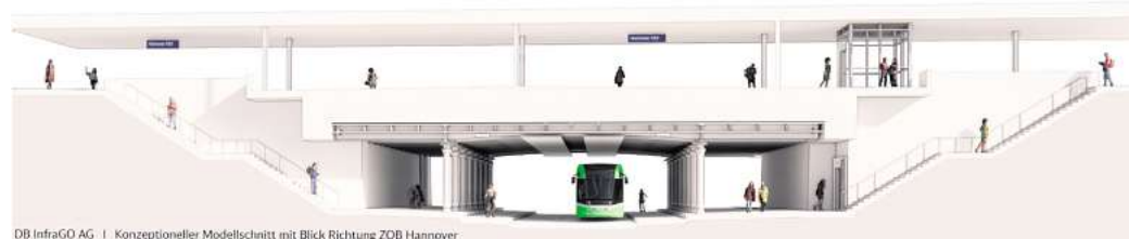
DB InfraGO AG | Konzeptioneller Modellchnitt mit Blick Richtung ZOB Hannover

Und wem ist zu verdanken? Nach Darstellung von Bund und Bahn ist die jetzt gefundene Lösung ganz unspektakulär das Ergebnis der Abwägung vorgeplanter Varianten nach Kriterien,