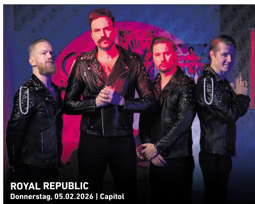
ROYAL REPUBLIC Donnerstag, 05.02.2026 | Capitol

➤ Informationen und Tickets: feuerwerk-hannover.de