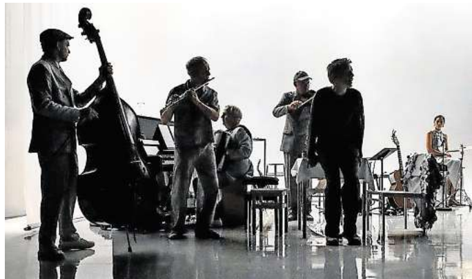
Das Schauspiel Hannover zeigt „Mit anderen Augen“.

➤ Weitere Termine und Vorverkauf: staats-theater-hannover.de