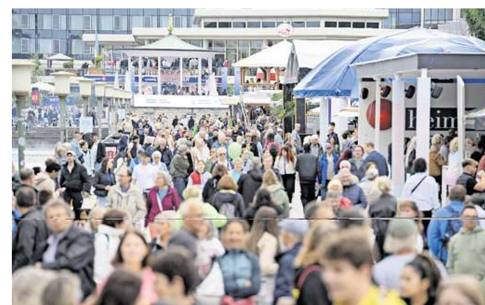
Überschneidung in 2026: Das Maschseefest (Foto oben) und die Finals laufen zeitgleich in Hannover.

Bei der Ausrichtung des Kirchentages im Frühjahr 2025 und bei der großen Feier zum Tag der Deutschen Einheit im Jahr 2014 habe Hannover bereits bewiesen, dass Großveranstaltungen in der Stadt gut funktionieren. „Das ist geübt, das werden wir wieder hinbekommen“, ist sich der Oberbürgermeister sicher. Auf dem Maschsee sind aktuell Kanupolo, Kanusprint und Rudern geplant. Weitere Finals-Wettkämpfe sollen in unmittelbarer Nähe ausgetragen werden. Rund um das Neue Rathaus etwa soll es 3x3-Basketball, Breakdance und BMX-Wettkämpfe geben. Im ebenfalls nur wenige Fußminuten vom