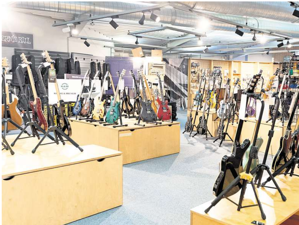
Schöne Dinge: Die Gitarrenauswahl im PPC ist auch was fürs Auge.

Aber die Gitarrenstreichler wollen gar nicht richtig spielen. Sie schlurften mit Händen in den Taschen durch den Laden und lassen sich jedes Mal aufs Neue von der bunten Pracht der sorgsam aufgehängten oder aufgestellten Gitarrenarmee mit Wonne erschlagen. Hier und da bleiben sie stehen und tätscheln den lackierten Korpus einer Gibson