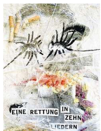
Zehn Lieder, eine Hommage an Hildegard Knef.