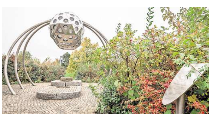
Das wohl bekannteste Kunstobjekt im Park der Sinne ist das Insektenauge. Für die Entwicklung benötigte Rimkus mehr als ein Jahr. Alle Teile sind gelasert, die Oberfläche ist elektroplottiert. Die Linsen sind eine Spezialanfertigung.

3. Action im Erse-Park Action und riesige Dinosaurierfiguren warten im Erse-Park in Uetze. Hier können sich Kinder auf einer Wasserbahn, einer