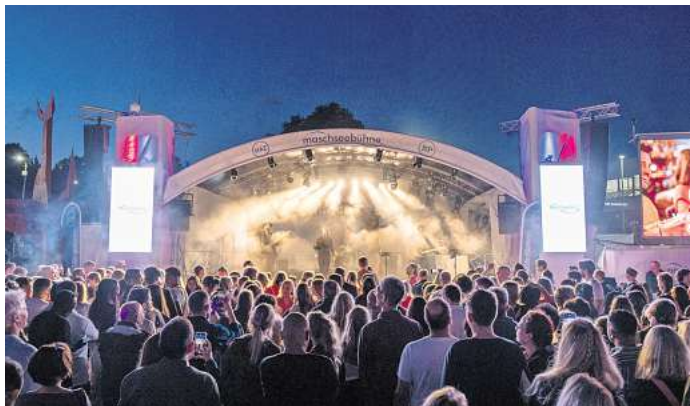
Die Maschseebühne beim Maschseefest

Popszene dem Publikum präsentieren. Mit dabei sind unter anderem Hertzcasper, Emilie Sandin, Taper und VIAN. Auf der Maschseefest-Bühne treten aber auch noch andere Stars auf, wie etwa Deutschpop-Sänger Myller am 1. August. Einen Tag später ist Coverband Munique wieder da, mit ihrem Mix aus verschiedenen Musikgenres. Am 8. August schließlich bespielt Radio Bollerwagen aus dem Hause ffn die Bühne, das Motto heißt: X-Treme Party Music. Am letzten Maschseefest-Wochenende übernimmt Radio 21 das Programm, unter anderem mit der Coverband Reckless Roses aus Budapest, die am 16. August die größten Hits von Guns N'Roses spielen. Auch Hannovers Partyband Jetlags spielt an diesem Tag.