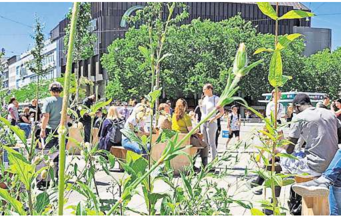
Begrünte Sitzplätze bieten Platz für eine Pause.

HANNOVER. Das Sprengel Museum, Kurt-Schwitters-Platz, setzt sich in der Ausstellung „Stand up! Feministische Avantgarde“ bis zum 28. September mit künstlerischen Positionen von feministischen Pionierinnen der 1970er-Jahre auseinander. Die Arbeiten aus der Wiener Sammlung Verbund – darunter Fotografien, Video-Arbeiten, Objekte und Zeichnungen – widmen sich der Konstruktion von Weiblichkeit. Sie untersuchen, was es bedeutet, eine Frau in den 1970er-Jahren zu sein, und entlarven Stereotype und Klischees. Die Künstlerinnen der Feministischen Avantgarde schufen erstmals in der Geschichte der Kunst radikal, subversiv und ironisch ein völlig neues „Bild der Frau“ aus weiblicher Perspektive. Im Jahr 2025 sind die Themen dieser künstlerischen Frauenbewegung noch immer aktuell. Die Schau, die bereits in Rom, Madrid, London