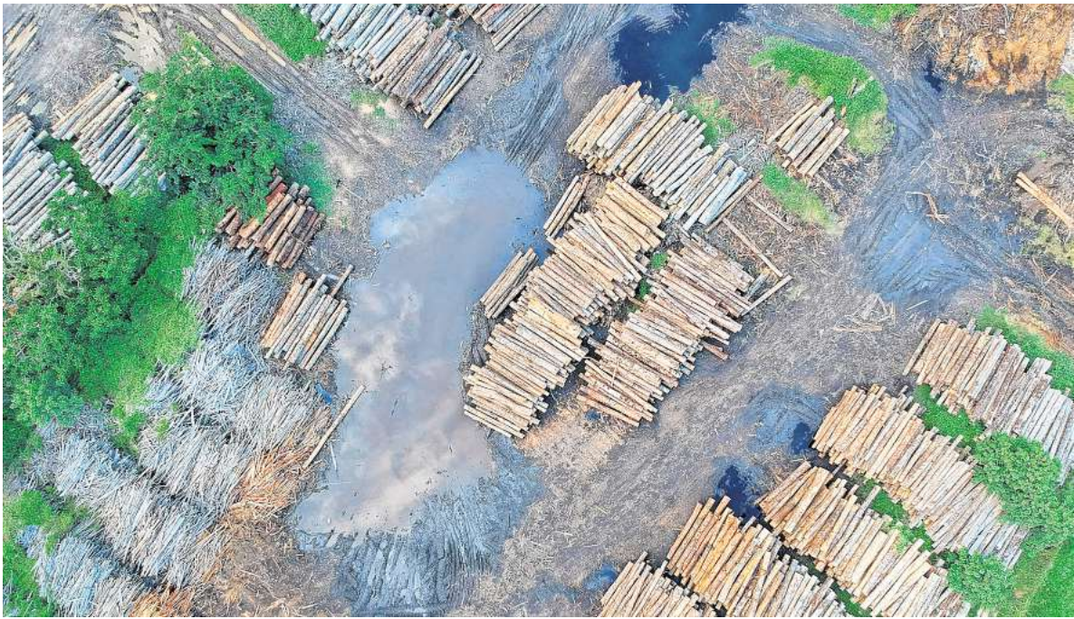
Die Abholzung von Wäldern ist eine der Ursachen für den Ausstoß von CO 2 . Aber auch der Flugverkehr und die Verbrennung fossiler Brennstoffe wie Erdöl oder Erdgas treiben die Emissionen voran.

„Das Zeitfenster, um die 1,5-Grad-Marke zu halten, schließt sich rapide“, sagt Joeri Rogelj, Studienautor und Forschungsdirektor am Grantham Institute des Imperial College London. Im vergangenen Jahr wurde die 1,5-Grad-Marke bereits zum ersten Mal überschritten: Im Vergleich zum vorindustriellen Niveau war die globale Durchschnittstemperatur um 1,52 Grad Celsius gestiegen. Davon seien 1,36 Grad eindeutig