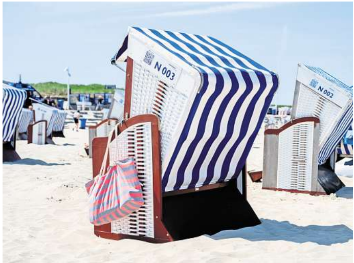
Mit der Bahn bis in den Strandkorb: Ab Hannover rollt der RE1 bis Norddeich/Mole zur Fähre durch.

Das Deutschlandticket soll den bundesweiten Nahverkehr attraktiver und bezahlbarer machen. Gerade während der Sommerferien 2025 dürfte die Monatskarte auch bei einigen Urlaubern wieder das Interesse wecken. Wie passend, dass die DB Regio die 20 beliebtesten Strecken für Freizeitausflüge ausgewertet hat: Vier von ihnen führen durch oder starten in Niedersachsen. Dazu sind sie sehr abwechslungsreich.