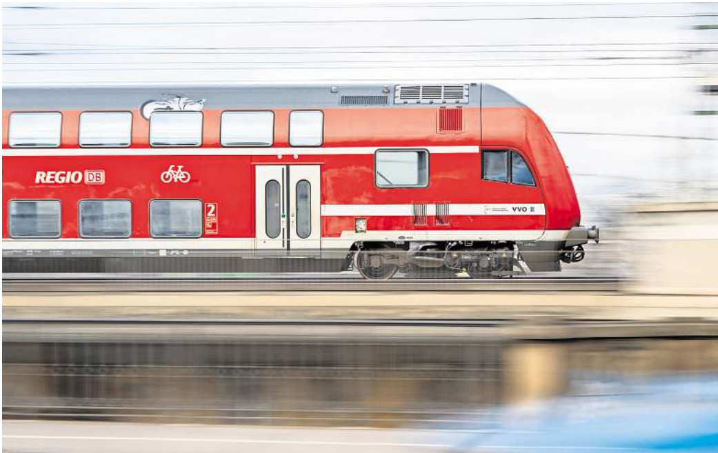
Kurzurlaub mit dem Deutschlandticket: Wer einen Kurztrip mit der Bahn plant, sollte diese vier Strecken kennen.

Den Abschluss bildet die Strecke von Osnabrück via Bremen nach Bremerhaven mit dem RE9. Auf dem Weg dahin stoppt der Regionalexpress unter anderem in Diepholz. Abgesehen von historischen Bauten wartet dort das Technikmuseum. Nur wenige Stopps weiter kommt Twistringen mit seiner Ausgrabungsstätte einer rund 1500-jährigen Hünenburg. In der