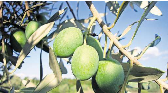
Der Olivenbaum hat seinen Ursprung im Mittelmeerraum.