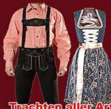
Trachten aller Art