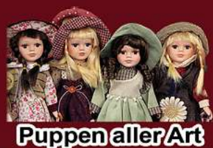
Puppen aller Art