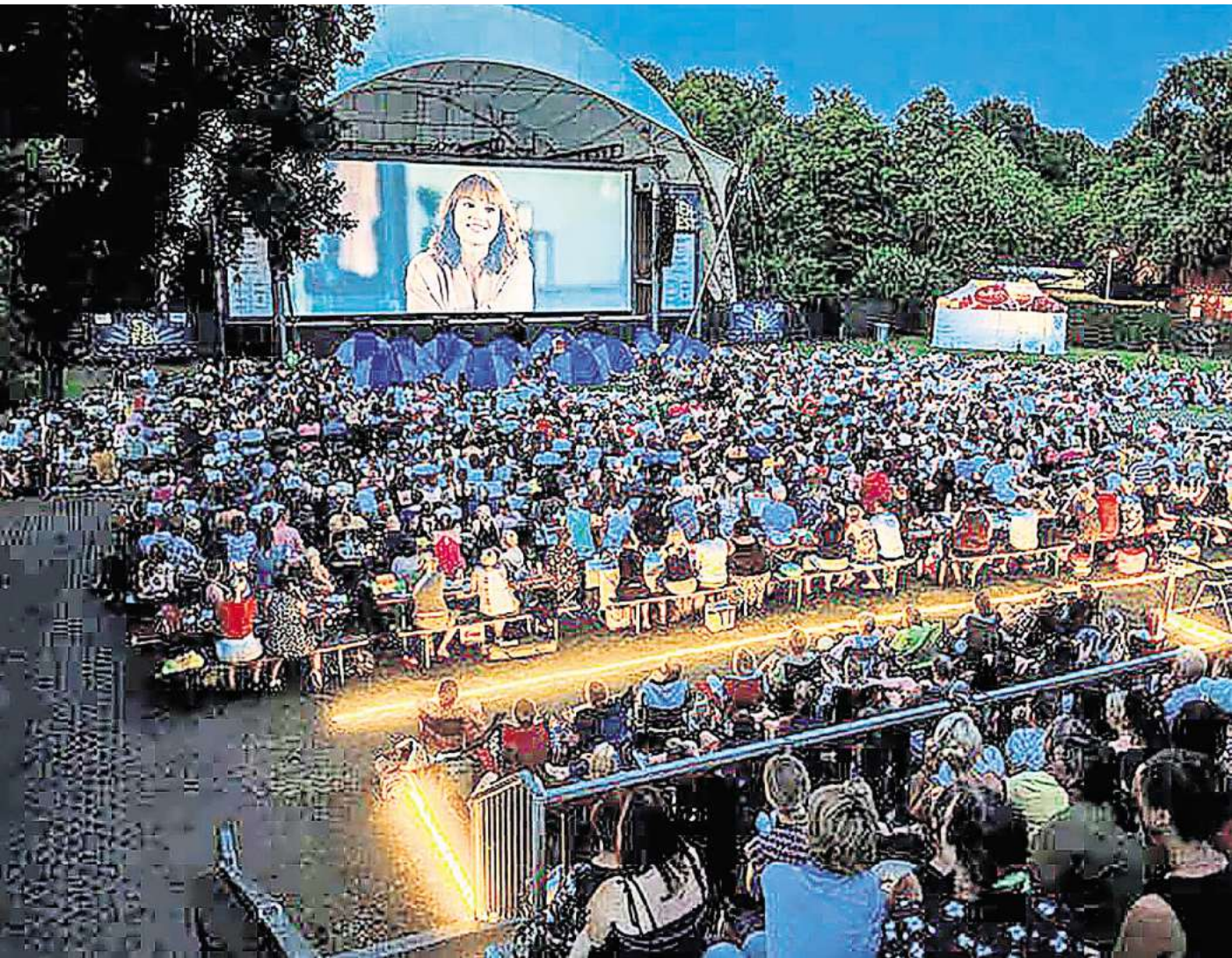
Open-Air-Kino an der Gilde Parkbühne: Das Seh-Fest lockt jährlich rund 30.000 Besucher an.

HANNOVER. Das Sehfest feiert vom 22. Juli bis zum 16. August seinen 20. Geburtstag. Das Open-Air-Kino in Hannover begeistert jährlich rund 30.000 Besucherinnen und Besucher. Auf der Gilde Parkbühne wird an den 23 Veranstaltungstagen jeweils um 20 Uhr ein Film gezeigt. Es wird bei Wind und Wetter gespielt, sonntags ist spielfrei. Anlässlich des runden Geburtstages sind eine 28 Stunden Party und Livemusik geplant. Die Tickets kosten 9 Euro. Der Kartenvorverkauf findet online über Eventim sowie an den bekannten Vorverkaufsstellen statt. Pro Vorstellung werden 1400 Tickets verkauft. Das Programm ist vielfältig, es reicht von dem Vatikan-Thriller „Konklave“ (24. Juli), über „Drachenzähnen leicht gemacht“ (25. Juli) bis hin zu „Wicked“ (15. August). Zur Premiere am 22. Juli und als Teil der 28-Stunden-Party werden drei Überraschungsfilme gezeigt. Die Zuschauer haben mit Schlagworten wie „Komödie“, „Herz“ oder „Musik“ lediglich einen Hinweis auf das zu erwartende Genre. Am 16. August wird die Seh-Fest-Saison mit dem Familienfilm „Lilo & Stich“ geschlossen. Zum runden Jubiläum haben sich die Macher des Freilichtkinos ein neues Veranstaltungskonzept überlegt: Am 8. und am 9. August wird die sogenannte 28-Stunden-Party gefeiert. An beiden Tagen wird jeweils um 20 Uhr ein Überraschungsfilm gezeigt. Anders als gewohnt wird der Projektor danach nicht abgeschaltet. Stattdessen wird auf der Bühne das