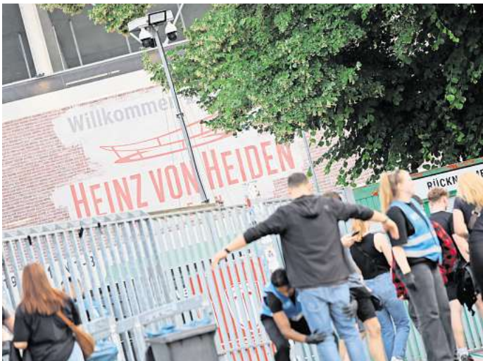
Mehr Sicherheit: Hannover Concerts setzt seit diesem Jahr auf Kameraanlagen – unter anderem bei dem Linkin-Park-Konzert in der Heinz von Heiden Arena.

Die nächste Großveranstaltung mit Überwachung wird das Robbie-Williams-Konzert am 30. Juni. Auch dann gilt: Die Kameras laufen – ob man hinsieht oder nicht. Der Konzertveranstalter Hannover Concerts überwacht seit diesem Jahr Veranstaltungen mit Kameraanlagen. Das soll Straftaten verhindern und aufklären.