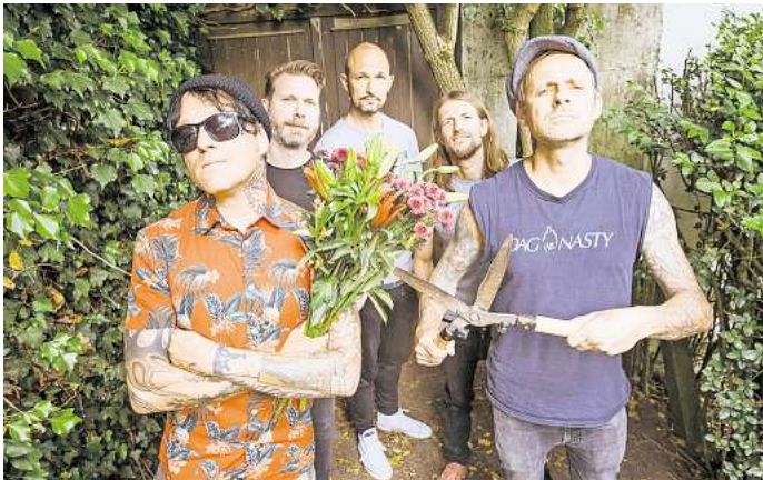
Die Donots rocken am Freitag das Fährmannsfest.