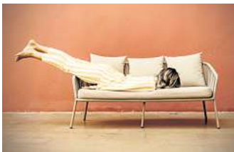
Statt das Wochenende zu genießen, fallen viele Menschen am Sonntagnachmittag in ein Stimmungstief.