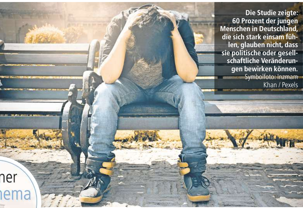
Die Studie zeigte: 60 Prozent der jungen Menschen in Deutschland, die sich stark einsam fühlen, glauben nicht, dass sie politische oder gesellschaftliche Veränderungen bewirken können.