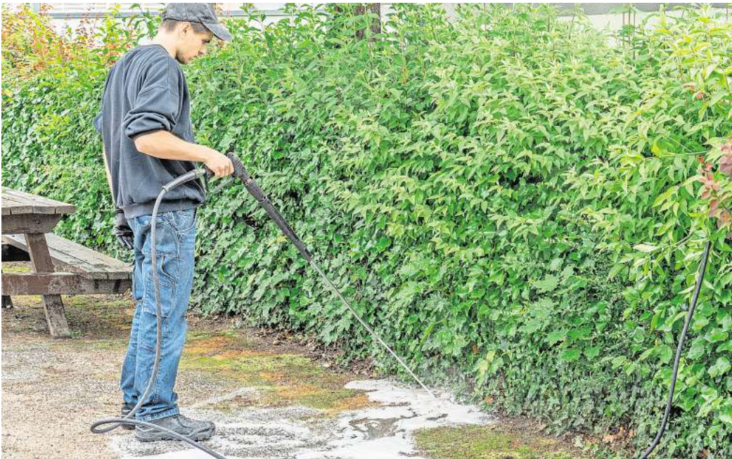
Ein Mann bekämpft mit einem Spritzgerät invasive Ameisen der Art Tapinoma magnum .

Er selbst wolle sich als Nächstes ein bestimmtes Gel gegen die Ameisen kaufen, davon habe er im Internet gelesen. Die Nachbarin schwört hingegen auf Backpulver. An die Heißwasserbekämpfung der Stadt glaubt sie nicht so recht: „Da lachen sich die Ameisen kaputt. Die sollen mal was Ordentliches machen.“ Auf ihr Grundstück lässt sie die Mitarbeitenden des städtischen Betriebshofs trotzdem. Schaden kann es ja nicht. Zumindest nicht mehr als die Ameisen.