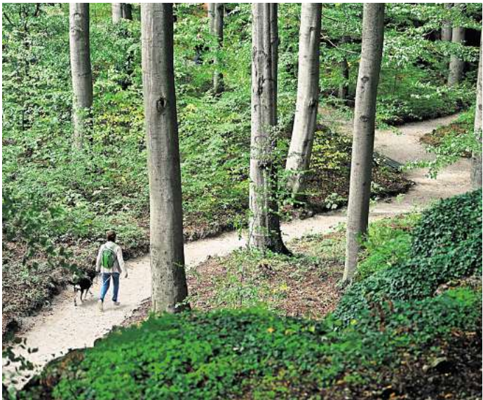
„Der tut nichts“ ist keine gültige Ausrede: Hunde sind im Wald an der Leine zu führen.

► Kleinere Abfälle kann man im Wald auch selbst einsammeln. Handschuhe oder ein Müllgreifer schützen vor Verletzungen. Für die Kombination aus Müllsammeln und sportlicher Betätigung gibt es sogar einen eigenen Begriff: „Plogging“. Der Begriff setzt sich zusammen aus den Worten Jogging und „plocka upp“, was im Schwedischen für Aufheben steht. Auch Waldputztage bieten Gelegenheit, aktiv zu werden. Und: Wer andere freundlich auf ihr Fehlverhalten hinweist, etwa beim achtlosen Wegwerfen von Abfall, setzt ein Zeichen für mehr Umweltbewusstsein.