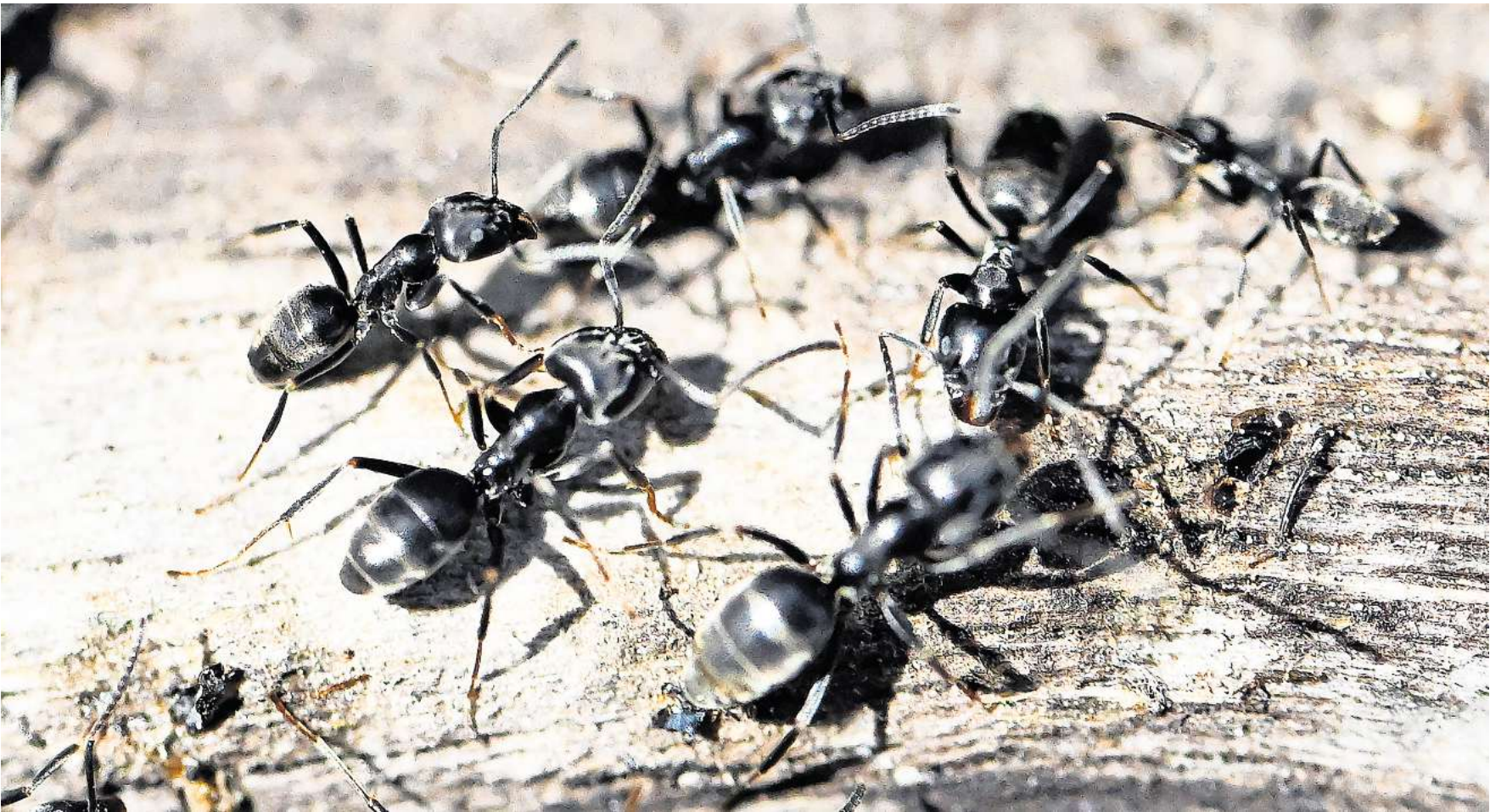
Große Mengen der als invasiv geltenden Ameisenart Tapinoma magnum breiten sich in Deutschland aus.

Höcherl und ihre Kollegen wollen also herausfinden, wie sich die Tapinoma magnum verbreitet und was das für den zukünftigen Umgang mit ihr bedeutet, denn: „Die Ameise ist gekommen, um zu bleiben. Wir werden sie nicht mehr los. Das ist jetzt eher eine Frage des Managements“, sagt Höcherl. Soll heißen: Ja, es ist wahrscheinlich, dass die Große Drüsenameise bald auch in anderen Städten vor der Tür steht – wenn sie nicht schon längst da ist. Um das herauszufinden, sind die Forschenden auf die Mithilfe der Bevölkerung angewiesen. Wer einen Verdacht auf Tapinoma mag-