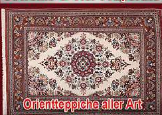
Orientteppiche aller Art