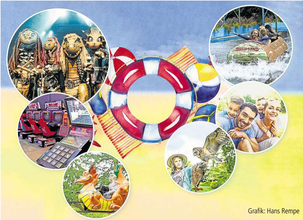
Grafik: Hans Rempe