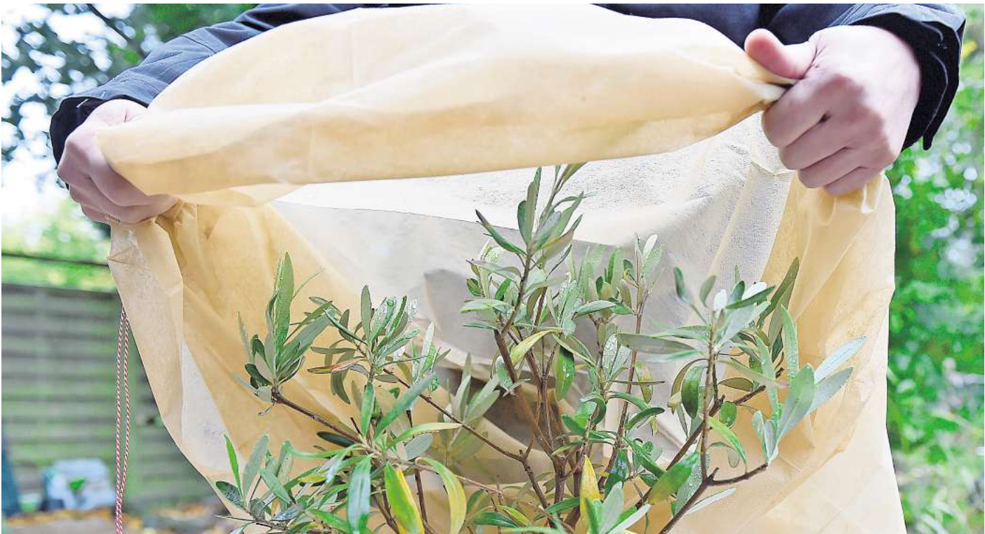
Vor Frost geschützt: Im Winter kann man den Olivenbaum mit Vlies einwickeln.

Direkt im Frühling gibt man einen Dünger, der für mediterrane Pflanzen geeignet ist. Ideal ist ein Präparat mit Langzeitwirkung. So muss man nur noch einmal düngen, und zwar zum Herbst hin. Hierbei spielt vor allem ein erhöhter Anteil an Kalium eine Rolle, wie er in Herbstdüngern vorhanden ist. Diese verbessern die Frosthärte der Oliven.