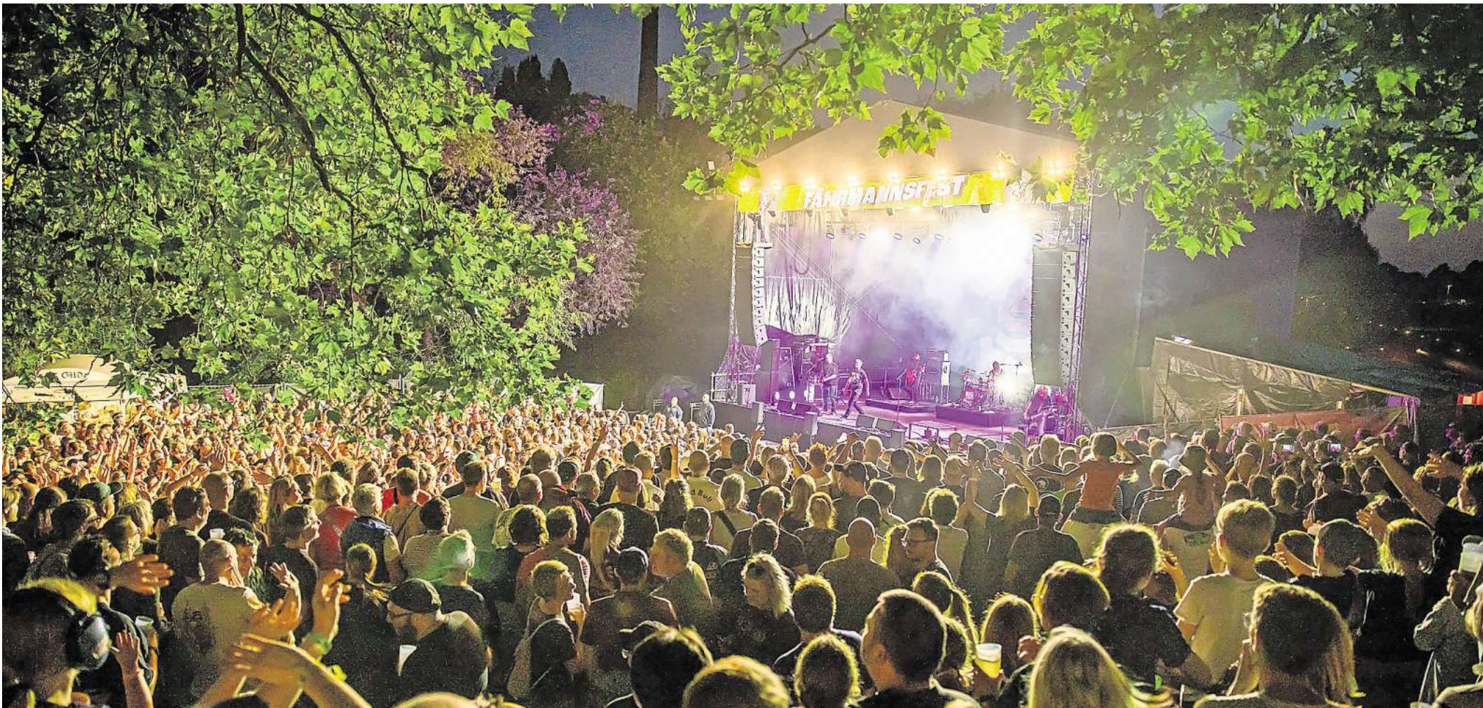
Von Grunge bis Punkrock: Auch 2025 bietet das Fährmannsfest für jeden etwas.