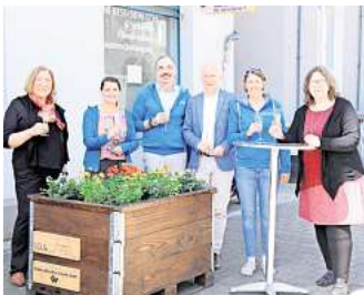
Die erste Pflanzkiste der IDG wurde aufgestellt.

zept der Pflanzkisten wurde als am schnellsten und einfachsten umzusetzen bestimmt. Die Kisten sind mobil auf Europaletten installiert und werden von der Vahrenheider Werkstatt gebaut, die eine Tischlerei und eine Gärtnerei unterhält. Als Aufstellflächen bieten sich gepflasterte Vorgärten privater Hand an, nun sucht die I.D.G. nach weiteren Plätzen für die Pflanzkisten in Döhren, verbunden mit einer Partnerschaft für die Bepflanzung und Bewässerung. Eine Bepflanzung ist individuell möglich und gewünscht, Partner und Sponsoren können mittels Plakette auf der Kiste verewigt werden. Interessierte können unter idg-hannover.de Kontakt aufnehmen. Die I.D.G. hofft, dass die Pflanzkiste von den Döhrenern als eine Art Initiator wahrgenommen wird und daraus weitere Ideen und Initiativen entspringen. RED