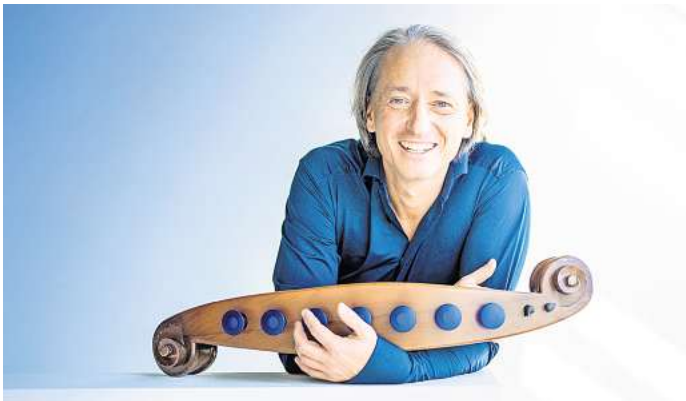
Martin O. kommt mit einem einzigartigen Loopgerät in den Kuppelsaal im HCC.

HANNOVER. Mit seinem 41. Programm „Wir mischen euch auf!“ rührt der Kinderzirkus Giovanni mit einer Show rund um Farben gegen das Schwarz-Weiß-Denken an. Wie eine monochrome Welt aussieht und was wir alles verlieren, wenn wir Eintönigkeit heraufbeschwören, möchten Feuerspucker und Jongleure, Seiltänzer und Schlangenmenschen in zwei (zunehmend) bunten Stunden zeigen. Die nächsten Aufführungen sind am Sonnabend, 10. Mai, und Sonntag, 11. Mai, jeweils ab 11 und ab 15.30 Uhr im Zirkuszelt hinter dem Johanneshof, Hermannhof 10. Der Eintritt kostet 12 Euro, für Kinder 6 Euro.