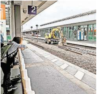
Wegen der Sanierung des Hauptbahnhofs müssen Reisende der S-Bahn Hannover von Montag, 12. Mai, bis Sonntag, 25. Mai, mit Einschränkungen rechnen.