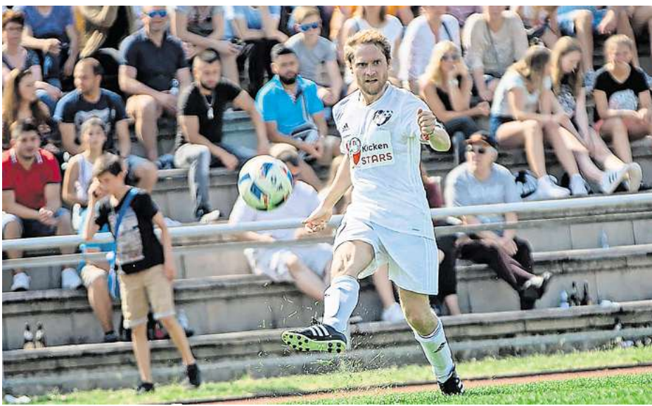
Musiker Johannes Oerding beim Kicken mit Stars 2016 in Holzminen.