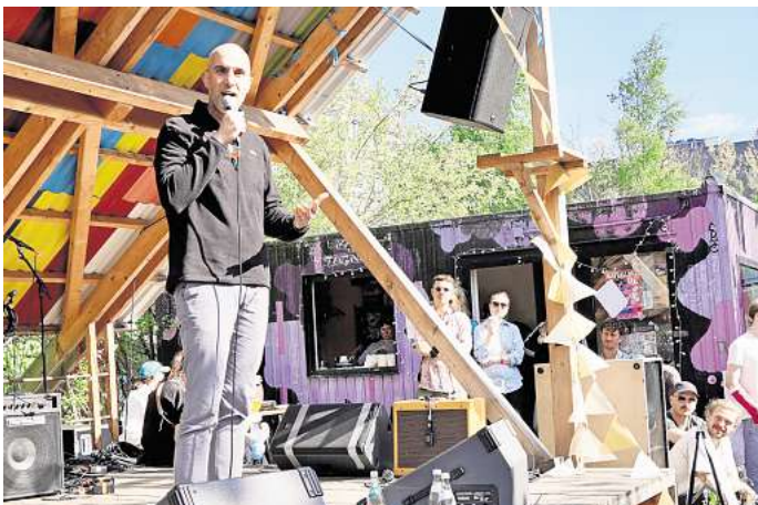
Belit Onay besuchte das Platzprojekt. Der Oberbürgermeister bezeichnete die Initiative als „lebendigen Ausdruck von Gemeinschaft und Stadtentwicklung von unten“.

► Nähere Informationen zum Platzprojekt und Veranstaltungsübersicht: platzprojekt.de