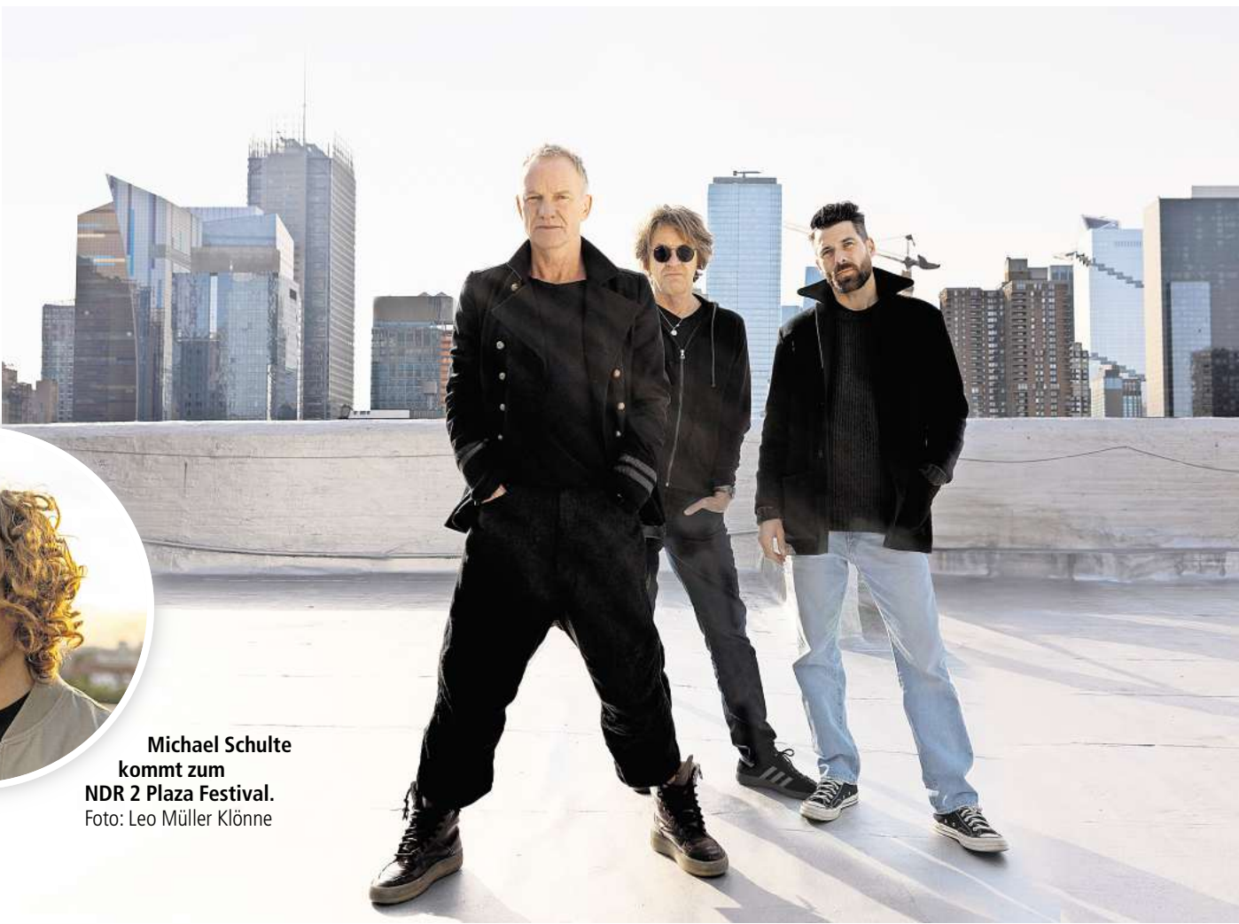
Michael Schulte kommt zum NDR 2 Plaza Festival.

Tagestickets für das NDR 2 Plaza Festival am Freitag, 6. Juni, und die N-JOY Starshow sind jeweils für 67,49 Euro bei Hanno-