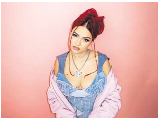
Badmómzjay ist bei der N-Joy Starshow dabei

ver Concerts (0511/12 12 33 33, hannover-concerts.de), www.eventim.de und an allen Vorverkaufsstellen zu haben. Kombitickets kosten 116,99 Euro. Je nach Art der Ticketbestellung (VVK-Stelle, Telefon, Internet) können zusätzliche Gebühren für Bearbeitung und Versand hinzukommen. Die Tickets berechtigen zur Nutzung der öffentlichen Verkehrsmittel an den Veranstaltungstagen im Bereich des Großraum-Verkehrs Hannover (GVH). Kinder von 3 bis 6 Jahren erhalten freien Eintritt.