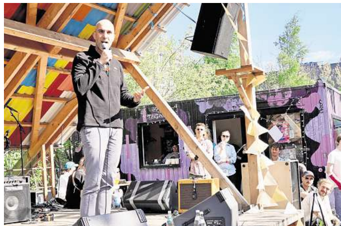
Belit Onay besuchte das Platzprojekt. Der Oberbürgermeister bezeichnete die Initiative als „lebendigen Ausdruck von Gemeinschaft und Stadtentwicklung von unten“.

bis hin zu Campingzubehör alles ausleihen können, was man nur anlassbezogen und nicht ständig braucht, gehören zum Angebot. Der Verein Platz-Projekt hat inzwischen rund 400 Mitglieder. Er steht für Teilhabe und Demokratie im Alltag. Nähere Informationen zum Platzprojekt und Veranstaltungsübersicht: platzprojekt.de