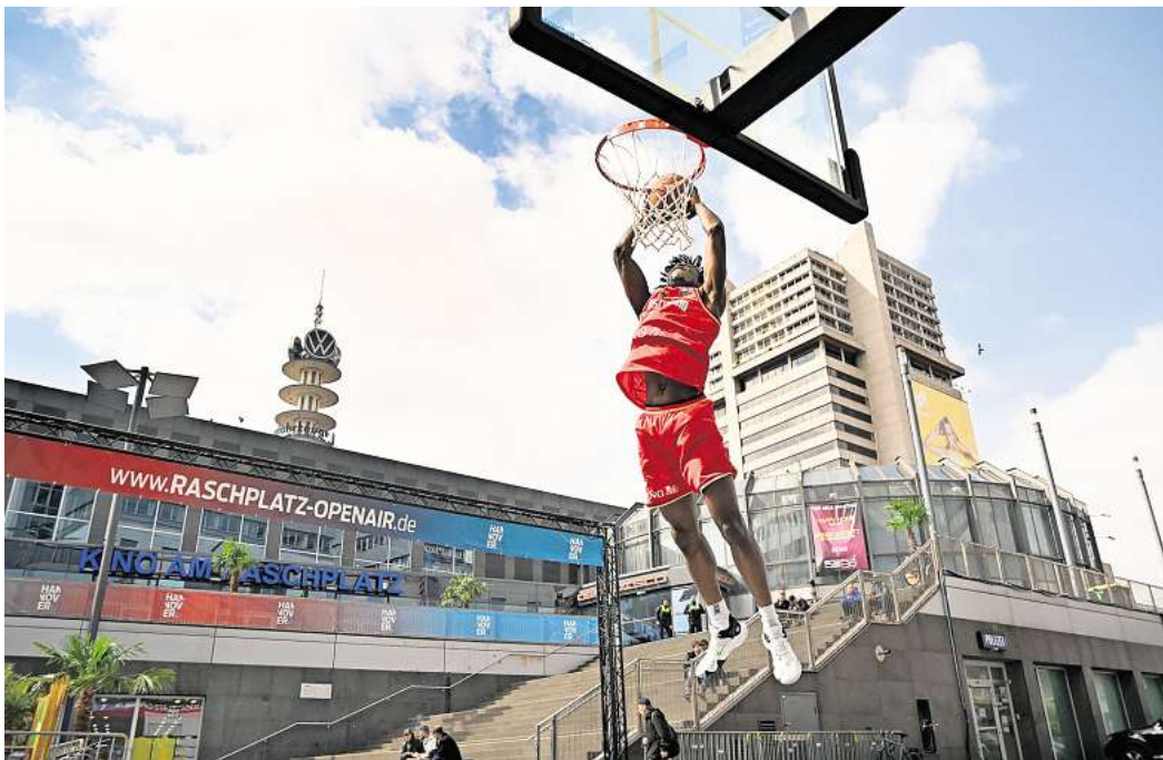
Hannover wird im Juli kommenden Jahres die sogenannten Finals austragen, Deutsche Meisterschaften in 19 verschiedenen Sportarten – darunter auch 3x3 Basketball.