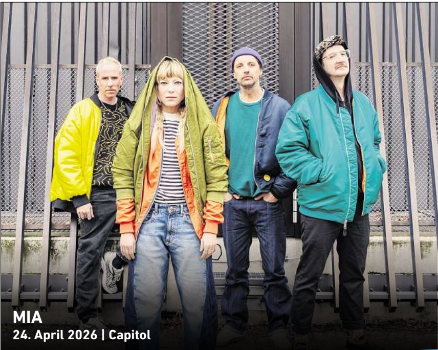
MIA 24. April 2026 | Capitol