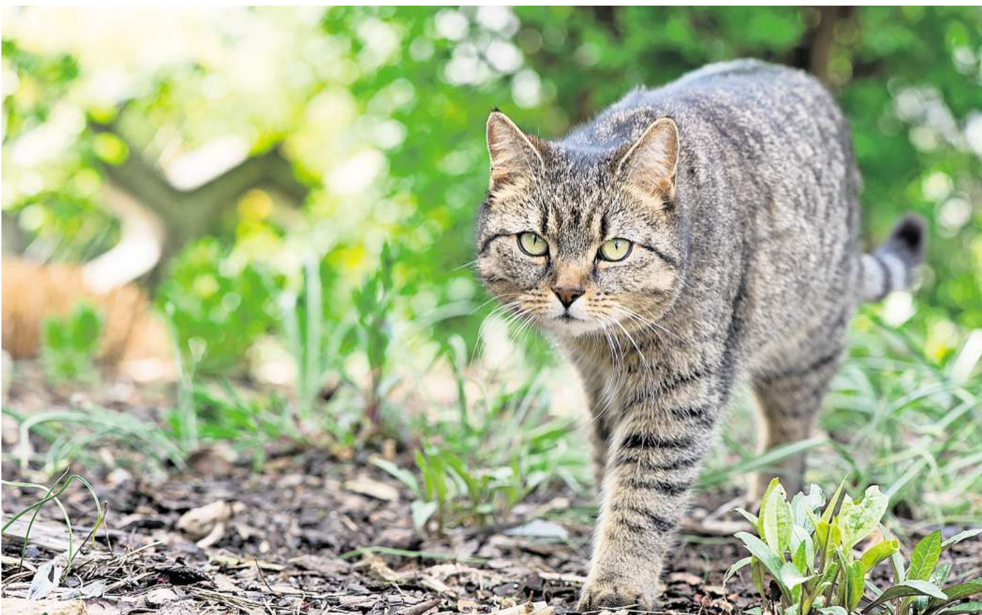
Ist die Bindung zum Heim gefestigt, bietet der Garten eine Möglichkeit für einen kontrollierten Freigang.

Sowohl Katze als auch Kater sollten kastriert worden sein, bevor sie eine Pfote vor die Tür setzen. So lässt sich nicht nur unerwünschter Katzen Nachwuchs vermeiden. Für Kater bedeutet das auch weniger weite Wanderschaften und hormonbedingte Kämpfe mit anderen Ka-