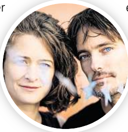
Das Duo Mackefisch

sant wechselt. Oder weil er unvergleichbar lustige, poetische und gnadenlose Texte transportiert. Das wirklich Einzigartige an der mehrfach prämierten Mini-Band ist das Gefühl, mit dem man nach dem Konzert nach Hause geht. Und das ist ein verdammt gutes.