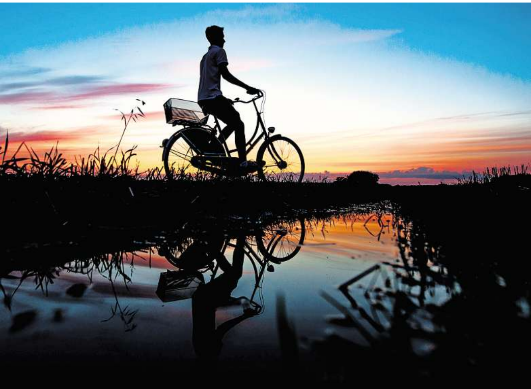
Die Ebenen des Emsradweges sind auch für Ungeübte gut zu schaffen..

Von der Quelle im Paderborner Land bis zur Mündung an der Nordsee in Ostfriesland führt der rund 385 Kilometer lange Emsradweg. Unter anderem die abwechslungsreiche Routenführung und das flache Gelände-profil mache die Strecke zu einem der beliebtesten Flussradwege Deutschlands, teilte die Interessengemeinschaft Emsradweg mit. Ein großer Teil des Radweges führt durch Natur. Unterwegs gibt es aber auch maritimes Flair: So kann man Binnenschiffe anschauen, Ozeanriesen bei der Meyer Werft bestaunen oder Technik am Emssperwerk entdecken. Wer am Ende des Weges in Emden noch Puste hat, kann für eine Extra-Runde noch mit dem Schiff zur Inseltour nach Borkum übersetzen.