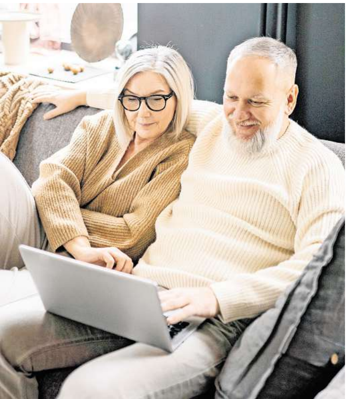
Für die Studie sollten die Teilnehmenden Beziehungstipps bewerten. Interessant: Die von der KI generierten Tipps wurden als hilfreicher bewertet als jene, welche von Therapeuten erstellt wurden.