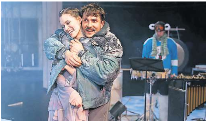
Im Ballhof Zwei: „Das Kind der Seehundfrau“.