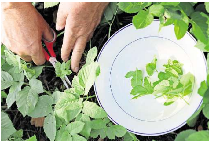
Vom Garten in die Küche: Giersch kann zum Beispiel als Zutat in Suppen oder als Pesto verwendet werden.

► Die Ringelblume wirkt wundheilend. Ringelblumen-Salbe kann man ganz einfach selbst