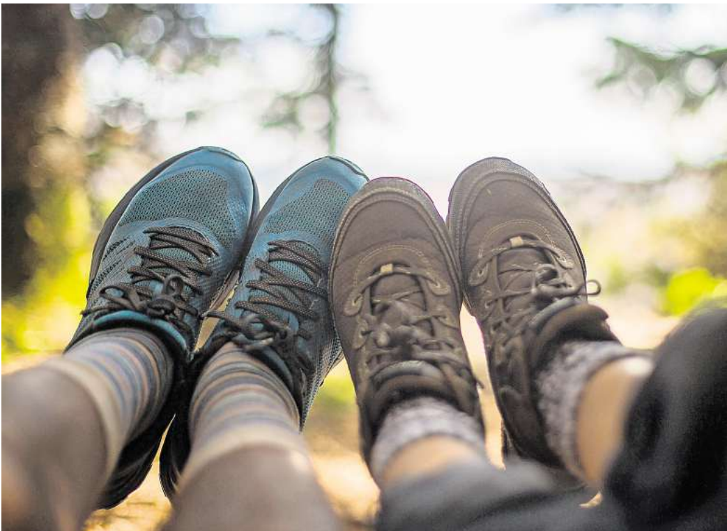
Beginn der Wandersaison: Beim Deistertag warten viele Aktionen.

Springe wird zum Zentrum für Naturbildung und Bewegung.