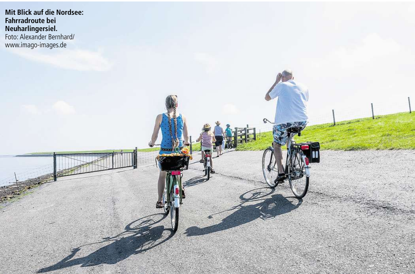
Mit Blick auf die Nordsee: Fahrradroute bei Neuharlingersiel.