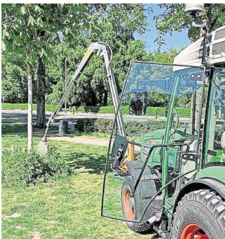
Mit der neuen Gießtechnik können in kürzerer Zeit mehr Stadtbäume bewässert werden.

Neben der Gießtechnik wurde auch das gesamte Bewässerungsmanagement optimiert und digitalisiert: Zu den gärtnerischen Erfahrungen über die Bewässerung kommen auch Daten von etwa 420 Bodenfeuchte-Sensoren und Wettervorhersagen zum Einsatz. Diese Daten dienen als Steuerungsinstrument, um die Bewässerung gezielt und ressourcen-