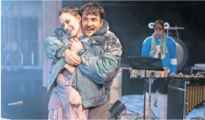
Im Ballhof Zwei: „Das Kind der Seehundfrau“.