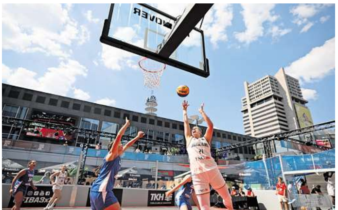
Das 3X3-Basketballfeld am Raschplatz wurde in den vergangenen Jahren sehr gut angenommen.

Zudem lehrt die Erfahrung aus den vergangenen Jahren, dass die Drogen- und Trinkerszene bloß vom Raschplatz verdrängt wird – in Richtung Fernroder Straße, aber auch weiter in Richtung List, wie Anwohner berichteten. Eine nachhaltige Lösung sehe anders aus, meinten Hilfsorganisationen.