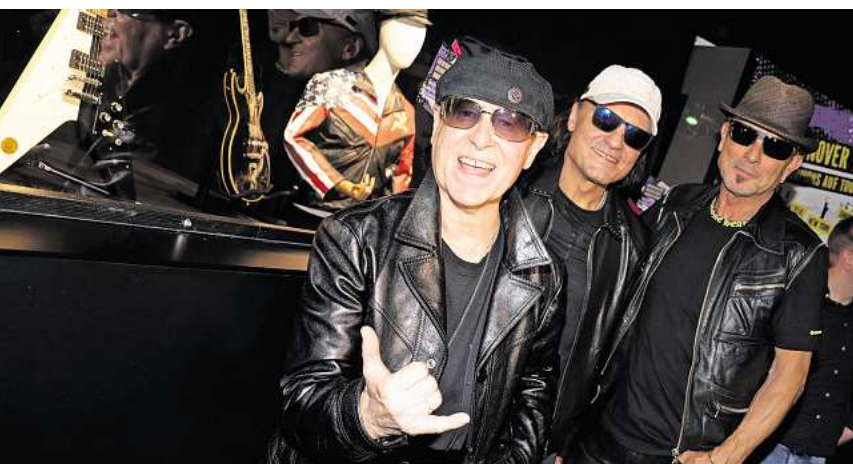
Klaus Meine, Matthias Jabs und Rudolf Schenker bei der Eröffnung der Rockstage im Flughafen Hannover.

Bandgründer Rudolf Schen-ker zeigte sich geschmeichelt von so viel Ehrerbietung. Er erin-nernte daran, dass die Rock-Pro-pheten im eigenen Land lange wenig galten. „Wir haben lan-ge wenig Zuwendung aus Han-nover und generell aus Deutschland bekommen – wir mussten uns dafür ins Ausland verdrücken“, sagte er. „Jetzt aber bekommen wir sie im Überfluss.“