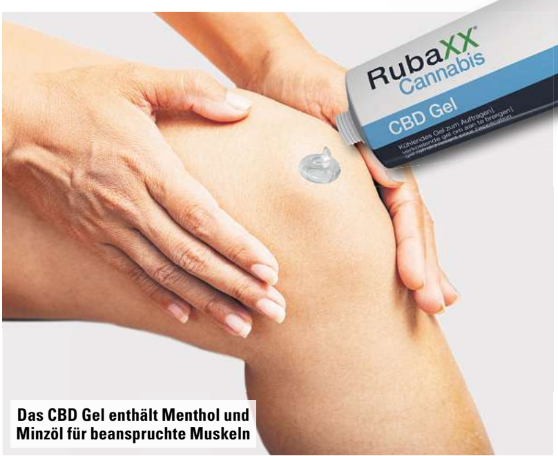
Das CBD Gel enthält Menthol und Minzöl für beanspruchte Muskeln

Hochwertig, geprüft & zertifiziert Das Gel wird unter höchsten Qualitätsstandards in Deutschland her-