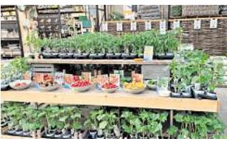
Beim Tomaten- und Gemüseseminar darf auch verkostet werden.