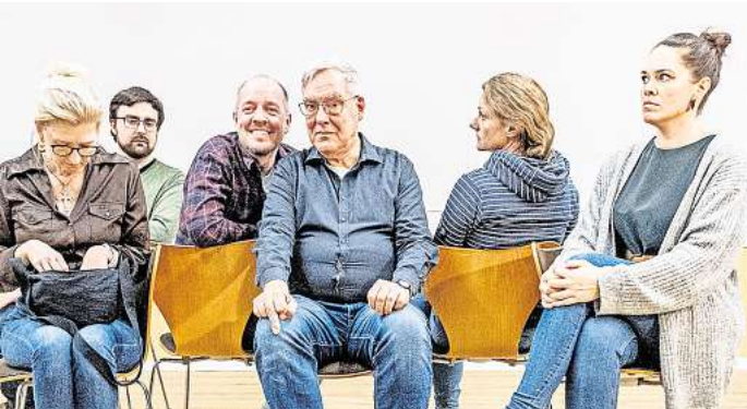
Das Theater Vinolentia zeigt „Toc Toc“.

schen im Wartezimmer nicht nur Patienten, sondern auch sehr individuelle Persönlichkeiten. Dies sorgt für unterhaltsame Missverständnisse und anrührende Momente. Das Stück ist ein temporeiches Plädoyer dafür, seine eigenen Befindlichkeiten nicht allzu ernst zu nehmen und den Eigenheiten anderer Menschen mit Nachsicht zu begegnen. Der Eintritt kostet im Vorverkauf 12 Euro zuzüglich Gebühren, an der Abendkasse 15 Euro. RED