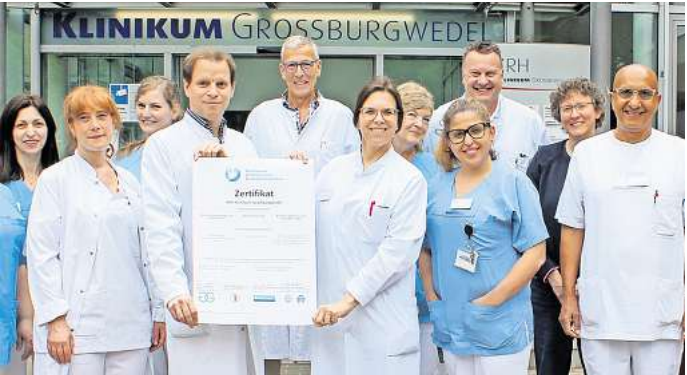
Die Expertinnen und Experten des Kontinenz- und Beckenbodenzentrums informieren in Fachvorträgen.

Medikamenten – eine spürbare Besserung erreichen. Manchmal ist auch eine Operation sinnvoll. Das KBZ bietet ein umfassendes Spektrum an Kontinenz-Operationen an. Diese können häufig minimalinvasiv durchgeführt werden. Nach einer Begrüßung und Vorstellung stehen Fachvorträge auf dem Programm. Die Themen und Anfangszeiten lauten ab 17.15 Uhr „Wenn es drückt und drängt – Was tun bei Senkungsbeschwerden“, ab 17.30 Uhr „Der schwere Toilettengang bei Beckenbodenschwäche – die Chirurgie kann helfen“, ab 17.45 Uhr „Behandlung von Enddarmkrankungen mit Laser“, ab 18 Uhr „Ständiger Harndrang? Endlich Ruhe für die Blase“ sowie ab 18.15 Uhr „Therapie der Belastungsharninkontinenz bei Frauen und Männern: Gemeinsamkeiten – Unterschiede“. Der Veranstaltungsort liegt im Hauptbahnhof Hannover in der Niki-de-Saint-Phalle-Promenade unter Gleis 2 und 3. Der Eintritt ist frei.