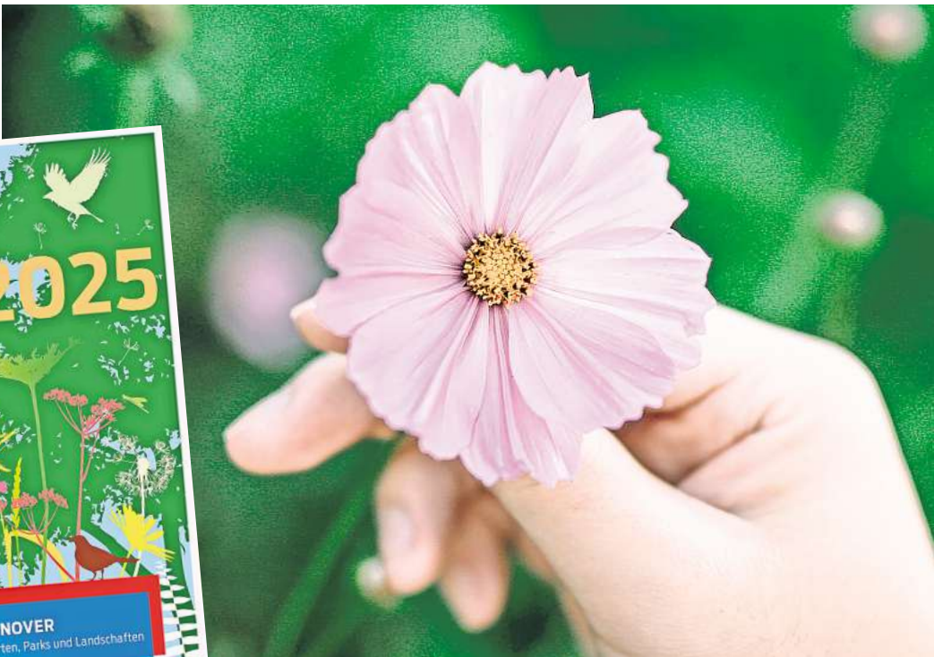
Natur vor der Haustür entdecken: Die Touren-Reihe „Grünes Hannover“ startet wieder.

Das Veranstaltungsprogramm „Grünes Hannover“ startet 2025 am Freitag, 4. April, mit einem Rundgang durch die „Ex-Ben Garten in Herrenhausen und direkt im Foyer beim Fachbereich Umwelt und Stadtgrün, Arndtstraße 1, erhältlich. Der Versand von Heften ist grund-