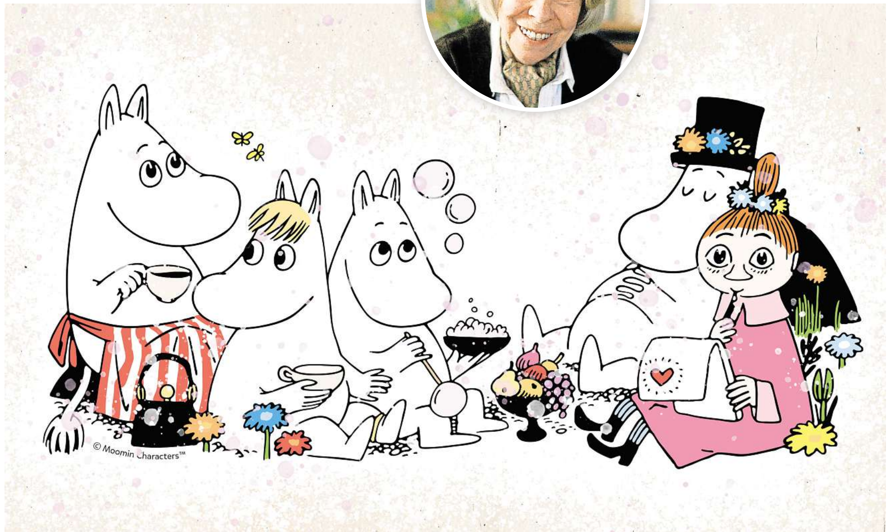
Die Mumins werden 80: Sie mögen zwar an Flusspferde erinnern, sind aber keine.