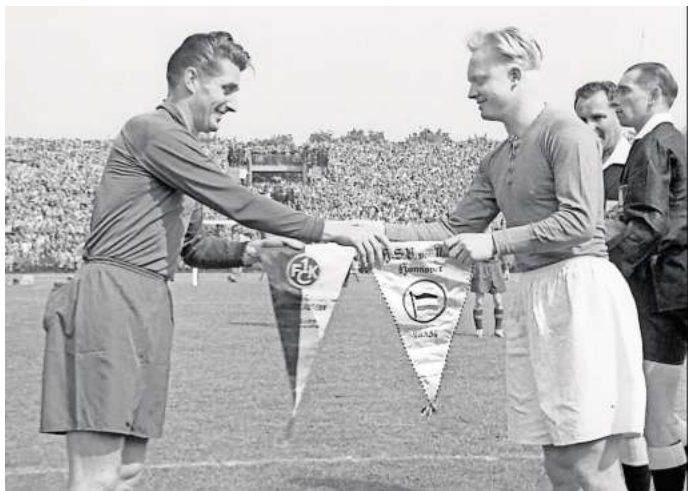
Film über das Endspiel zur Deutschen Fußballmeisterschaft 1954 Hannover 96 gegen den 1. FC Kaiserslautern