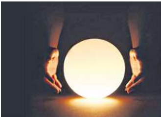
Fotoausstellung „Lichtblick – Menschenwürde schützen“.