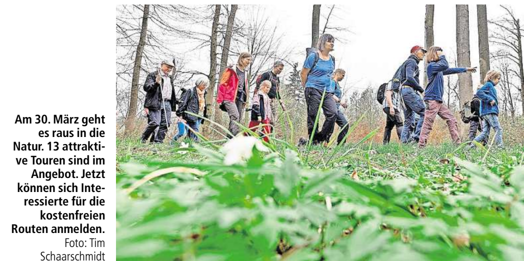
Am 30. März geht es raus in die Natur. 13 attraktive Touren sind im Angebot. Jetzt können sich Interessierte für die kostenfreien Routen anmelden.