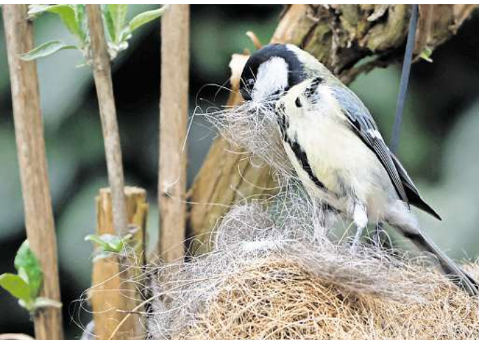
In jedem Nest waren mindestens zwei und bis zu elf verschiedene Insektizide nachweisbar.

Tatsächlich fanden die Autoren und Autorinnen der Studie klare Hinweise darauf, dass die Insektengifte den Vögeln geschadet hatten. Je größer die Rückstände der Insektizide waren, desto mehr tote Jungtiere oder ungeschlüpfte Eier fanden sich in den Nestern.