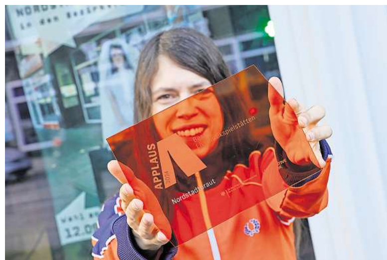
Da war die Welt noch in Ordnung: Die Nordstadtbraut gewinnt im November 2024 den mit 30.000 Euro dotierten Applaus Award für die Beste Livemusikspielstätte. Doch drei Monate später erfolgte die Kündigung.

► Wer Hinweise auf mögliche Räumlichkeiten in der Nordstadt hat, in denen auch Livemusik gespielt werden kann, kann sich gerne unter clemens.niehaus@wochenblaetter.de melden.