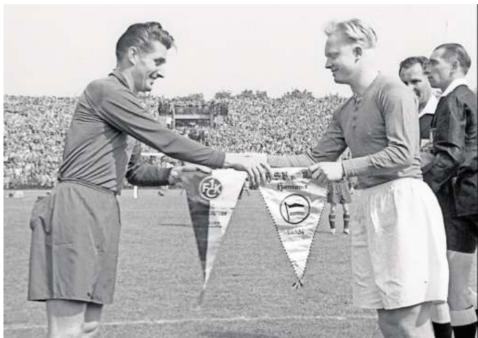
Film über das Endspiel zur Deutschen Fußballmeisterschaft 1954 Hannover 96 gegen den 1. FC Kaiserslautern

Die Karten werden verlost, wer dabei sein will, kann das unter https://aktion.haz.de/haznp/angebot/96filmabend-haznp tun oder mit dem untenstehenden QR-Code.