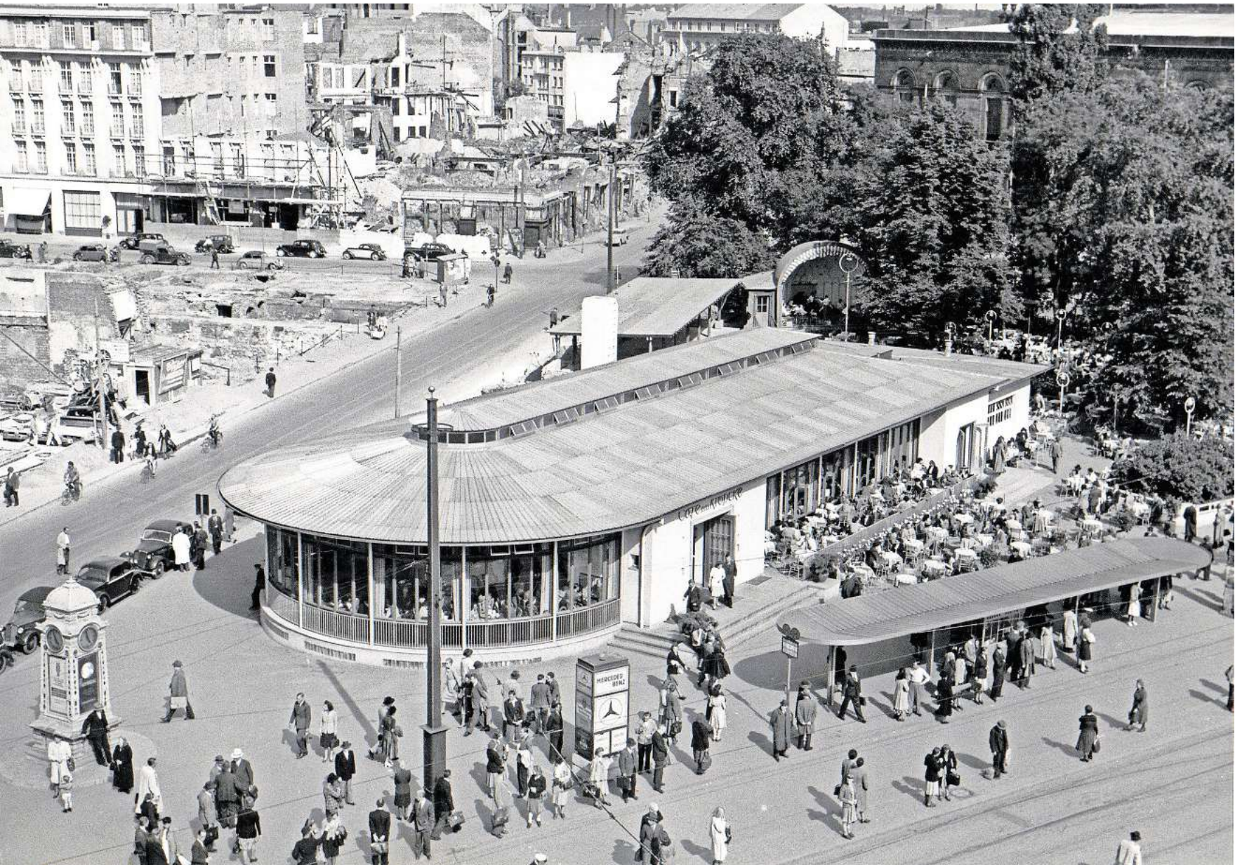
Das Café Kröpcke im Jahr 1949.