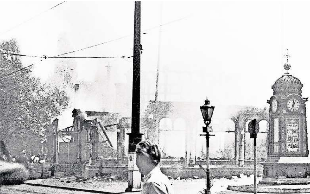
Im Juli 1943 liegt das Café Kröpcke in Trümmern