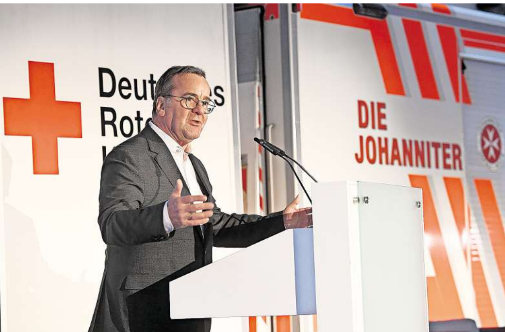
Viel Lob: Verteidigungsminister Boris Pistorius blickte anerkennend auf die Hilfsorganisationen.

Der Minister griff in der Fahrzeughalle der Johanniter am Kabelkamp vor rund 200 Zuschauern von Polizei, Feuerwehr, dem Technischen Hilfswerk, mehreren Hilfsorganisationen sowie Vertretern von Landes- und Kommunalbehörden zu deutlichen Worten: „35 Jahre ohne Kalten Krieg und Bedrohungslagen haben dazu geführt, dass wir nicht in Verteidigung und Zivilschutz investiert haben. Aber Krisen fordern uns jetzt häufiger, schneller und sehr variantenreich. In Russland treibt Putin eine Kriegswirtschaft. Er befiehlt hybride An-