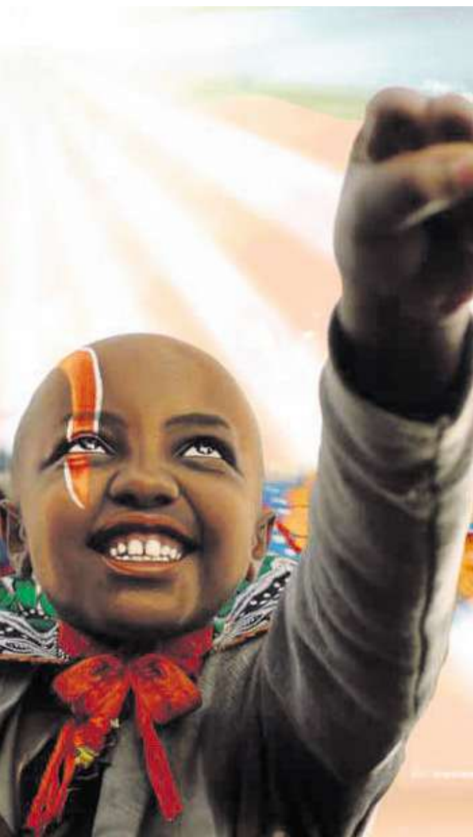
Spannende Filme für eine gerechtere Welt laufen vom 5. bis 26. Februar in den hannoverschen Kinos.

Ihren Abschluss findet die Filmreihe am 26. Februar im Kino am Künstlerhaus mit dem Film Das leere Grab . Die Dokumentation erzählt von den Spuren und Traumata, die die einstige deutsche Kolonialherrschaft in tansanischen Fa-