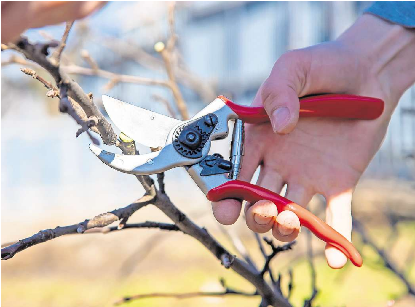
Je stärker der Schnitt, desto stärker der Austrieb: Wer seinen Apfelbaum gut pflegt, erhöht die Chancen auf eine gute Ernte.

An Gabelungen, die oft am Ast entstehen, entscheidet man sich für einen der beiden Triebe, auf den der Baum seine Energie konzentrieren soll, und kaptet den jeweils anderen. „Ableiten“ nennen Fachleute das. Stehen bleibt der Ast, dessen Richtung am besten in die Form