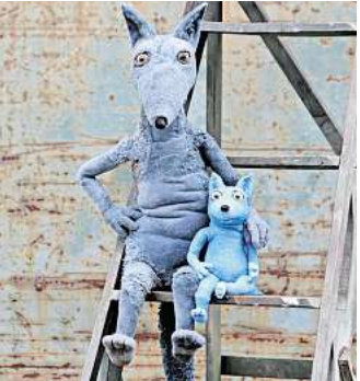
Das Theatrio präsentiert das Stück „Großer Wolf und kleiner Wolf“.

Suche nach einem verlorenen Kuschelkissen auf die Bühne bringt. Denn ohne dieses kann Erdmännchen Tafiti beim besten Willen nicht einschlafen. Zum Glück hilft ihm sein Freund, das Pinselohrschwein. Sie suchen bei der Ameisenarmee und der verliebten Eule, begegnen dem trampelnden Nashorn und dem gefräßigen Leoparden, der sie