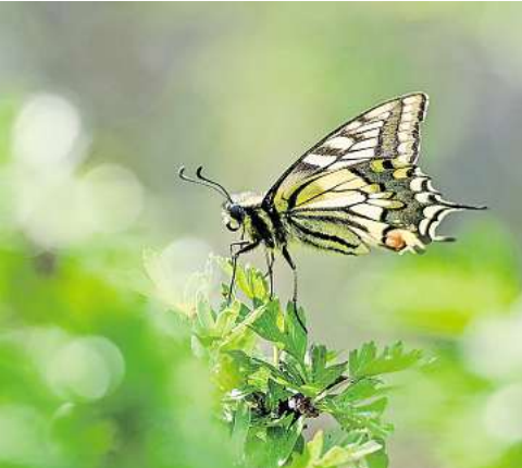
Die Ausstellung „Kleine Welt ganz groß“ ist im Kunstgang der MHH zu sehen.

Parallel dazu ist bis zum 28. Februar die Ausstellung „Streetlife“ des hannoverschen Fotografen Bernd Reinert mit Szenen aus vielen Ländern der Welt zu sehen – präsentiert werden Bilder ohne Inszenierung, die im öffentlichen Raum entstanden sind. Geöffnet ist der Kunstgang täglich von 8 bis 21 Uhr bei freiem Eintritt. RED