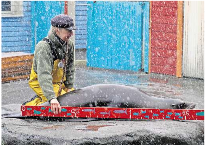
Ganz schön lang: ein kalifornischer Seelöwe.

schungsprojekten auf den Gebieten der Verhaltensbiologie, Tiermedizin, Mikrobiologie, Genetik und KI-basierten Analysen mitgewirkt.