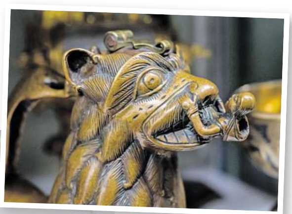
Ein Türzieher aus der Marktkirche.