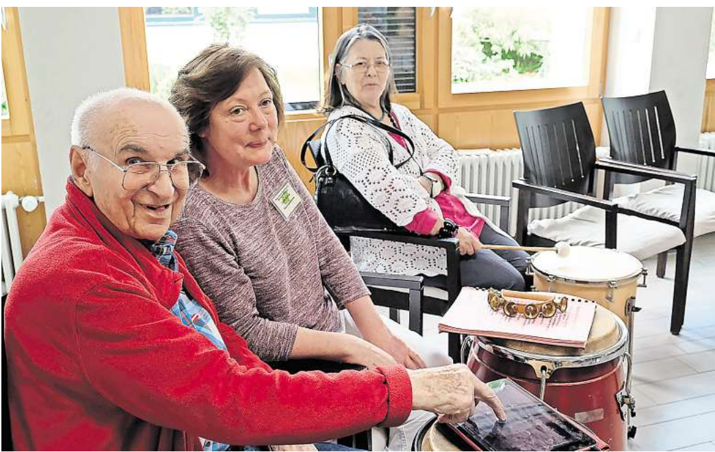
Das neue „Lebenswerk3“-Projekt startet im Frühjahr 2025

Eigene musikalische Talente entdecken, selbst künstlerische Werke schaffen und kulturelle Erlebnisse mit anderen teilen – dazu haben gesundheitlich und mobilitätseingeschränkte ältere Menschen kaum Gelegenheit. Das will die Landesarbeitsgemeinschaft Rock in Niedersachsen e.V. (LAG Rock) mit einem neuen Projekt ändern. „Lebenswerk3“ ermöglicht Bewohnerinnen und Bewohnern von Pflegeheimen die kulturelle Teilhabe durch den Einsatz von digitalen Medien und analogen Musikinstrumenten. Aus Lebenserinnerungen entstehen mithilfe von Musik-Apps zum Beispiel Songs oder Hörspiele, die in Digitalkonzerten den Teilnehmenden der anderen Einrichtungen präsentiert werden. Angeleitet werden die wöchentlichen Kurse über drei Jahre hinweg von Tandem-Teams aus musikpädagogischen Profis und jungen Assistenzkräften. Die Workshops in den Einrichtungen werden im Frühjahr 2025 beginnen. Die Seniorinnen