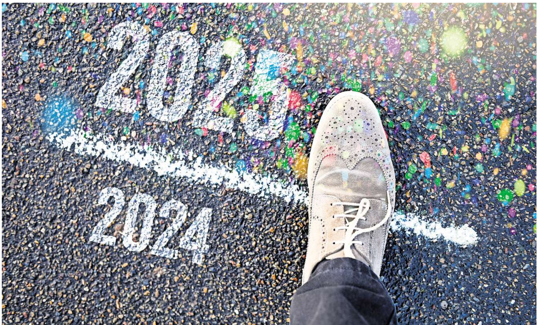
Auf der Schwelle zum neuen Jahr: 2024 liegt hinter uns – 2025 bringt einiges an Veränderungen.

Endgültiges Aus für die Blauen Säcke in der gesamten Region Hannover: Ab Januar 2025 be-liefert der Abfallentsorger Aha den Einzelhandel nicht mehr mit