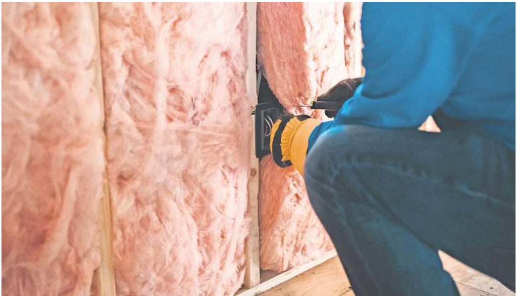
Dämmen oder eine nachhaltige Heizung einbauen? Viele deutsche Immobilienbesitzer würden dies freiwillig nicht tun, zeigt eine Umfrage.

Das Gute: Dafür gibt es zusätzliches Fördergeld. Seit dem Sommer werden bei Ein- und Zweifamilienhäusern 50 Prozent des förderfähigen Beratungshonorars übernommen – maximal 650 Euro. Für Gebäude ab drei Wohneinheiten sind bis zu 850 Euro möglich. Für Wohnungseigentümergeinschaften gibt es zusätzlich einmalig 250 Euro Förderung, wenn Beratungsergebnisse im Rahmen einer Wohnungseigentümersammlung erläutert werden. Die Förderung von Energieberatungen für Wohngebäude wird über das Bafa-Portal abgewickelt.