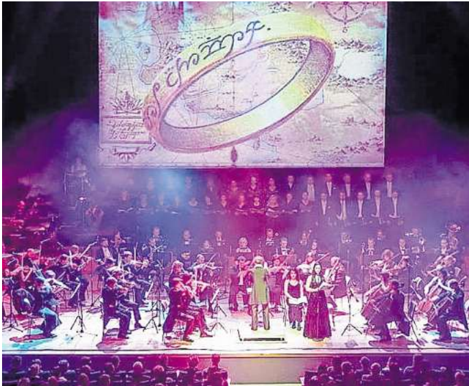
Eine musikalische Reise nach Mitteleuropa.