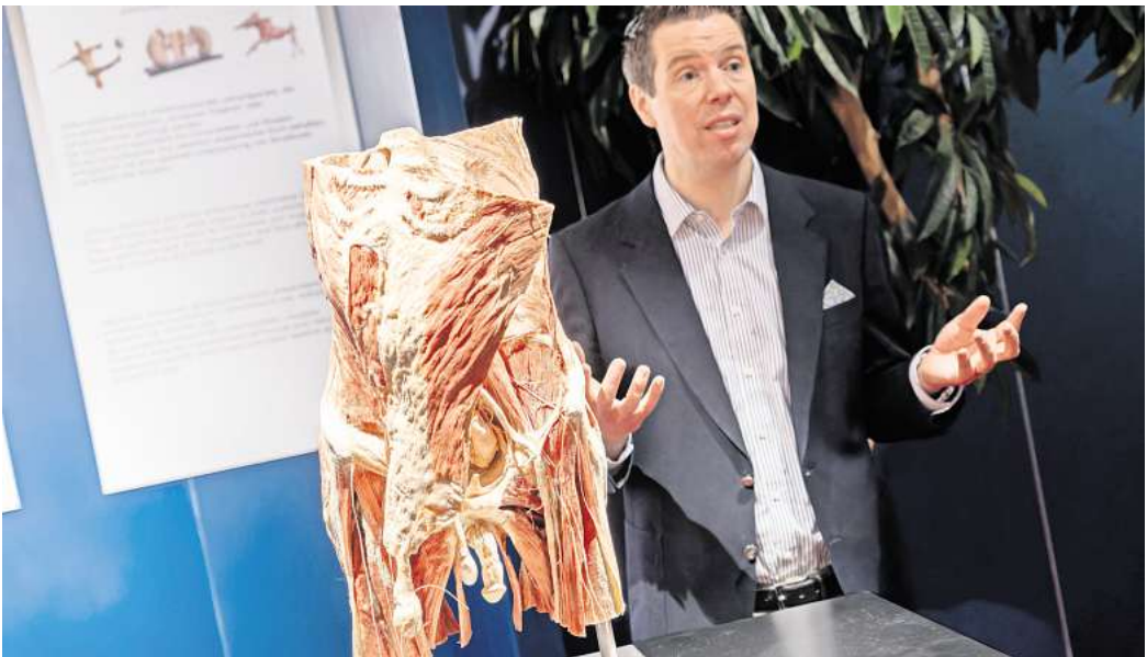
Rurik von Hagens führt durch Plastinationswerkstatt und Ausstellung.