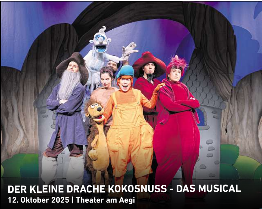
DER KLEINE DRACHE KOKOSNUSS - DAS MUSICAL 12. Oktober 2025 | Theater am Aegi

Ihr persönlicher Ticketservice der HAZ & NP