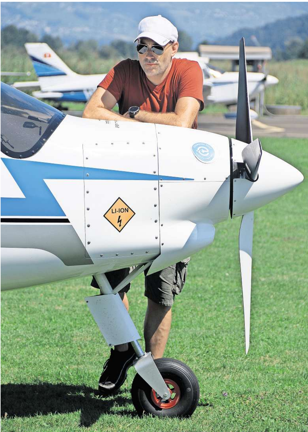
Zukunftsforscher und Flugpionier: Weltrekordflieger Morell Westermann glaubt fest daran, dass wir noch viel weiter sein könnten, wenn wir mutig neue Erfindungen nutzen würden.

Bis E-Ferienflieger Passagiere klimaneutral auf Langstrecken transportieren, wird es dauern. Aber dass E-Flugzeuge für kurze Strecken in naher Zukunft eingesetzt werden, davon ist Westermann, der auch als TV-Experte häufig gefragt ist, überzeugt: „Der Pendelverkehr von der Nordseeküste zu den Inseln mit E-Flugzeugen ist möglich“, nennt er ein Beispiel.