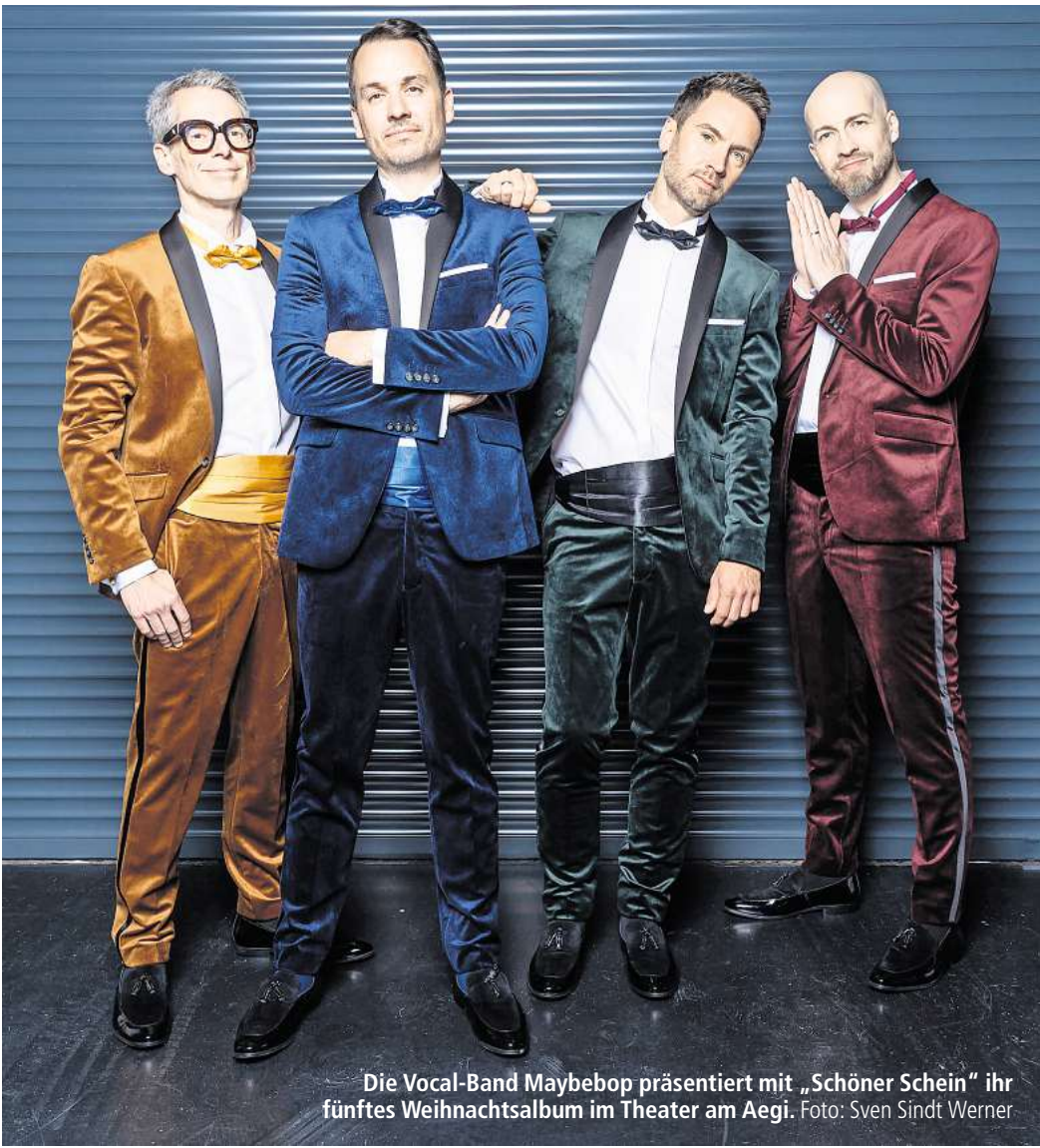
Die Vocal-Band Maybeop präsentiert mit „Schöner Schein“ ihr fünftes Weihnachtsalbum im Theater am Aegi.