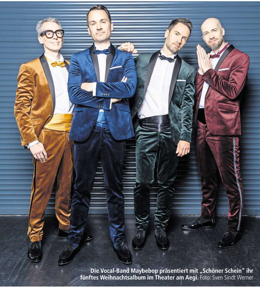
Die Vocal-Band Maybebop präsentiert mit „Schöner Schein“ ihr fünftes Weihnachtsalbum im Theater am Aegi.