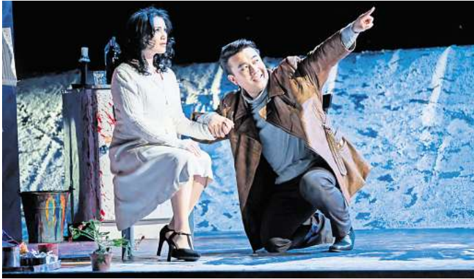
La Bohème - Oper von Giacomo Puccini.

HANNOVER. Das Merz-Theater, Brehmstraße 10, präsentiert am Sonntag, 22. Dezember, ab 17 Uhr und am Dienstag, 24. Dezember, ab 11 Uhr „Das Oberuferer Christgeburtspiel“. Mit humorvollen, lauten und andächtigen, ruhigen Szenen wird nicht nur von Maria, Josef und dem Jesus-Kindlein erzählt, sondern auch, was die drei Hirten Witok, Stichel und Gallus zu dieser Zeit umtreibt. Das Stück ist geeignet für Kinder ab vier Jahren. Eintrittskarten können zum Preis von 12 Euro, ermäßigt 8 Euro, online reserviert werden. RED