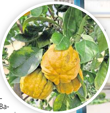
Citrus Aurantium allein kommen. Foto: Großer Garten