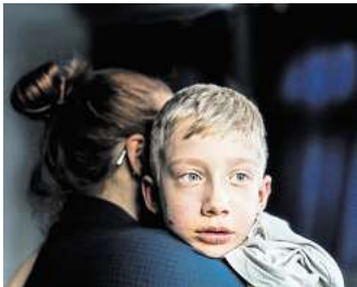
Auf der Warteliste für Spenderorgane: Anton Vester hat für sein Projekt „Ohnmächtige Stille“ den VGH-Fotopreis erhalten. Seine Bilder sind in der GAF zu sehen.

HANNOVER. Weihnachten in Paris. Vier lebenslustige junge Männer, die am Rande der Gesellschaft leben und sich dieser weder anpassen können noch wollen. Die Suche nach ein bisschen Glück in einem Leben, das nicht fair spielt. Eine tragisch endende Liebesgeschichte. Traditionell zur Weihnachtszeit kehrt „La Bohème“ von Giacomo Puccini auf den Spielplan und die Bühne der Staatsoper Hannover zurück. In der bunten Inszenierung von Chris Alexander, die in diesem Jahr ihren 25. Geburtstag feiert, geht es auf den Weihnachtsmarkt im Pariser Quartier Latin. Der Schriftsteller Rodolfo, der Maler Marcello, der Philosoph Colline und der Musiker Schauvard teilen sich eine Mansarde – und fristen ein Leben zwischen bitterer Armut und romantischem Künstlerklischee. Zunächst bekommen sie auf dem kalten Dachboden Besuch: von ihrem Vermieter, für den sie im wahrsten Sinne des Wortes