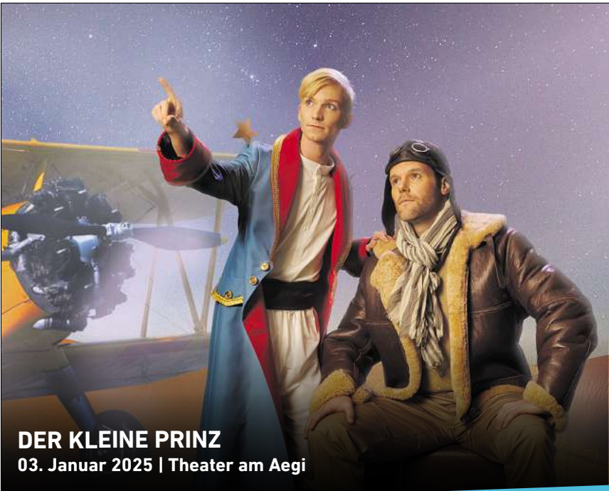
DER KLEINE PRINZ 03. Januar 2025 | Theater am Aegi

Weihnachtszirkus Hannover Diverse Termine: Schützenplatz