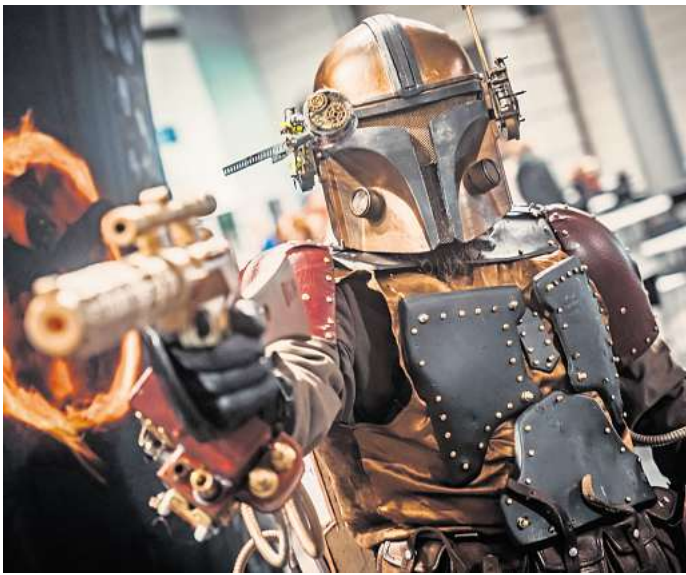
Scienc-Fiction-Sets, Cosplay und jede Menge Spielspaß warten auf dem Messegelände.