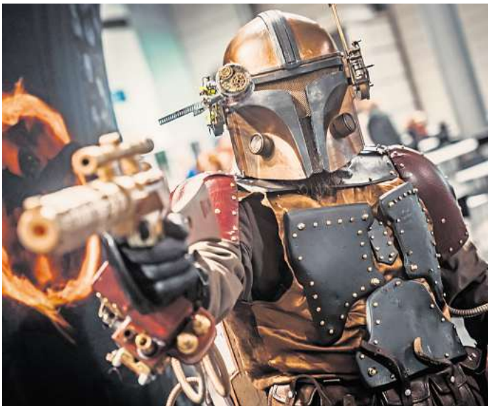
Scienc-Fiction-Sets, Cosplay und jede Menge Spielspaß warten auf dem Messegelände.

Austausch mit der Community. In Miniaturschlachten kann man sich beim Tabletop-Treff Hannover stürzen und dabei gleich in Workshops lernen, wie man Figuren bemalt. Der Verein Dragon Legion e.V. bietet One-Shots für verschiedene Rollenspiele an – perfekt, um neue Systeme kennenzulernen oder in die Welt des Pen & Paper einzutauchen. Außerdem dabei: die Macher des YouTube-Formats „Keep on rolling“. Also: Würfel rausgeholt und auf ins Abenteuer! Geöffnet ist am Sonnabend von 10 bis 20 Uhr und am Sonntag von 10 bis 18 Uhr. Tickets gibt es ab 20 Euro.