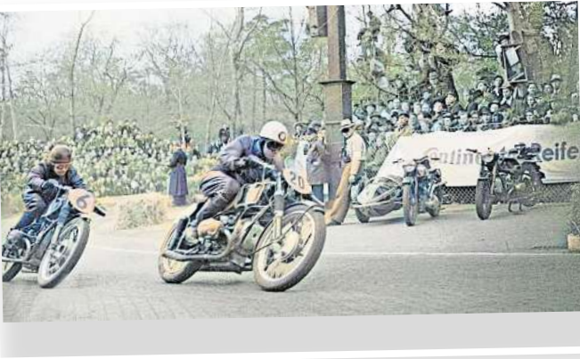
Nachträglich in Farbe: die Neuauflage des Eilenriederennens im Jahr 1950.

der Fahrbahn – denn du bist doch der Schwächere.“