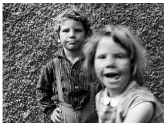
Fotos von Thomas Deutschmann sind in der GAF zu sehen.

den die Aufnahmen durch eine politische und historische Einordnung der Lagerwelt von einst und durch Interviews mit den Betroffenen. Geöffnet ist die GAF von Donnerstag bis Sonntag von 12 bis 18 Uhr bei freiem Eintritt. Am 8. und 14. November führt Thomas Deutschmann jeweils ab 18 Uhr durch die Ausstellung. Die Anmeldung unter Angabe der Anzahl der Teilnehmenden ist möglich bei Thomas Deutschmann per Mail an: thomas@deutschmann-fotografie.de . Die Plätze sind begrenzt. RED