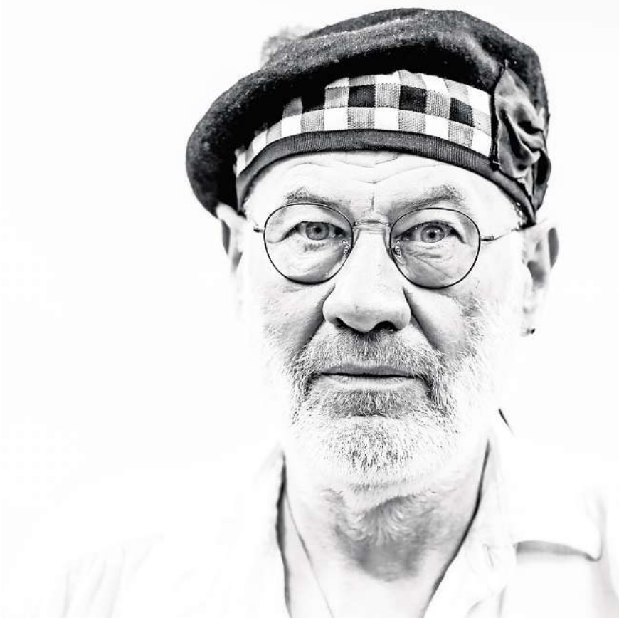
Fish spielt im Capitol.

magaScene: Du warst von 1981 bis 1988 sehr erfolgreich mit Marillion unterwegs und hast eigentlich alles erreicht, wovon junge Musiker nur träumen können. Genau auf dem Höhepunkt des Erfolges mit Ma-