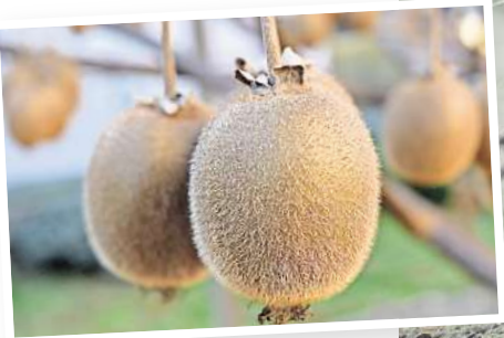
Erntereif: Kiwis

Allerdings kann dieser Versuch nur mit Exemplaren gelingen, die bereits im Frühling ausgepflanzt wurden und in einem durchlässigen Boden Wurzeln schlagen konnten. Wer sicher sein möchte, dass die Schützlinge überleben, räumt die sommergrünen Schmucklilien ebenso wie die ohnehin empfindlicheren immergrünen Sorten vor dem Frost in ein kühles Winterquartier. Temperaturen über dem Gefrierpunkt und möglichst unter zehn Grad Celsius gelten als ideal.