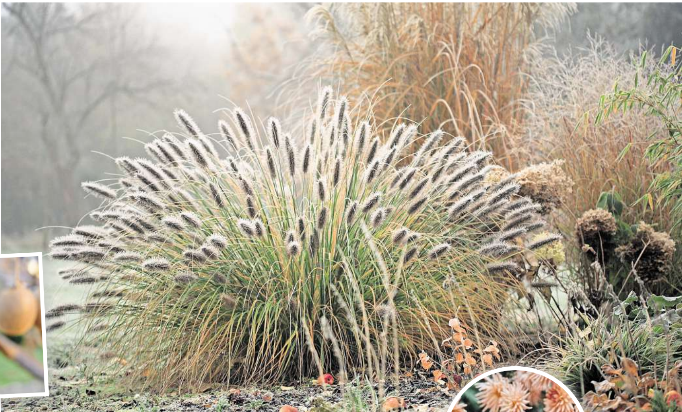
Winterhart: In den kommenden Monaten zählt Chinaschilf zu den Hinguckern im Garten.

Schneiden Sie die Früchte ab und legen sie diese nebeneinander in flache Kisten. In einem kühlen Raum, zum Beispiel dem Keller, lassen sie sich lagern und reifen innerhalb von wenigen Wochen nach. Genussreif sind sie, wenn die Frucht auf leichten Druck nachgibt.