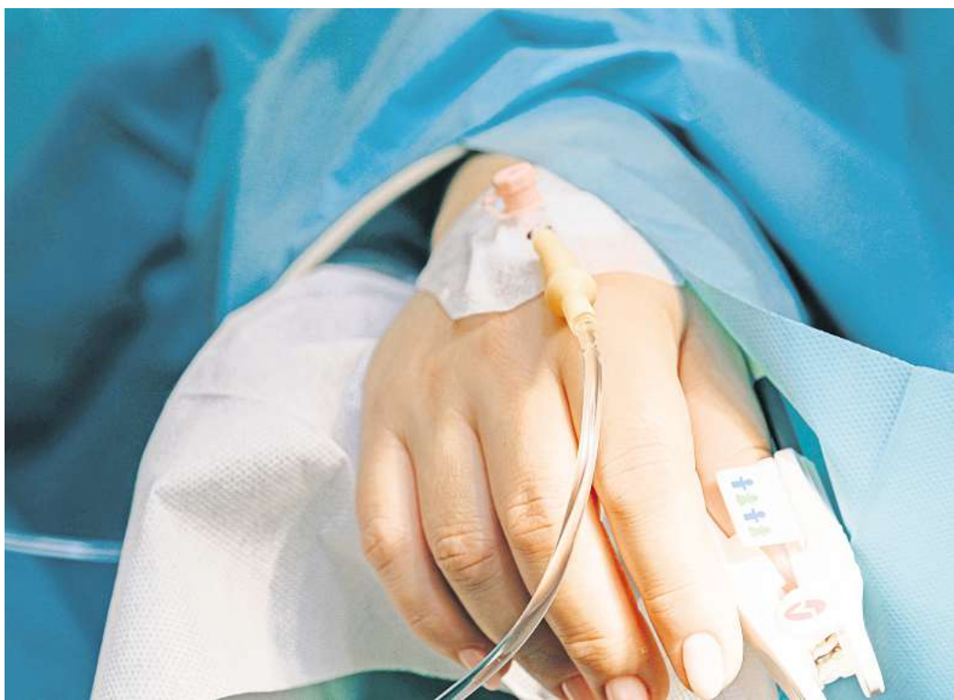
In der Medizin herrschen laut einer Studie Vorurteile gegen Frauen. Für eine adäquate Behandlung mit Schmerzmitteln müssen Patienten anscheinend vielerorts ein Y-Chromosom vorweisen.