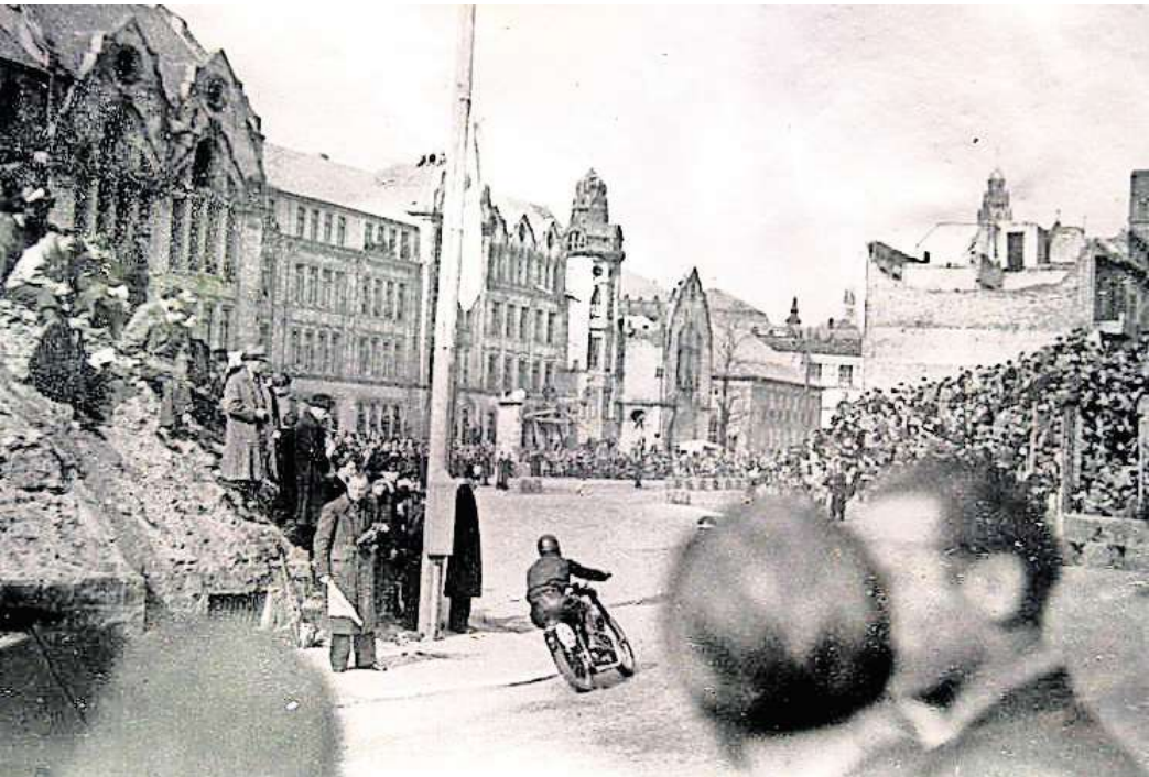
Zwischen Trümmerbergen: Das Maschseerennen von 1949 gilt als einziges Autorennen, das es je in Hannover gab. Mitveranstalter war der Lindener Motorrad- und Automobil-Club.

Die Motorisierung der Gesellschaft nahm seinerzeit gerade Fahrt auf – allerdings noch im