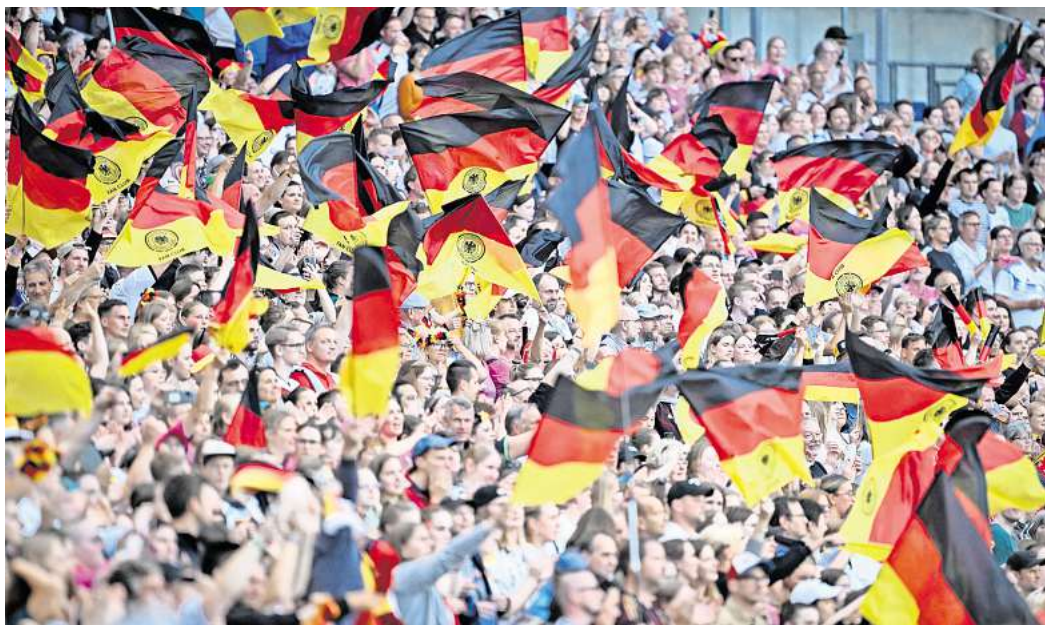
Begeisterung: Zum Spiel der DFB-Frauen im Juli 2024 in der Heinz von Heiden Arena in Hannover kamen über 40.000 Besucher und Besucherinnen.

Der DFB muss bis zum 12. März 2025 die vorläufigen Bewerbungsunterlagen mit den deutschen Austragungsorten an die UEFA melden, bis zum 28. August müssen die vollständigen Unterlagen vorliegen. Im Dezember 2025 wird der Ausrichter durch das UEFA-Eksekutivkomitee bekanntgegeben.