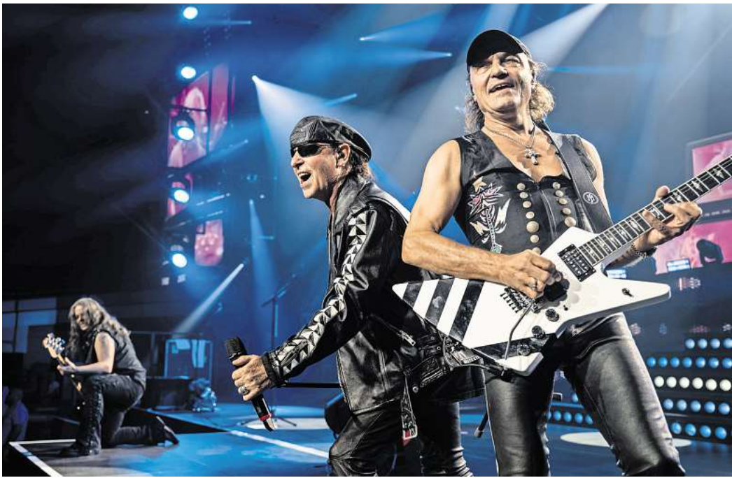
Erstes Stadionkonzert in Hannover: Die Scorpions rocken 2025 endlich in der heimischen Heinz von Heiden Arena.

„Hometown“ ist das Motto für die Show, zu der sich die Scorpions Gäste eingeladen haben: wie zum Beispiel Judas Priest. Die englischen Schwermetalter mit ähnlich viel Rockjahren auf dem Buckel wie ihre deutschen Kolle-