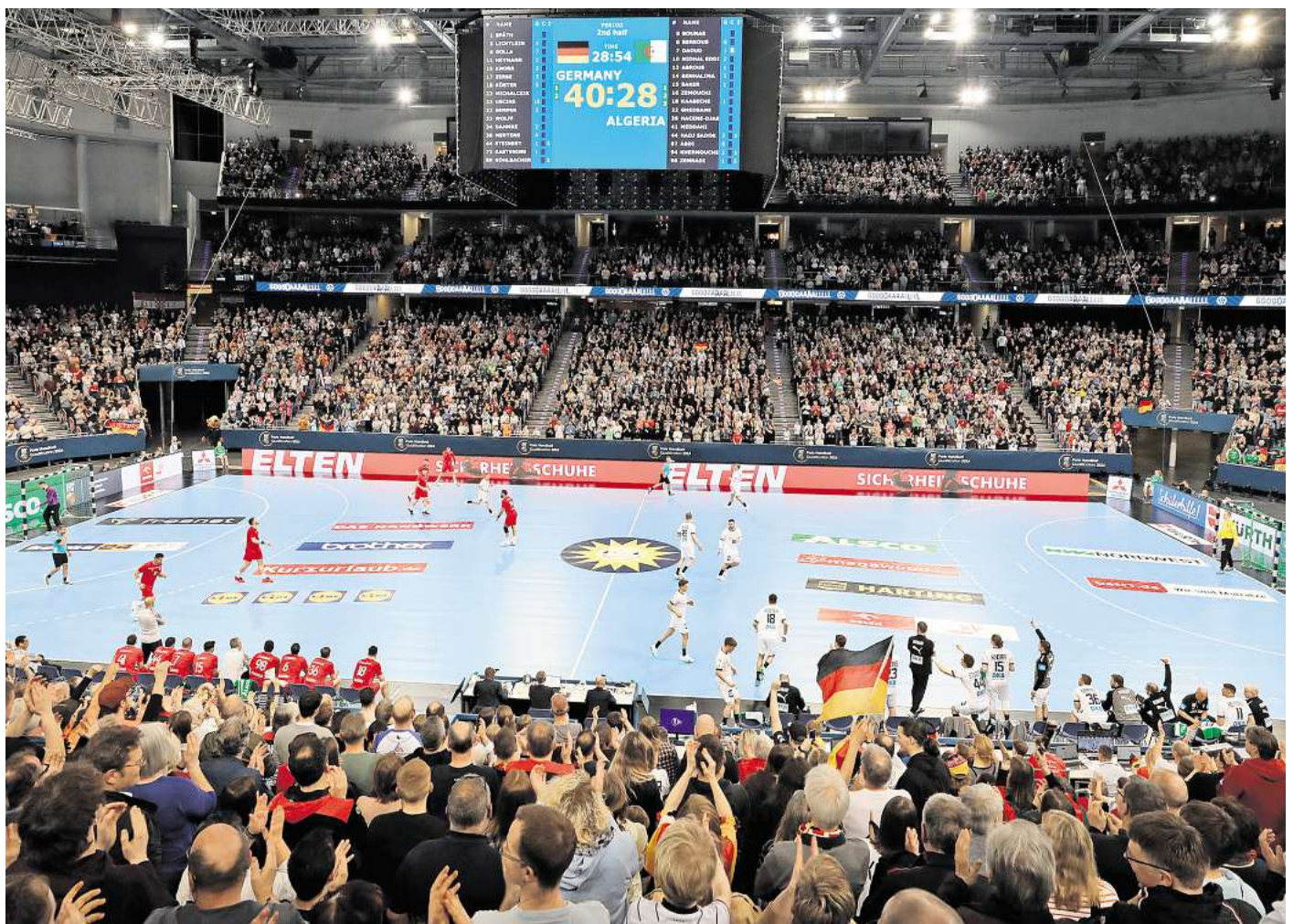
Handball-Länderspiel in Hannover: 2027 wird es in der ZAG Arena Hauptrundenspiele bei der WM geben.