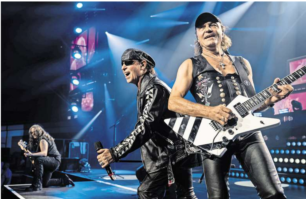
Erstes Stadionkonzert in Hannover: Die Scorpions rocken 2025 endlich in der heimischen Heinz von Heiden Arena.

„Hometown“ ist das Motto für die Show, zu der sich die Scorpions Gäste eingeladen haben: wie zum Beispiel Judas Priest. Die englischen Schwermetalter mit ähnlich viel Rockjahren auf dem Buckel wie ihre deutschen Kolle-