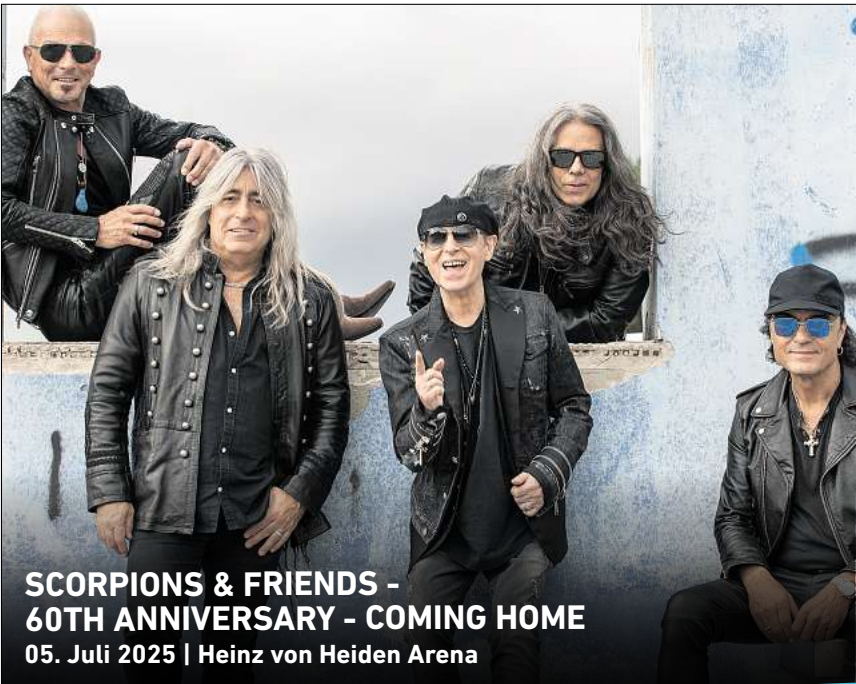
SCORPIONS & FRIENDS - 60TH ANNIVERSARY - COMING HOME 05. Juli 2025 | Heinz von Heiden Arena

Ihr persönlicher Ticketservice der HAZ & NP