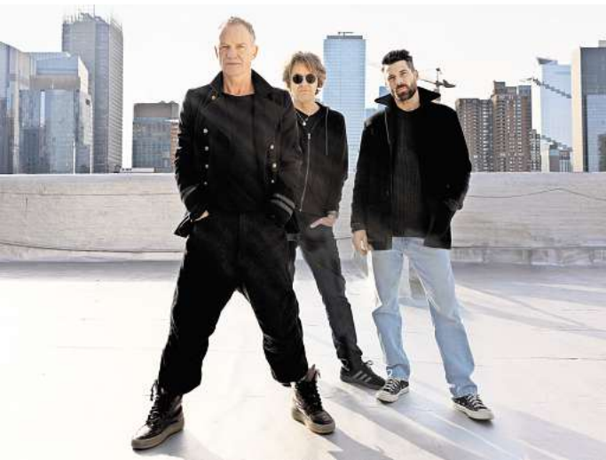
Sting will am 6. Juni die Plaza rocken.