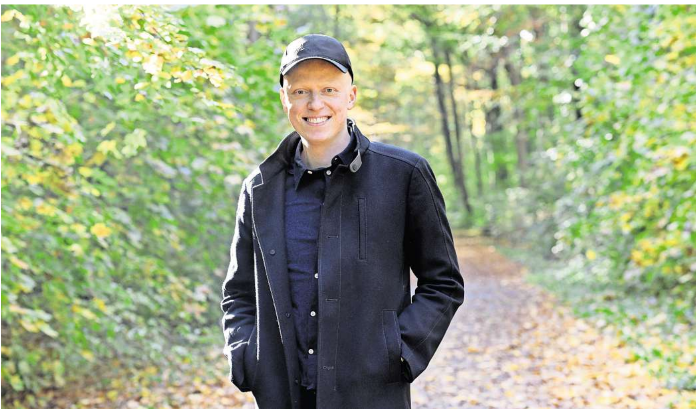
Strahlt mit der Sonne um die Wette: Hannovers SPD-Chef und Bundestagsabgeordneter Adis Ahmetović in der Eilenriede.

Der Hannoveraner verließ abrupt die Sitzung, setzte sich ins Auto. „Ich kam damit nicht klar. Es war wie ein Anschlag auf mein Leben.“ Unzählige Dinge gingen ihm durch den Kopf: Was mache ich jetzt? Wie sage ich es meiner Familie? Wie gehe ich beruflich damit um? „Politik ist ein brutales Geschäft und kann gnadenlos sein. Klar, wusste ich das vorher auch. Jetzt hatte es aber eine andere Bedeutsamkeit. Bis zu dem Zeitpunkt fühlte ich mich unverletzlich.“ Beruflich gesehen naheliegend: Ahmetović hatte es als Sohn bosnischer Flüchtlinge mit seiner politischen Karriere weit gebracht. Als Teenie tritt er in die