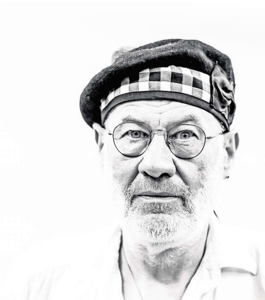
Fish spielt im Capitol.

magaScene: Du warst von 1981 bis 1988 sehr erfolgreich mit Marillion unterwegs und hast eigentlich alles erreicht, wovon junge Musiker nur träumen können. Genau auf dem Höhepunkt des Erfolges mit Ma-