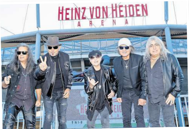
„Hometown“ ist das Motto für die Show zu der sich die Scorpions Pawel Maciwoda (von links), Rudolf Schenker, Klaus Meine, Matthias Jabs und Mikkey Dee auch unter anderem Judas Priest eingeladen haben.

Der Vorverkauf hat begonnen. Karten gibt es bei Eventim und den bekannten Vorverkaufsstellen. Tickets kosten zwischen 78,75 und 151,75 Euro.