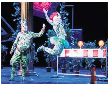
Sommernachts Traum in der Staatsoper.