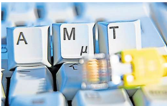
Der Gang zum Amt soll in den kommenden Jahren überflüssig werden.

haltung viel Geld in die Hand nehmen. Insgesamt rund 48 Millionen Euro sind vorgesehen, verteilt auf fünf Jahre. Von dem Geld sollen bis zu 35 neue Stellen finanziert werden, viele davon für Programmierer. Aber auch neue Soft- und Hardware leistet sich die Stadt, etwa aufwendige Scanner. Die Maschinen sollen in der Poststelle alle eingehenden Briefe digitalisieren. Bisher wurde der Schriftverkehr noch in Kästchen sortiert und dann mit dem Rathaus-Postauto zu den adressierten Behörden gefahren, die über das gesamte Stadtgebiet verteilt sind. Künftig soll die digitalisierte Post per Mausklick verschickt werden. Auch in die Abwehr von Cyber-Angriffen will die Stadt mehr Geld investieren.