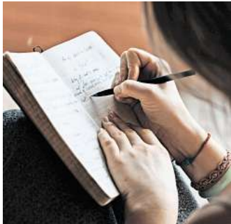
WortLaut: kreatives Schreiben, gemeinsames Lesen.