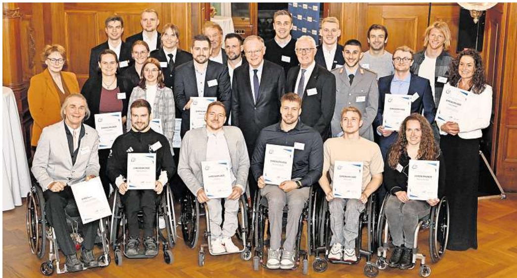
Gruppenbild mit Ministerpräsident: Niedersachsens Teilnehmerinnen und Teilnehmer der Olympischen und Paralympischen Spiele bei Stephan Weil im Gästehaus der Landesregierung.