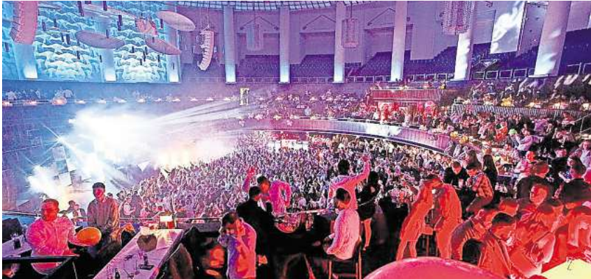
Silvester im HCC: Rund 4500 Menschen werden hier zusammen ins neue Jahr feiern.

Während der Jubiläums-Aktionstage können Sie kräftig sparen: Sie erhalten bis zu 25 % Aktionsrabatt und 10% Extra-Rabatt . Auch bei Küchen Stauder und im Design-Ableger Concept Store gibt es selbstverständlich besondere Angebote, beispielsweise bis zu 3.000 € Sonder-Rabatt beim Kauf einer Küche!