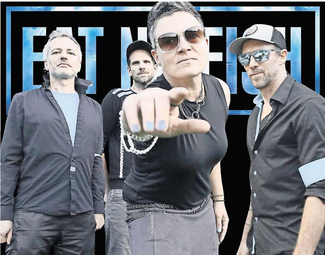
Eat No Fish entern nach über 20 Jahren wieder gemeinsam die Bühne.

Die magaScene gibt Konzerttipps: REUNION-SHOW AM 2. NOVEMBER im LUX