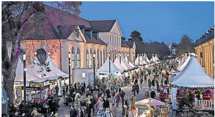
Ein erster Hauch von Weihnachten: Das Festival Winterzauber lädt zum Bummeln zwischen Orangerie und Galeriegebäude in Herrenhausen ein.

Im Freiland kann man hingegen Pilzarten wie Braunkapfen, Shiitake oder Austernseitlinge gut anziehen, so Baumbach. Die beimpften Strohballen oder Äste liegen beziehungsweise stehen am besten an einem schattigen Platz im Garten. Während der Anfangszeit sollten sie in Trockenzeiten gut feucht gehalten werden. Im Freien werden die Kulturen am besten im Frühsommer angesetzt. Holzstämme etwa werden dazu mit Myzel geimpft, erklärt Krämer. „Das Myzel zersetzt mit der Zeit die Hölzer, es bilden sich Fruchtkörper.“ Am wohlsten fühlen sie sich an einem schattigen, windgeschützten und möglichst feuchten Ort bei Temperaturen zwischen 15 und 25 Grad Celsius.