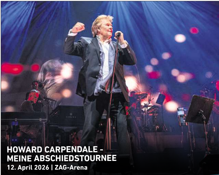
HOWARD CARPENDALE - MEINE ABSCHIEDSTOURNEE 12. April 2026 | ZAG-Arena