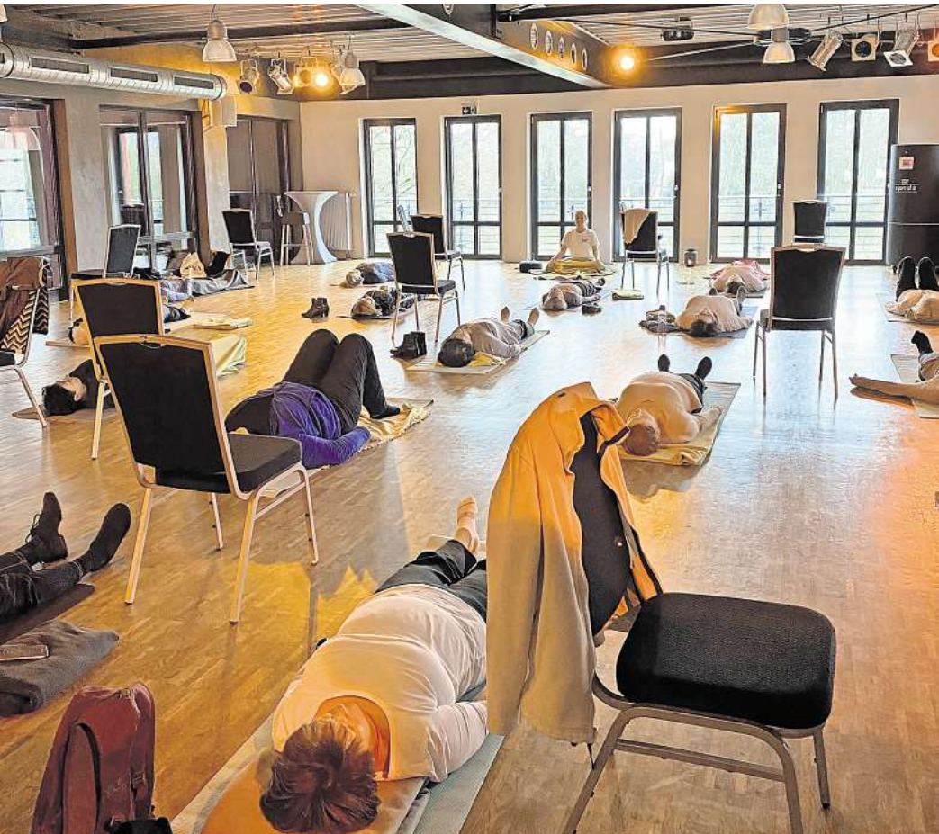
SenYoga – modernes Yoga für Menschen ab 60.

Für alle ab 60 bietet die Tanzschule Bothe auch SenYoga an – ein speziell entwickeltes Yoga-Programm. Die Übungen, die auf der Matte oder mit dem Stuhl durchgeführt werden, sind auf die Bedürfnisse der Teilneh-