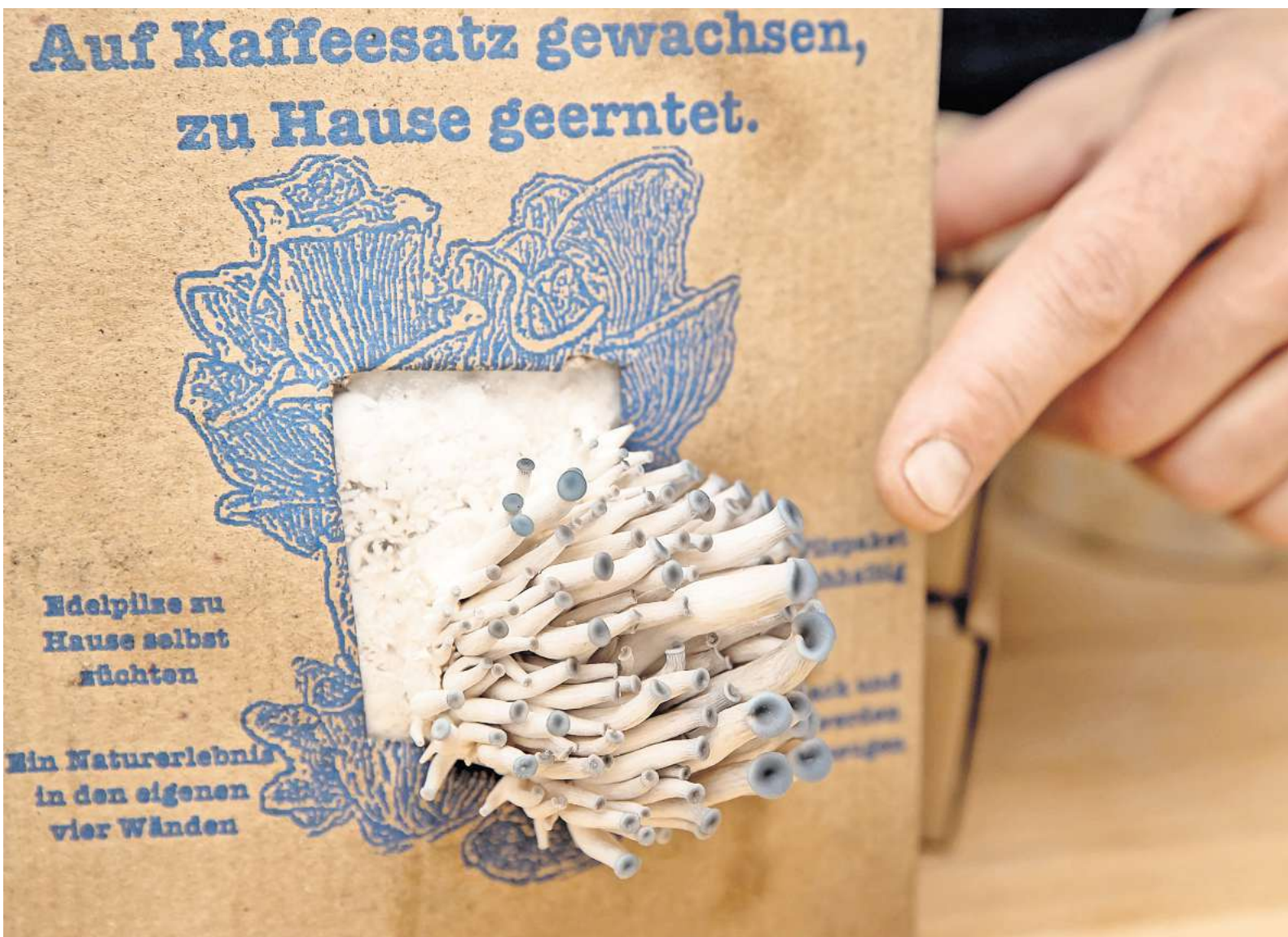
Austernpilze kann man beispielsweise auch auf dem Balkon mithilfe eines Pilzzuchtsatzes aufziehen.

Der Weihnachtsmarkt in der Altstadt beginnt am 25. November, dem Montag nach Totensonntag. Es warten der traditionelle Wunschbrunnenwald, das finnische Weihnachtsdorf und der Mittelaltermarkt auf die Besucher, die an 125 Ständen vorbeischnellern können. Der Weihnachtsmarkt rund um die Marktkirche dauert bis zum 22. Dezember, täglich von 11 bis 21 Uhr. Auch an der Lister Meile geht es vom 25. November bis 22. Dezember vorweihnachtlich in der Fußgängerzone zu, ebenfalls täglich geöffnet von 11 bis 21 Uhr.