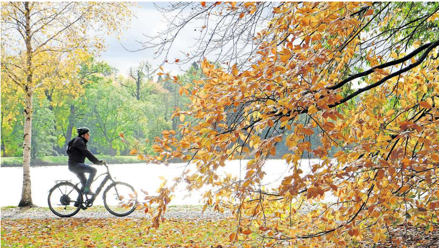
Der Herbst ist da: Mit dem Fahrrad lohnt es sich die nähere Umgebung in all seiner Schönheit zu erkunden.

Perfekt für Familien ist diese 20 Kilometer lange Fahrradtour der Stadt Hannover. Passend benannt: die Familientour. Sie beginnt am Bahnhof Isernhagen, zu dem die Regionalbahnen RE3 und RE2 fahren. Von dort radeln Familien zuerst zum Wietzpark, wo es Bademöglichkeiten und den PirateRock Hochseilgarten gibt. Es geht weiter an der