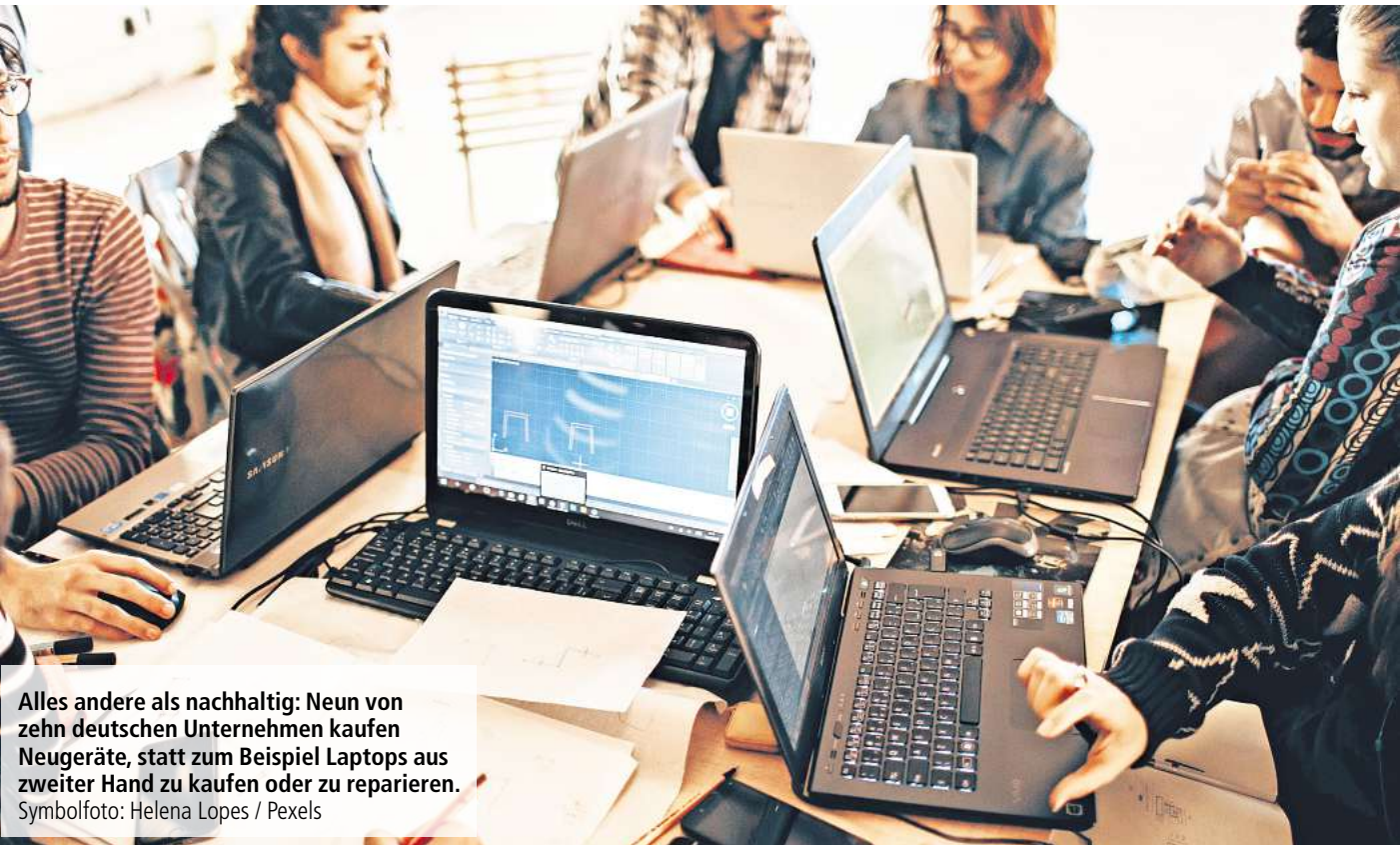
Alles andere als nachhaltig: Neun von zehn deutschen Unternehmen kaufen Neugeräte, statt zum Beispiel Laptops aus zweiter Hand zu kaufen oder zu reparieren.