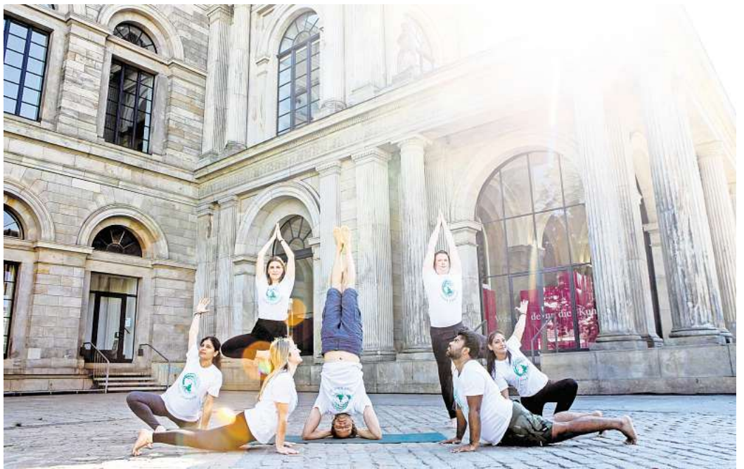
Aufwärmen: Die Yoga-Lehrer und -Schüler machen sich bereit für das Moksh Yoga Festival beim TKH in Kirchrode.

► https://www.roderbruch.de/shop/de/34-stadt-mit-keks