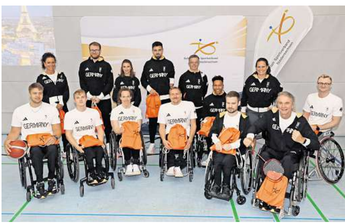
Greifen in Paris nach Medaillen: Niedersachsens Teilnehmer der Paralympischen Spiele wurden in Hannover verabschiedet.