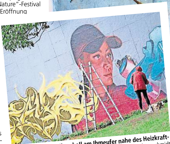
Die Wände an der Ihmehall am Ihmeufer nahe des Heizkraftwerks werden neu gestaltet.

Doch die Stadt wird nicht nur am Ihmeufer farbenfroher. Bereits seit dem 19. August verschönern Kunstschaffende für das Event „Hola Utopia!“ drei Fassaden in der Nordstadt und in