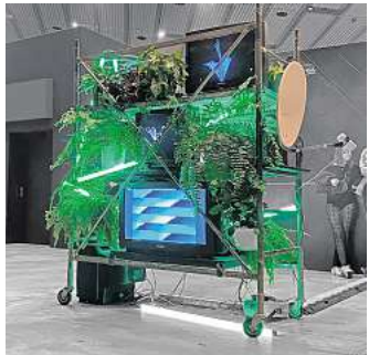
Tajny Projekt: „Transmission“.