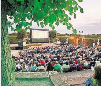
Kino unter freiem Himmel.

Am Sonnabend, 17. August, feiert „Bob Marley: One Love“ das Leben und die revolutionäre Musik der Reggae-Legende. Ab 20 Uhr gibt es Live-Musik, der Film läuft ab 21.30 Uhr. Von den Clubs in Camden zum Weltruhm, vom kometenhaften Aufstieg bis zum tiefen Absturz berührt die Biographie der Ausnahme-Sängerin und Musikerin Amy Winehouse in „Amy Winehouse: Back to Black“ am Sonntag, 18. August,