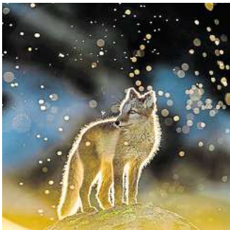
Foto-Beitrag von Arnfinn Johansen: Polarfuchs in einem Mückenschwarm. Foto: Arnfinn Johansen

HANNOVER. Der Verein Fotografie & Kommunikation präsentiert vom 3. August bis zum 10. Oktober die Fotoausstellung „GDT Europäischer Naturfotograf des Jahres 2021“ im Kunstgang der MHH, Carl-Neuberg-Straße 1. Präsentiert werden eindrucksvolle Fotos von Amateur- und Profifotografinnen und