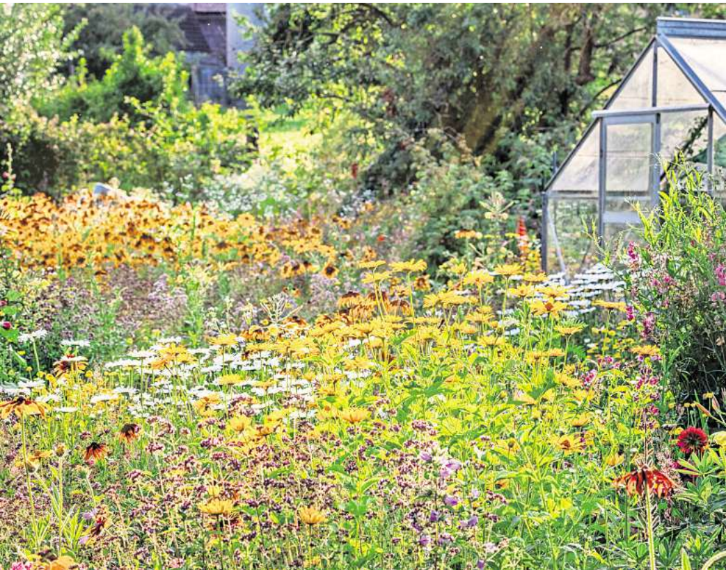
Prachtvoll: Von diesem Monat an dominieren Blumen in warmen Gelb- und Orangetönen.

Die beliebte Sommerfrucht legt die Blüten für das nächste Jahr schon ab September an. Daher wird sie im August mit den dafür nötigen Nährstoffen versorgt. Organische Beerendünger sind auf die Bedürfnisse der Erdbeeren abgestimmt und werden rund um die jeweilige Pflanze leicht in die Erde eingeharkt.