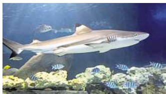
Im SEA LIFE Hannover erwartet die Besucher und Besucherinnen spektakuläre visuelle Erlebnisse in der Unterwasserwelt.

Limitierte Tickets nicht nur für das Sea Life Hannover sind beim Erlebnissommer der HAZ und NP unter www.erlebnissommer-tickets.de (zzgl. Gebühren und Versandkosten) zu bekommen. Hier warten auch Angebote mit bis zu 50 Prozent Rabatt beim Eintrittspreis von großartigen Attraktionen in Niedersachsen auf Sie. Alle Tickets sind auch in den Ticketshops und Geschäftsstellen der HAZ und NP erhältlich.