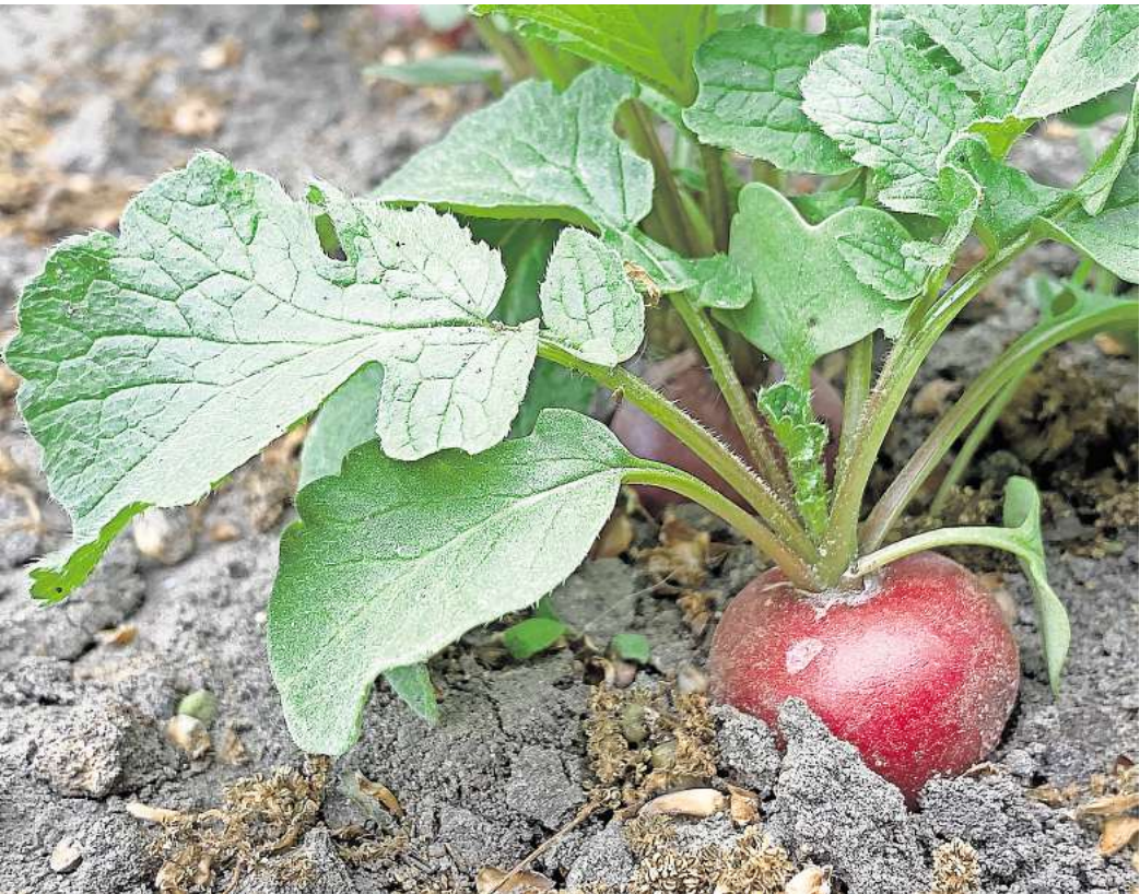
Radieschen brauchen kaum Platz und sind in ein paar Wochen erntereif.

Charmant sind Duft-Pelargonien allemal. Da sie noch selten im Handel angeboten werden, lohnt es sich, sie selbst zu vermehren: Dazu schneiden Sie einen sieben bis zehn Zentimeter langen Kopfsteckling und entfernen bis auf die oberen zwei Blattpaare alle unteren Blätter. Auch Blüten und Knospen werden – falls vorhanden – abgezwickt. Anschließend werden die Stecklinge in mit Anzuchterde gefüllte Töpfe gepflanzt und an einem vor praller Sonne geschützten Ort aufgestellt. Ein kleines Zimmergewächshaus