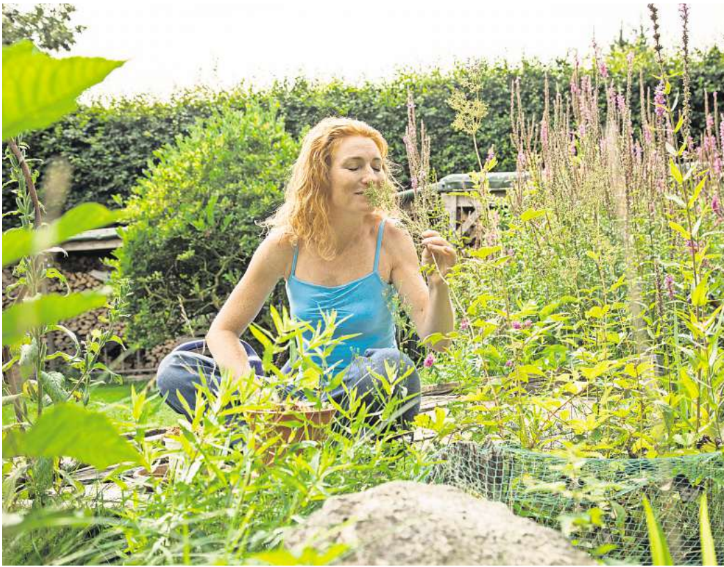
Mischkultur lautet das Zauberwort: Wo möglichst viele verschiedene Pflanzen wachsen, haben es Schädlinge schwerer.

Röde rät, die Beete etwas höher als den Rasen anzulegen und die Rasenfläche mit einem Höhenprofil anzulegen. So wird Wasser gesammelt, statt abzufließen. Schattige Bereiche helfen zusätzlich, den Wasserverbrauch zu senken und das Mikroklima durch mehr Luftfeuchtigkeit zu verbessern.