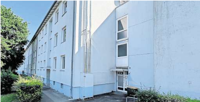
Auch diese 45 Wohnungen stehen seit Jahren leer: Wohnhäuser des kommunalen Wohnungsunternehmens Hanova in Hannover-Mittelfeld am Wülferoder Weg 1-9.

Bei beiden Anlagen wird erheblicher Modernisierungs- und Sanierungsbedarf als Grund angeführt. In beiden Fällen aber scheint die Abfolge gleich zu sein: Zunächst wurden die Wohnungen beim Auszug von Mietern über Jahre hinweg sukzessive nicht mehr neu vermietet.