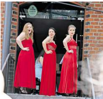
Klassik in der Altstadt am Alten Rathaus.