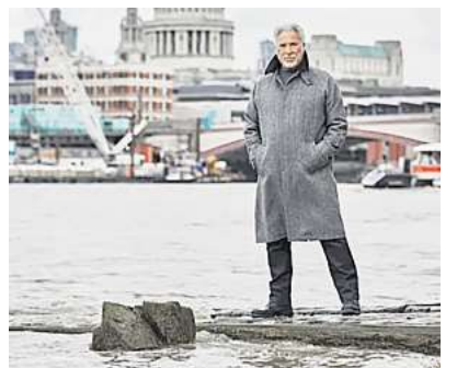
Tom Jones kommt nach Hannover. Näheres auf Seite 7.