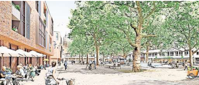
Ohne Parkplätze: So stellt sich die Stadt den Köbelinger Markt vor. Visualisierung: Stadt Hannover

Nach Informationen dieser Redaktion soll das ehemalige Amt bis Ende 2025 leer geräumt werden. Damit fiele auch der Startschuss für Abriss, Woh-