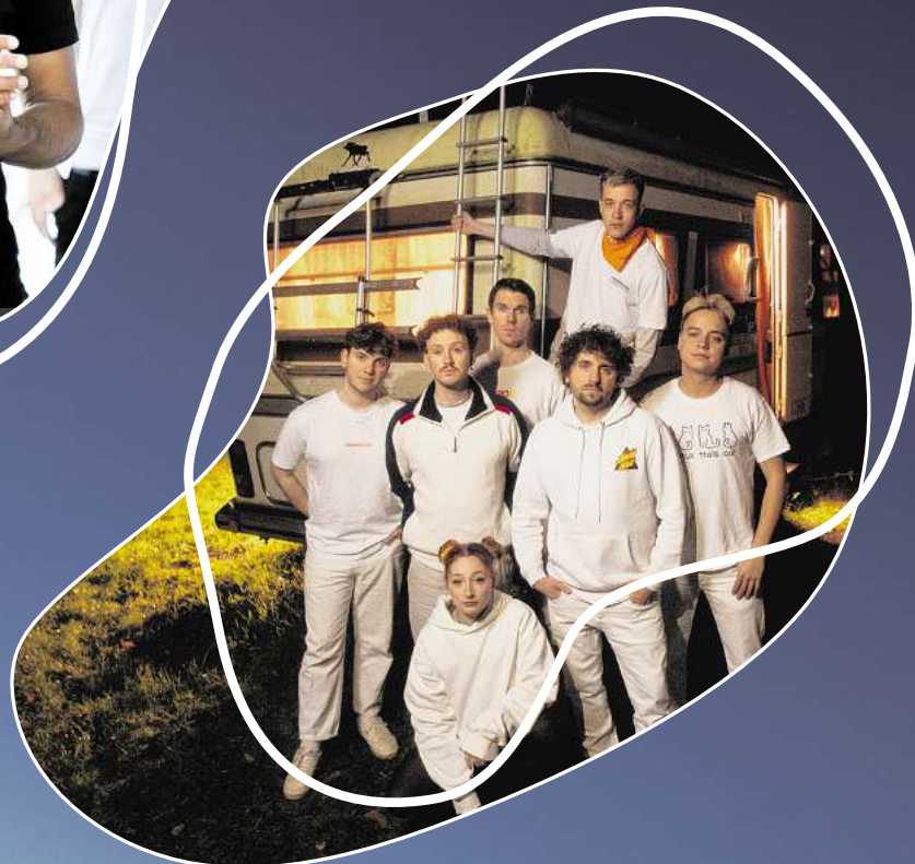
Sa, 10. August: Passepartout Hip-Hop mit deutsch- französischen Texten beim Tag der Vielfalt