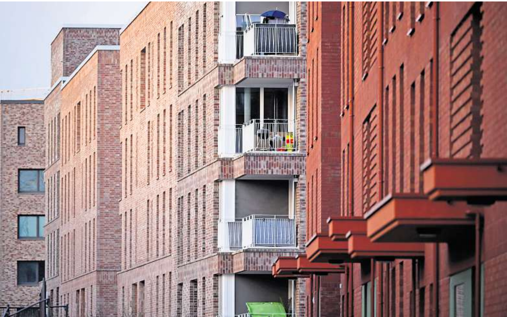
Hannover: Neu gebaute Mehrfamilienhäuser stehen im Neubaugebiet Kronsrode.

Im Detail sind die Zahlen derzeit etwas unsicher, weil erst in der Vorwoche bekannt wurde, dass Hannover laut jüngstem Zensus deutlich weniger Einwohnerinnen und Einwohner hat als bisher durch Datenfortschreibung angenommen. Die jetzt von den Länderstatistik-