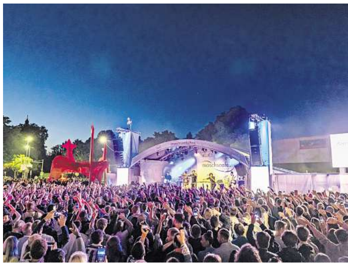
Volle Hütte: Die Veranstalter rechnen mit Hunderttausenden Besuchern zum Maschseefest.

Konzert von Malik Harris: Gleich am ersten Festwochenende können sich Besucherinnen und Besucher auf einen ersten Höhepunkt freuen. Der Rap-