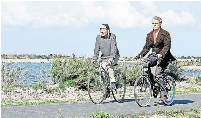
Das Cinema del Sol zeigt den Film „Molière auf dem Fahrrad“.

Schauspielkollege ist auf dem Höhepunkt seiner eigenen Karriere und möchte Serge für sein nächstes Projekt gewinnen. Der Eintritt ist frei, Spenden willkommen. Getränke und Snacks werden vor Ort verkauft. Eigene Sitzgelegenheiten wie Picknickdecke oder Stühle können mitgebracht werden. RHR