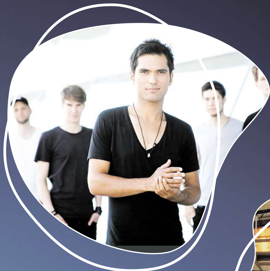
Mi, 31. Juli: The Jetlags Die beste Partyband Norddeutschlands eröffnet das Maschseefest