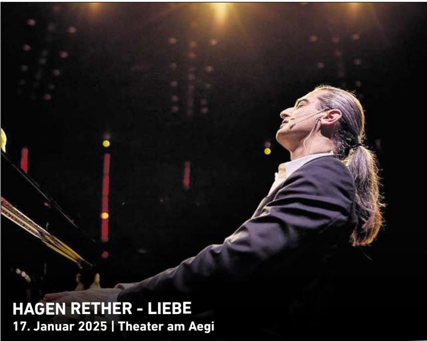
HAGEN RETHER - LIEBE 17. Januar 2025 | Theater am Aegi