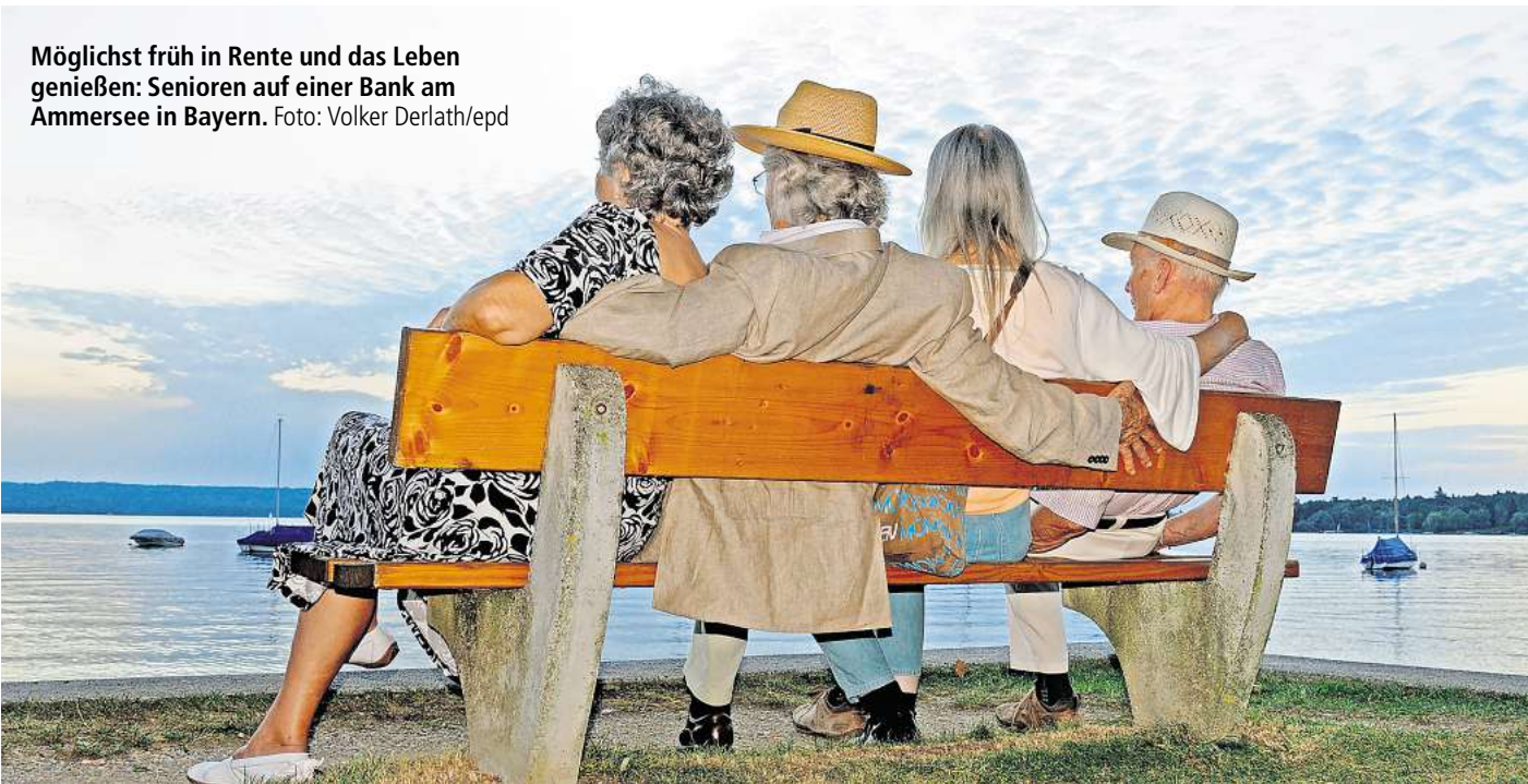
Möglichst früh in Rente und das Leben genießen: Senioren auf einer Bank am Ammersee in Bayern.

Demnach gaben 51 Prozent der befragten Nichtruheständler an, gern bis zum Alter zwischen 60 und 63 arbeiten zu wollen – aber nicht länger. 11 Prozent wollten bis maximal 60 Jahre arbeiten. Für ein Renteneintrittsalter von 64 bis 67 sprachen sich 27 Prozent aus. 3 Prozent dagegen gaben an, bis 68 und länger arbeiten zu wollen. So schätzten 53 Prozent der Erwerbstätigen unter 67 Jahren ein, dass sie unter ihren gegenwärtigen Arbeitsbedingungen eher nicht (31 Prozent) oder definitiv nicht (22 Prozent) bis zum 67. Lebensjahr arbeiten könnten. 44 Prozent könnten sich das vorstellen. Eine sehr deutliche Mehrheit (93 Prozent) der Befragten befand zudem, dass Beschäftigte nach 45 Jahren ohne Rentenabschläge in den Ruhestand