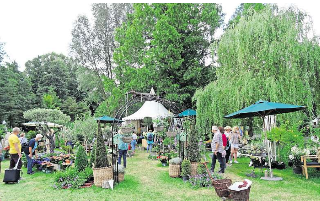
Das Gourmet & Garden Festival in Wienhausen ist ein Fest für die Sinne

dem Landgut Wienhausen, Mühlenstraße 8, bei Celle. Das Festival „Gourmet & Garden“ bietet zum bereits 19. Mal in märchenhafter Kulisse einen Tag voller Urlaubsgefühl.