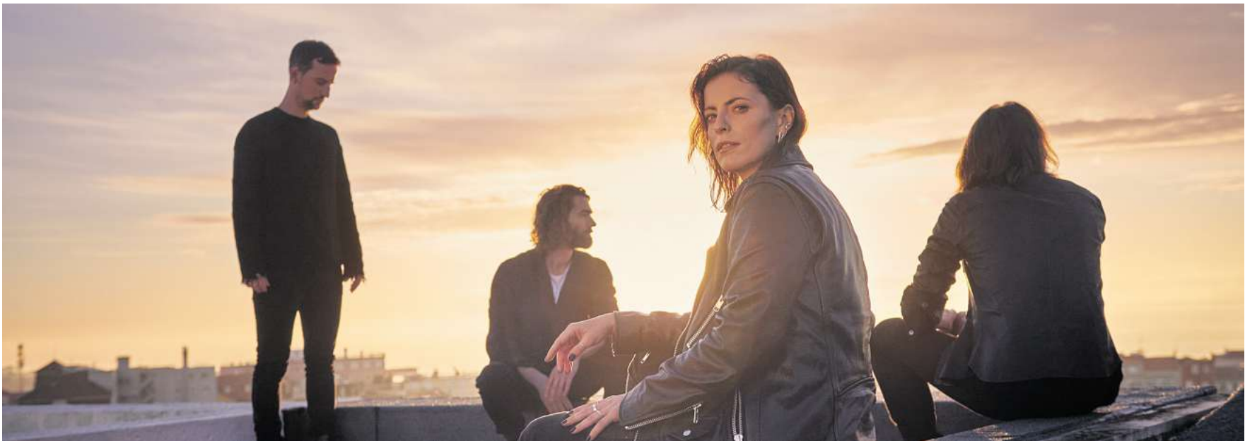
Silbermond spielen auf der Parkbühne

Kloß: Tatsächlich sind wir super-, supergerne in der Ecke unterwegs. Wir haben auch sehr viele gute Freunde in Braunschweig und, ja, ich weiß, das sollte man in Hannover nicht zu laut sagen. Aber dadurch haben wir einen wirklich starken Bezug zu der Region. Es macht einfach Spaß, in Hannover zu spielen. Das haben wir schon bei unserer ersten Tour getan. Es ist einfach schön, irgendwohin zu kommen, wo man das Gefühl hat, mit offenen Armen empfangen zu werden. Darum freuen wir uns sehr, dass Hannover wieder auf unserem Tourplan steht. Am 10. August spielt die Band Silbermond auf der Parkbühne. Karten gibt es an den bekannten VVK-Stellen.