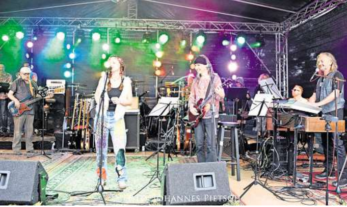
Summer of lovers