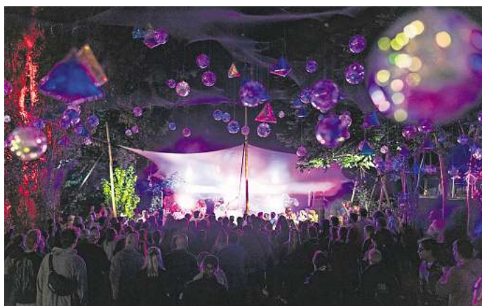
Das SNNTG Festival geht vom 26. bis zum 28. Juli.

val noch einen drauf und organisiert auf dem Gelände für ein Wochenende ein sehens- und hörenswertes Programm. Die Musikrichtungen Pop, Elektro, Hip-hop und Disco sind mit rund 40 Bands, DJs und anderen Künstlern vertreten und dürften damit fast jeden Musikgeschmack zufrieden stellen. Ganz wichtig bei diesem Event ist die wohl einzigartige Atmosphäre auf dem Festivalgelände. Wer hier schon einmal zu Gast war, der weiß wovon die Rede ist. Die geniale Mischung aus Kunst,