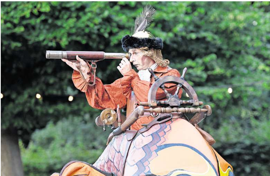
Connexion ist einer der Walkacts im Großen Garten.

Blaas of Glory Man kann sie kaum übersehen. Man kann sie vor allem kaum überhören: Der Hardrock-Spielmannszug Blaas of Glory interpretiert Klassiker wie Europas „Final countdown“ und „Wind of change“ von den Scorpions auf dem Instrumentarium einer Schützenkapelle. Gerade anfangs, wenn sie nach der Begrüßung des Publikums durch de Vries von der Picknickwiese aufs Gelände ziehen, lohnt es sich, ihnen bis zu ihrer Bühne 17 zu folgen. Die befindet sich direkt an der neuen, sehr hübschen Fontänenbar und damit mitten im Geschehen. Wer hingegen die aus den Vorjahren bekannten Wege beschreitet, schaut erst einmal vor allem auf sehr hübsche, aber auch sehr leere Beete – der vordere Teil des Gartens wird diesmal kaum bespielt. Desimos Spezial-Club Eine Alternative ist es, gleich bei der Picknickwiese zu bleiben. An deren Ende hat Detlef Simon alias Desimo – eines der wenigen bekannten Gesichter – mit seinem Spezial-Club sein Quartier (Bühne 12). Zweimal am Abend