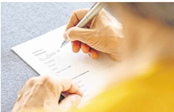
Eine Vorsorgevollmacht kann für alle Angelegenheiten oder auch nur für bestimmte Teilbereiche erteilt werden.

In Deutschland gilt der sogenannte Friedhofszwang, der vorschreibt, dass eine Beerdigung außerhalb eines Friedhofsgeländes nicht zulässig ist. Ausnahmen sind die Seebestattung oder die Naturbestattung in einem Wald. Die gängigsten Bestattungsarten sind die Erdbestattung, bei der der Verstorbene in einem Sarg begraben wird, und die Feuerbestattung, bei der der Körper eingeäschert wird.