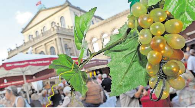
Der Opernplatz für vier Tage zum Treffpunkt für Weinliebhaber.

Probiert werden kann der neue Weinjahrgang am Donnerstag und Freitag jeweils von 16 bis 0 Uhr sowie am Sonnabend von 13 bis 0 Uhr und am Sonntag von 12 bis 20 Uhr.