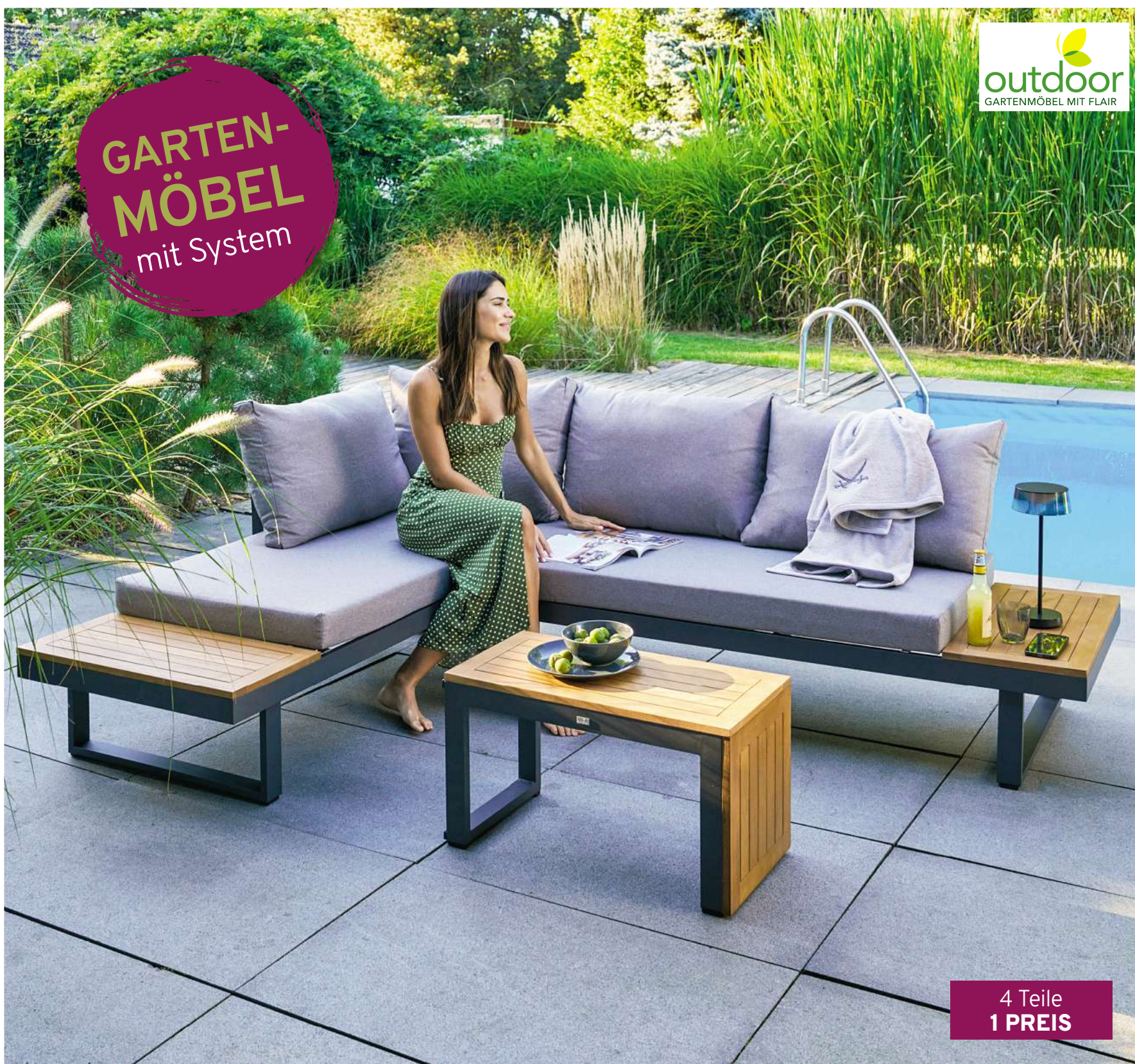
LOUNGE-SET , 2x Doppelsitzer-Sofa mit Beistelltisch BxHxT ca. 175x70x78 cm, 1x Couchtisch BxHxT ca. 70x40x40 cm. Inklusive Sitz- & Rückenkissen. 6901 0039 00 | Abholpreis

Entdecken Sie die größte Auswahl an Gartenmöbeln in der Region!