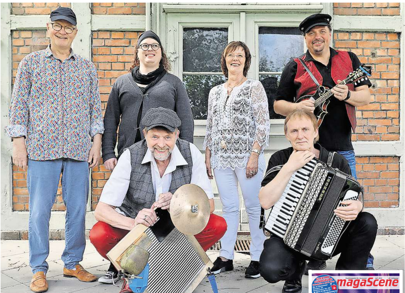
Die Sundown Skiffers eröffnen die Jazz Matineen am 7. Juli.