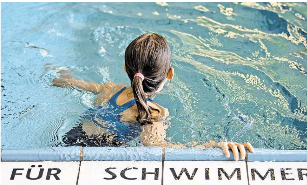
Stadt und Land bieten Ferienkurse für Kinder an: Wer einmal Schwimmen gelernt habe, sagt Niedersachsens Kultusministerin Julia Willie Hamburg (Grüne), verlerte es nie wieder.