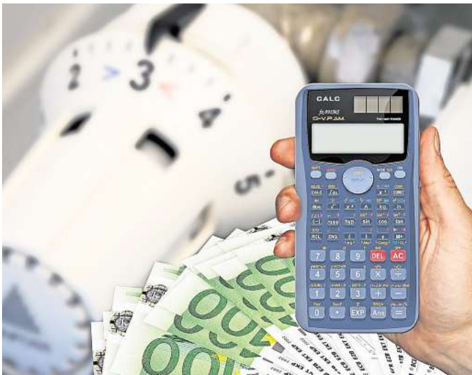
Bei der Heizkostenabrechnung für 2023 wird es für viele Haushalte zu hohen Nachzahlungen kommen.

einer Erhebung der Vergleichsplattform Check24 geht hervor, dass Gaskunden im Vergleich zum April 2021 aktuell 84 Prozent mehr zahlen. Etwas weniger heftig fiel die Steigerung beim Heizöl aus. Neben dem Ukraine-Krieg bringen die politisch gesetzten CO2-Preise Aufschläge: 2021 waren es 25 Euro pro Tonne Kohlendioxid, heute sind es 45 Euro. Rechnerisch sind damit die jährlichen CO2-Kosten in den drei Jahren von 108 auf 194 Euro gestiegen. Dieser Posten wird nach Check24-Berechnungen auf rund 280 Euro steigen, wenn die Bundesregierung wie geplant die CO2-Preise erhöht. Beim Heizöl würde dieser Posten im Musterhaushalt von derzeit 287 Euro sogar auf 414 Euro steigen.