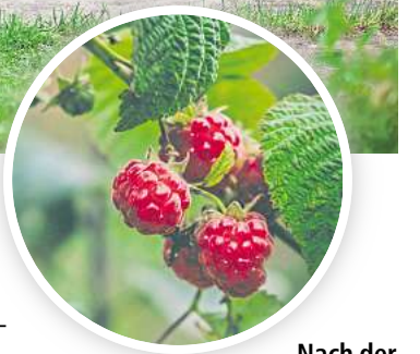
Nach der Himbeer-Ernte sollte man sich ans Zurückschneiden machen.

Sie werden im nächsten Jahr Früchte liefern. Wenn auch nach diesem Rückschnitt noch mehr als sieben bis acht Pflanzen pro Meter übrig bleiben, lichten Sie die Himbeeren etwas aus und entfernen sie überzählige Pflanzen. Die einzelnen Triebe, die