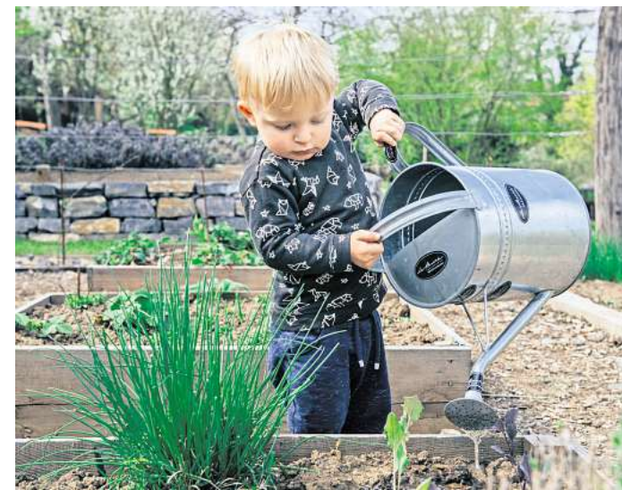
Die beste Zeit zum Gießen ist morgens.

Und noch ein Tipp, der Wasser und Arbeit – nämlich Rasenmähen – spart: Bleibt der Rasen etwas länger, wird Wasser besser gespeichert und verdunstet nicht so schnell. Hat man einen elektrischen Rasenmäher, spart man durch das seltener Mähen zusätzlich noch Energie.