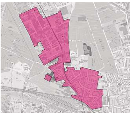
Glasfaser-Ausbaugebiet der Telekom in Hannover Hainholz

*Die Aktion gilt bis 30.09.2024 für Breitband-Neukunden, die in den letzten 3 Monaten keinen Breitbandanschluss bei der Telekom hatten. Glasfaser 300 kostet in den ersten 6 Monaten 19,95 €/Monat. Danach kostet Glasfaser 300 49,95 €/Monat. Bei Miete eines Routers im Endgeräte-Service-Paket (i. H. v. 7,95 €/Monat) erfolgt eine Router-Gutschrift i. H. v. 70 €. Hardware zzgl. 6,95 € Versandkosten. Der einmalige Bereitstellungspreis für einen neuen Telefonanschluss beträgt 69,95 €. Die Mindestvertragslaufzeit für Glasfaser 300 beträgt 24 Monate, für Hardware jeweils 12 Monate. Für die Bereitstellung von Glasfaser 300 ist ein Glasfaser-Hausanschluss erforderlich. Sofern noch nicht vorhanden, wird dieser bei einer verbindlichen Buchung des Tarifs Glasfaser 300 kostenfrei neu verlegt, vorausgesetzt, die Anschlussadresse für den Tarif ist mit der Adresse des mit Glasfaser anzuschließenden Gebäudes identisch. Die Bereitstellung erfolgt, wenn Hauseigentümer/Hausverwaltung dem Ausbau zustimmen und die finale Prüfung den Ausbau bestätigt. Durch Eingabe einer Adresse auf der Internetseite telekom.de/glasfaser kann geprüft werden, ob diese in einem Glasfaser-Ausbaugebiet der Deutschen Telekom liegt. 11.11.2021_000024