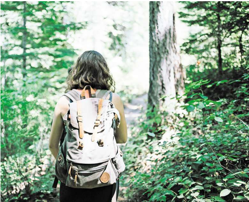
In der Natur gibt es viel zu entdecken. Geführte Touren rund um das grüne Hannover vermitteln dabei Unterhaltsames und Wissenswertes.

► Eine Entdeckungsreise mit Schatzsuche wartet am Montag,