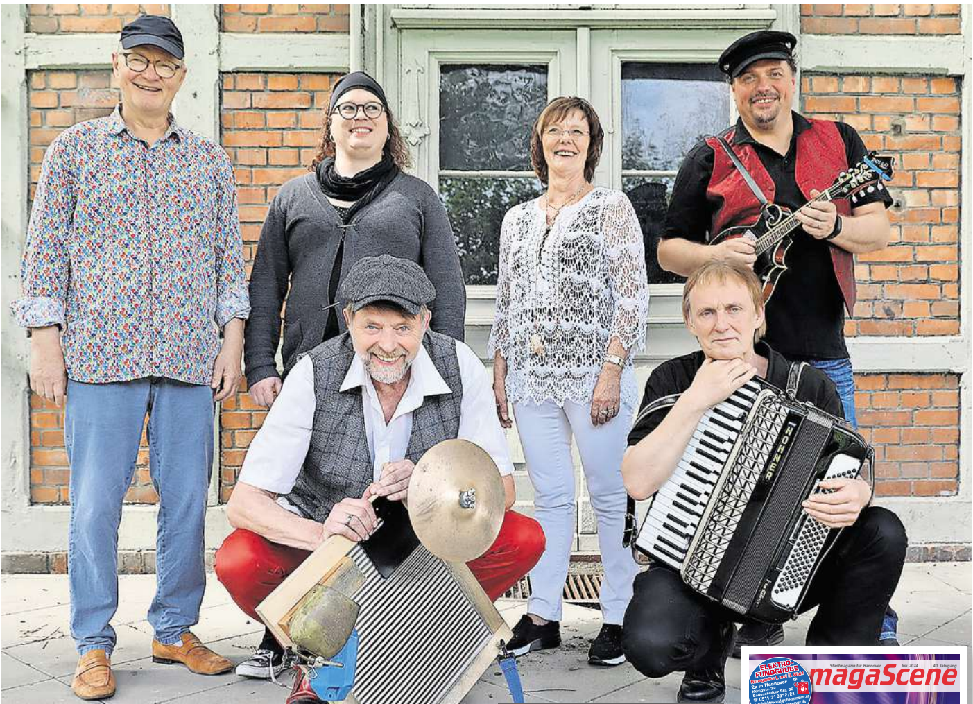
Die Sundown Skiffers eröffnen die Jazz Matineen am 7. Juli.

Im August geht es am 4.8. weiter mit der Old Metropolitan Band & Ela Kulpa aus Polen. Die 1968 in Krakau gegründete Band spielt Standards des traditionellen Jazz und eigene Kompositionen und konnte schon mehrfach bei den Jazz Matineen das Publikum begeistern. Da an diesem Sonntag rund um den Marktplatz die Blaulichtmeile Langenhagen stattfindet, wird es ausnahmsweise ab 15 Uhr noch eine zweite Live-Band auf der Bühne im Innenhof des Rathauses geben. Die Hannoveraner von Frisco Five übernehmen diesen Part und spielen Klassiker aus Jazz und Swing. Der nächste Sonntagvormittag, also der 11.8., gehört dann ganz The Sazerac Swingers & Emily Rault. „Die Tanzfläche ist eröffnet“ – mit diesen Worten starten The Sazerac Swingers in jedes Konzert. Sie zeigen sofort, worum es ihnen geht: „Put the Jazz back in Jazz“ war nicht nur der Titel eines ihrer Alben; es ist ihre Mission, Jazzmusik zu ihren Wurzeln zurückzuführen, als Jazz noch reine Tanz- und Partymusik war. Exzessive Jazzparties mit dem Publikum sind das erklärte Ziel. Eine weitere Partyband steht am 18.8. auf der Bühne. Brazzo Brazzone & The World Brass Ensemble aus Hannover sind ebenfalls bekannt für brodelnde Partystimmung bei ihren Auftritten. Das Abschlusskonzert der diesjährigen Jazzmatineen bestreiten dann am 25.8. die Jazz Connection & Angela van Rijthoven aus Breda. Das Ensemble gilt als Nummer 1 Jumpin' Jive Band der Niederlande und wird für einen würdigen Ausklang sorgen.