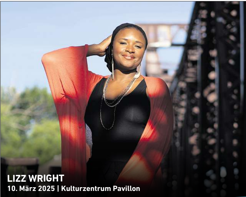
LIZZ WRIGHT 10. März 2025 | Kulturzentrum Pavillon

HANNOVER. Party, Pöbel und Parolen: Nickes und Boh aus Hannover liefern ein Rap-Brett zum Mitgröhlen am Sonnabend, 6. Juli, ab 20 Uhr im Kulturpalast, Deisterstraße 24. „Am Block“ steht in den Startlöchern und möchte gefeiert werden – das zweite Album der Crew beflügelt durch Boombap Sound gemischt mit Up-Tempo Songs. Der Eintritt kostet an der Abendkasse 12 Euro. RED