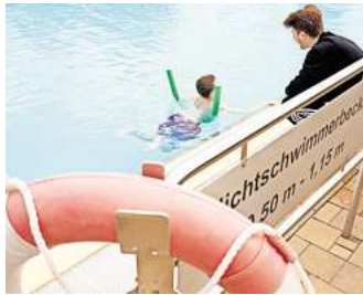
Einzeltraining: Für Kinder ohne Wassererfahrung nehmen sich die Trainer besonders viel Zeit.

Kinder lernen schnell in einem solchen Schwimmkursus, wenn Eltern ihren Nachwuchs früh an Wasser gewöhnen, mit ihnen