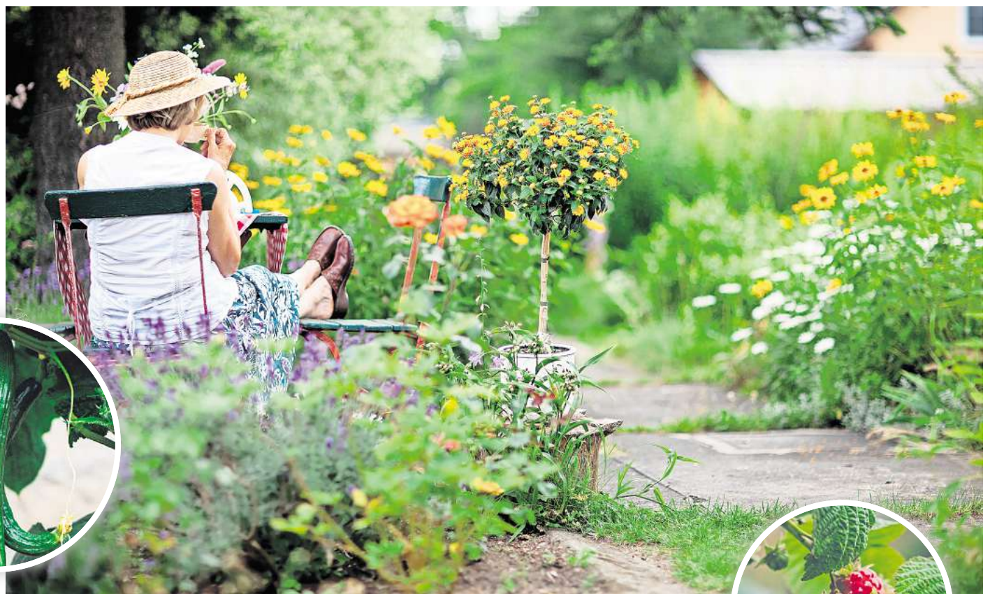
Schattenplätzchen gesucht: An warmen Juli-Tagen sollte man tagsüber lieber den Platz unter Bäumen genießen.

Bienenweide. Zur Blütezeit ist meist ein Brummen und Summen rund um die Pflanze zu hören. Ist der Steppen-Salbei verblüht, lohnt sich ein beherzter Griff zur Schere. Das radikal anmutende Einkürzen der Pflanze auf rund eine Handbreite über den Boden belohnt die Pflanze mit einer Nachblüte im Spätsommer. Wer noch keinen Steppen-Salbei im Garten hat und ihm einen vollsonnigen Standort