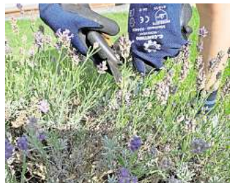
Zur Ernte die ganzen Stiele des Lavendel abschneiden.

Falls Sie die Sommerfrische woanders suchen und verreisen, könnten Sie durstige Topfpflanzen an einen schattigeren Ort