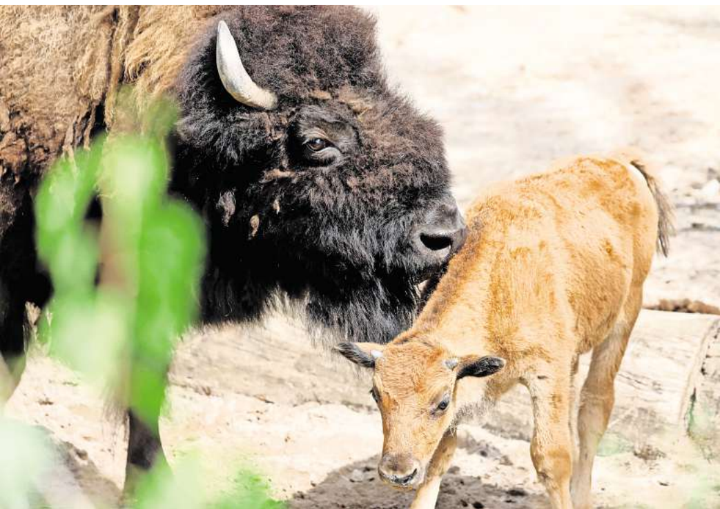
Waldbison mit blondem Fell: In den kommenden Monaten wird sich die Farbe des jungen Männchens der seiner älteren Artgenossen angleichen.

Mit seinem goldbraunen Fell ist der kleine Bulle ein echter Hingucker in der Herde und immer gut zu erkennen. In den kommenden Monaten wird sich das Fellkleid allerdings genauso dunkelbraun verfärben, wie das der erwachsenen Waldbisons. Und auch an Größe und Gewicht wird das Kalb ordentlich zulegen: Brachte es bei der Geburt ungefähr 20 Kilogramm auf die Waage, wird es als ausgewachsener Waldbison-Bulle bis zu einer Tonne schwer werden. Dagegen sind die kleinen Prärie-