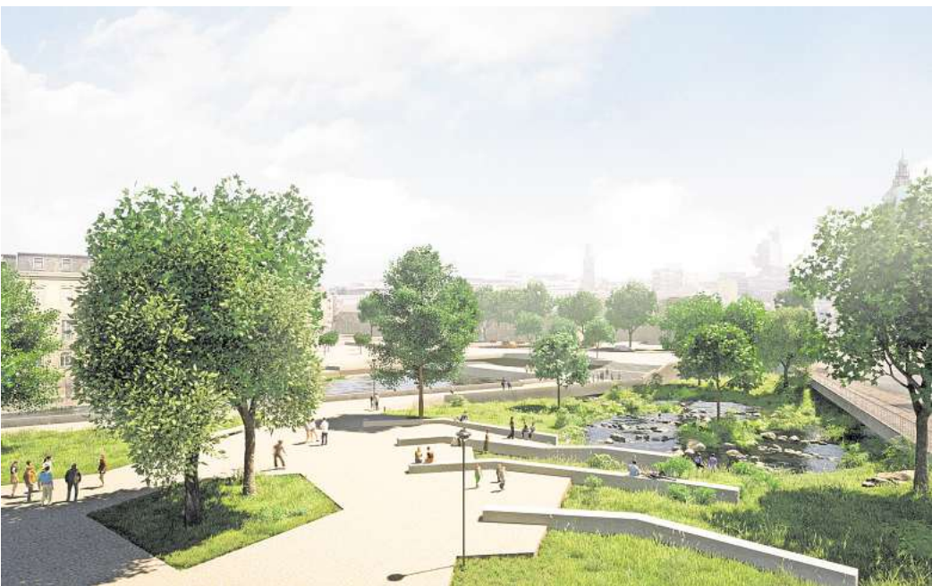
Neue Perspektiven: So könnte das Leibnizufer nach einer Umgestaltung mit einer ökologischen Fisch-treppe aussehen. Visualisierung: Cityförster

Grüne, Volt und Piraten können sich grundsätzlich mit den Leinepark-Plänen anfreunden. Sie wollen aber, dass das Gutachten der Stadt auch die Calenberger Neustadt mit einbezieht. Ziel der Grünen-Fraktion ist es, das Wohnquartier näher an die Altstadt zu rücken. Das aber ging SPD, CDU und FDP in dieser frühen Planungsphase zu weit, dieser Antrag wurde abgelehnt.