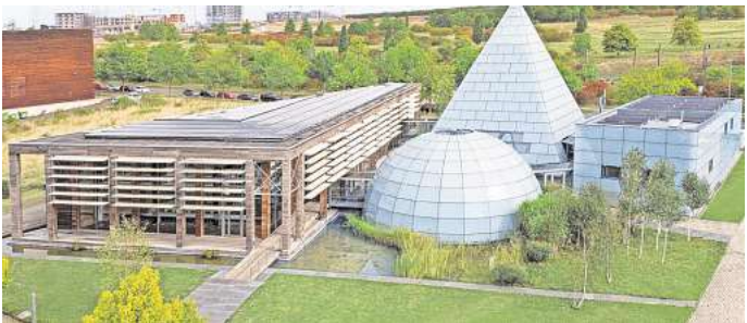
Inzwischen ein Energie-Plus-Haus: Der umgebaute Pavillon von Dänemark im Expo-Park Hannover.

Im Sommer wird die gewonnene Sonnenwärme vom Dach seines Büros in die Grundwasserblase zurückgeleitet, aus der er im Winter die Heizwärme gewinnt. So bleibt das Grundwasser auf Temperatur. Der Pavillon ist, obwohl er zusätzlich acht Ladesäulen für Stromaautos speist, bilanziell ein Energie-Plus-Haus. Dieses erzeugt mehr Energie als mit ihm verbraucht wird. „Langfristig müssen wir zu solchen Lösungen kommen, wenn wir unsere Klima- und Energieprobleme bewältigen wollen“, sagt Grobe.