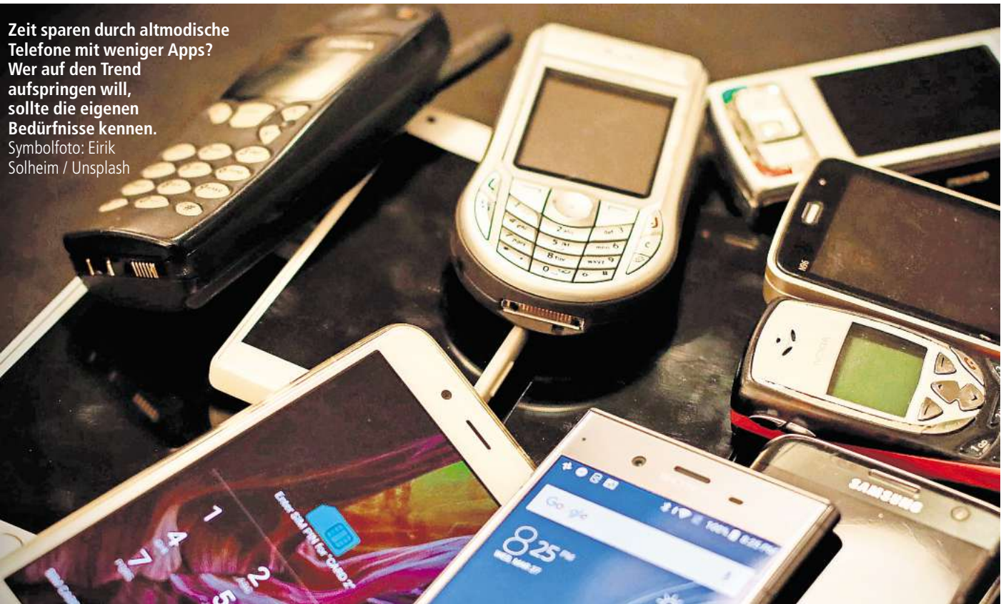
Zeit sparen durch altmodische Telefone mit weniger Apps? Wer auf den Trend aufspringen will, sollte die eigenen Bedürfnisse kennen.

Irgendwann macht der Akku schlapp, außerdem droht die Abschaltung alter Funknormen. Doch überraschend viele Menschen haben noch funktionierende Handys von früher in der Schublade. Solange sie noch funktionieren, sind sie der ideale erste Schritt weg vom Smartphone. Mit den alten Geräten lässt sich herausfinden, ob der Smartphone-Entzug realistisch ist.