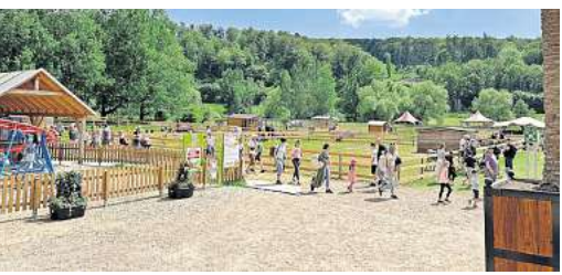
Charles Knies Circus-Land ist längst kein Geheimtipp mehr.

Das Circus-Land ist bis 31. August in der Regel Dienstag bis Sonntag von 10 bis 18 Uhr und im September an den Wochenenden geöffnet. Alle Infos zu Öffnungstagen und Ticketverkauf gibt es unter www.circus-land.de und unter der Hotline 0171 / 946 24 56.