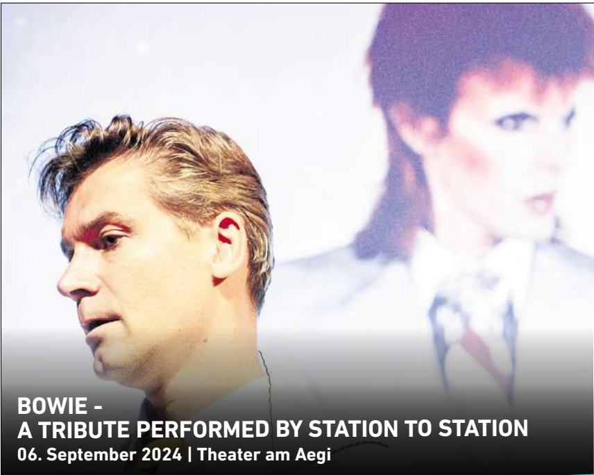
BOWIE - A TRIBUTE PERFORMED BY STATION TO STATION 06. September 2024 | Theater am Aegi