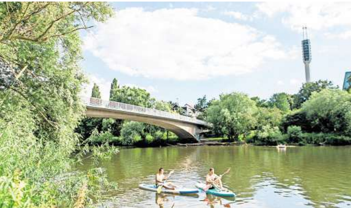
Bleibt erstmalig: Die Stadt Hannover hat die Ausschreibung für den Neubau der Dornröschenbrücke verschoben.

Neubau von 6 auf 11,5 Millionen Euro. Grund dafür sei, dass der Abriss der alten Brücke sowie das Verschieben der neuen Konstruktion auf die Fundamente der alten Brücke deutlich komplizierter – und damit teurer – als geplant werde, so die Stadt damals. Ein weiterer Kostentreiber war die Breite der Brücke. Die städtischen Planer wollten das Bauwerk von derzeit acht Metern auf elf Meter erweitern. Fünf Meter sollten für den Radverkehr zur Verfügung stehen. Zudem sollte das Tragwerk in der Mitte als lang gezogene Sitzgelegenheit genutzt werden können. Der lang gezogene Block sollte auch dazu dienen, Rad- und Fußverkehr klar voneinander zu trennen.