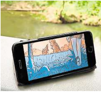
Unfollow now: Wanderung, Hörspiel-Animations-Theater und Graphic Novel.

paket. Das künstlerische Material darin begleitet die Wandernden über ihr eigenes Smartphone. Neben einem Hörspiel und Animationen der Graphic Novel bietet es viele philosophische bis biologische Anregungen und Gedankenströme, sich mit der Erde und dem Einfluss des Menschen zu befassen. Denn darum geht es in Jüligers „Unfollow“: Ein siebenjähriger Junge mit Erinnerungen an die Entstehung der Erde