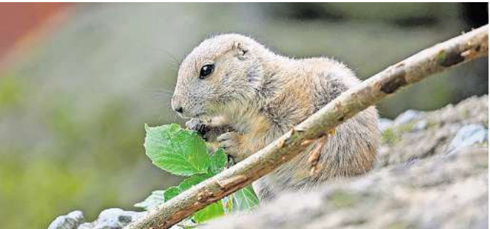
Die kleinen Präriehunde probieren schon festes Futter wie Äste.

Will man die Jungtiere besuchen, sollte man allerdings nicht zu früh vorbeikommen. Denn die kleinen Präriehunde sind echte Langschläfer und bleiben morgens gerne etwas länger in ihrem Bau.