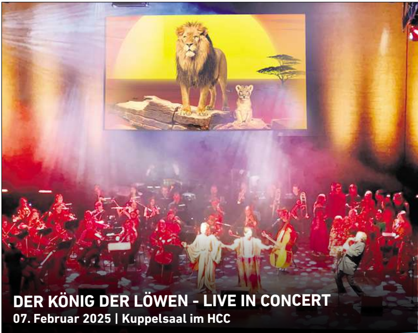
DER KÖNIG DER LÖWEN - LIVE IN CONCERT 07. Februar 2025 | Kuppelsaal im HCC

Ihr persönlicher Ticketservice der HAZ & NP