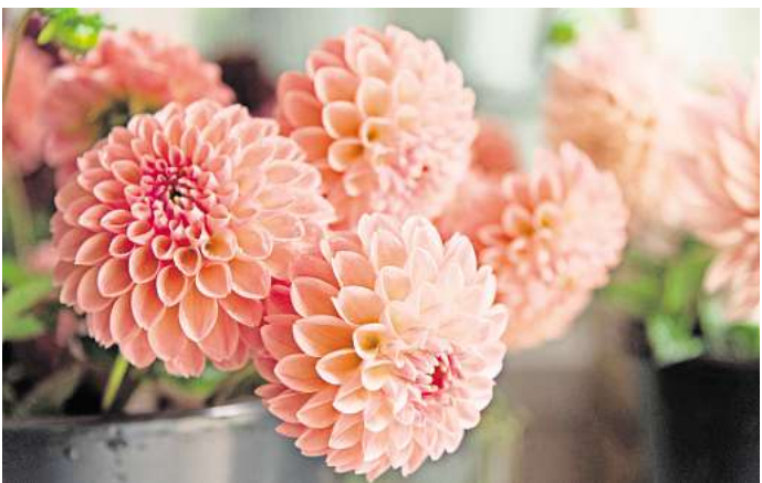
Auch in der Vase sind Dahlien ein Blickfang.

mag die Dahlie keine kalten Winter. Nach dem ersten Frost, wenn sich das Laub schwarz verfärbt, sollten die Pflanzen daher auf etwa zehn Zentimeter zurückgeschnitten und die Knollen vorsichtig ausgegraben werden. Wenn die Knollen an der Luft getrocknet sind, können sie in einem kühlen, frostfreien und trockenen Raum überwintern. Ideal wäre eine Holzkiste im Keller, in der die Knollen, umwickelt in Zeitungspapier, gelagert werden.