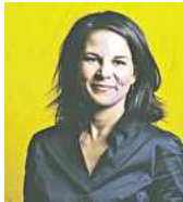
Bundesministerin Annalena Baerbock kommt nach Hannover.