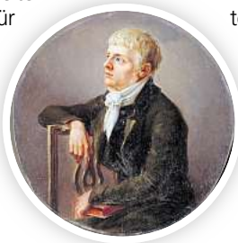
Caspar David Friedrich gilt als der bedeutendste Maler der deutschen Romantik.

HANNOVER. Anlässlich des 250. Geburtstags von Caspar David Friedrich präsentiert das Landesmuseum Hannover eine Kabinettausstellung mit sechs Gemälden. Geboren am 5. September 1774 in Greifswald, wurde der Sohn eines Kerzenziehers und Seifensieders zum bedeutendsten Maler der deutschen Romantik. Seine von Melancholie geprägten Bilder mit einzigartigen Lichtstimmungen gelten als exemplarisch für diese Epoche. In vielen seiner Werke finden sich die typischen Allegorien von Leben und Tod, Vergänglichkeit und Einsamkeit.