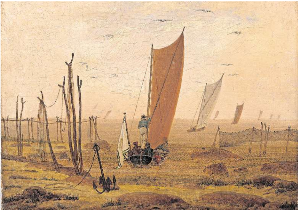
Caspar David Friedrich, Morgen (Ausfahrende Boote), um 1818. Öl auf Leinwand.