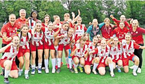
Da können sie wieder lachen: Die B-Juniorinnen des VfL Eintracht Hannover nach der Siegerehrung.