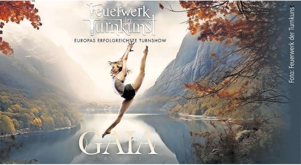
Foto: Feuerwerk der Turnkunst