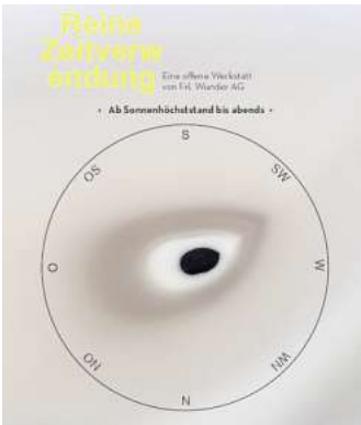
Ab Sonnenhöchststand bis abends: Zeit neu verwendet.

Georgsplatz an. Unterteilt ist das Programm jeweils in die „durchgehende Zeitvergoldung“, die – offen für alle und ohne Anmeldung – jeweils bei Sonnenhöchststand beginnt. Am 22. Juni ist das ab 13.23 Uhr, an den darauffolgenden Tagen zwischen 13.23 und 13.25 Uhr. Beendet wird die offene Werkstatt jeweils zwi-