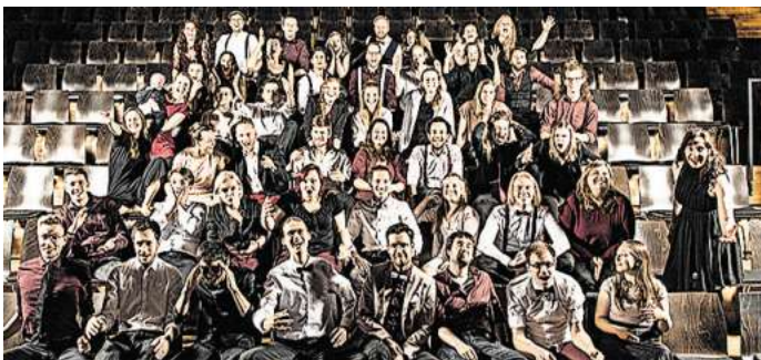
Der Chor VividVoices lädt zum Abschlusskonzert der Chortage ein.