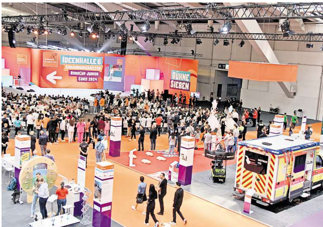
Die Johanniter lockten die jungen Besucher mit mehreren Mitmach-Aktionen und Exponaten an ihren Stand.

Donald: Seit wir 2005 wieder zusammengefunden haben, ist unsere Beziehung immer stärker und immer besser geworden. Ich kann mir auch überhaupt nicht vorstellen, dass es jemals wieder bergab gehen wird. Eher im Gegenteil. Barlow: Wir kennen uns in- und auswendig. Trotzdem lernen wir uns ein klein wenig auch immer wieder neu kennen. Wir sind eingespielt, aber nicht zu routiniert. Was wir zusammen haben, ist einfach eine wunderbare Freundschaft.