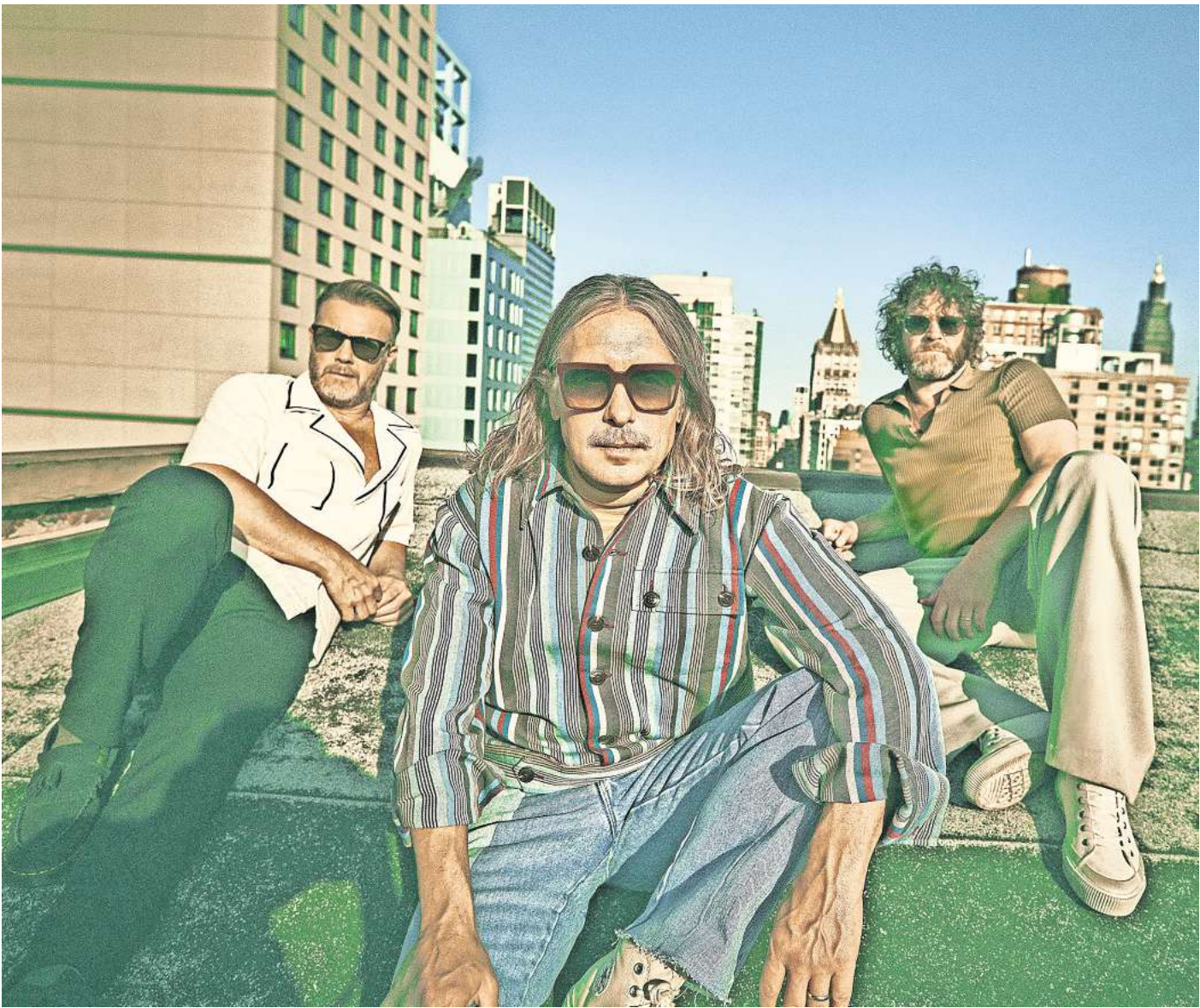
Am 25. Juni live in Hannover: (von links) Gary Barlow, Mark Owen und Howard Donald sind Take That.

Howard Donald: Oh ja. Und es tut gut zu wissen, dass die Menschen überall auf der Welt, in allen Berufen, allen Kulturen, allen Altersschichten, dieselben Dinge durchmachen, die wir selbst durchmachen. Mental Health