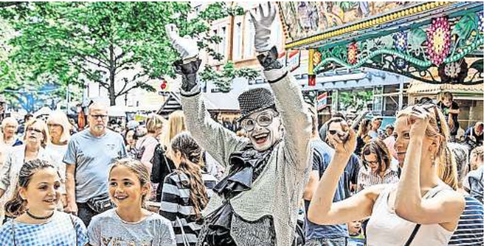
Findet 2024 wieder statt: Das Lister-Meile-Fest in Hannover.

gangen. „Es freuen sich alle darauf“, so Fumiento. Bereits in den vergangenen vier Jahren konnte auf der Lister Meile nicht gefeiert werden: 2020, 2021 und 2022 war der Grund jeweils die Corona-Pandemie mit ihren Folgen. Zum 50. Geburtstag der Lister Meile gab es immerhin einen verkaufsoffenen Sonntag im September 2022. Auch 2023 musste die beliebte Veranstaltung ausfallen. Viele Sponsoren konnten die Organisatoren der Veranstaltung nicht so unterstützen, wie sie es gerne getan hätten und in der Vergangenheit immer getan haben. Doch ohne diese Einnahmen sei die Organisation und Durchführung in gewohnter Quantität und Qualität unmöglich für den Verein Aktion Lister Meile gewesen.