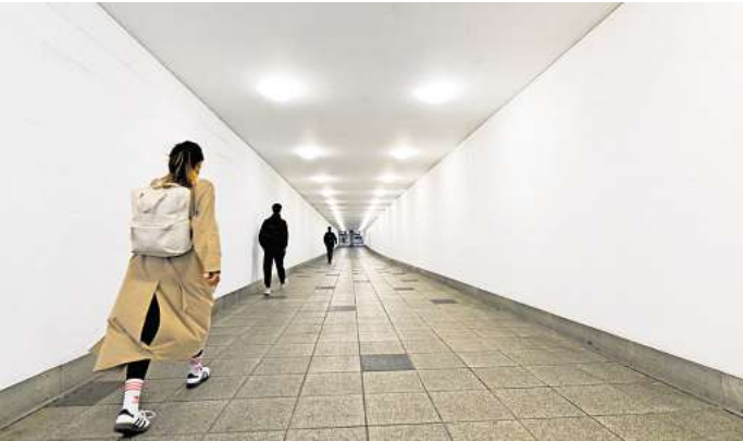
Idee aus dem Rathaus: Hinter den Wänden des Raschplatztunnels befinden sich Räume, die jungen Kreativen aus der Stadt für ihre Arbeit zur Verfügung gestellt werden sollen.

Potenzial der ehemaligen Ladenflächen am Raschplatz nicht sinnvoll genutzt werden kann“, sagt SPD-Kulturpolitikerin Bel-