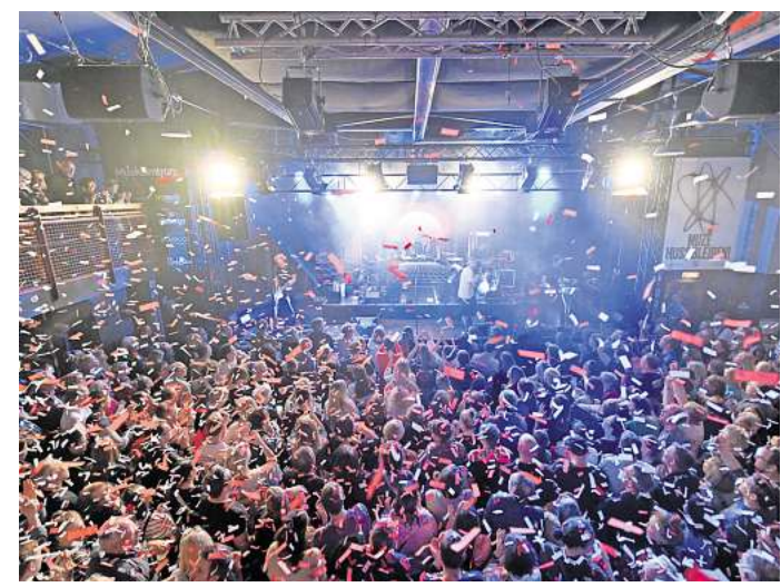
Das Musikzentrum bleibt für Konzerte bestehen.