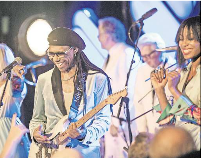
Nile Rodgers gastiert mit Chic auf der Gilde Parkbühne.

Am Sonntag, 30. Juni, ab 20 Uhr, gastiert Nile Rodgers mit Chic auf der Gilde Parkbühne. Tickets gibt es ab 71,25 Euro plus Gebühren an den bekannten VVK-Stellen sowie unter www.hannover-concerts.de oder www.myticket.de