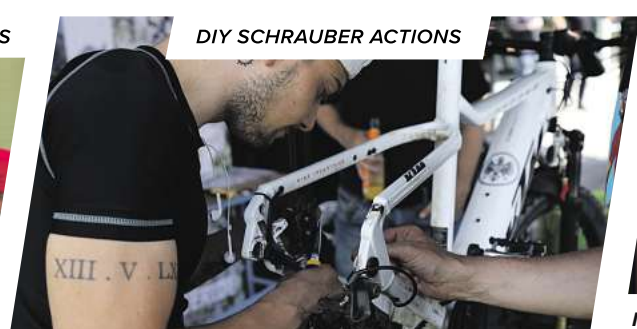
DIY SCHRAUBER ACTIONS