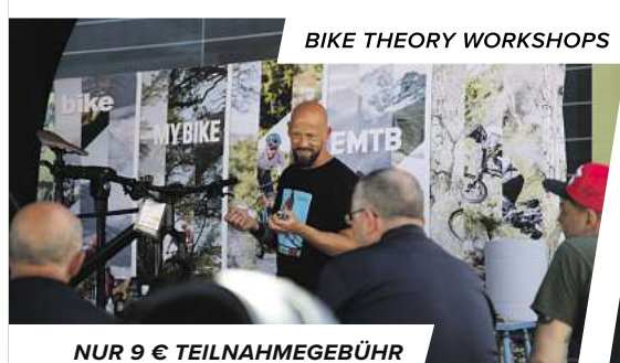
BIKE THEORY WORKSHOPS

Von Alltag bis Trail - sportliche E-MTB Power überall