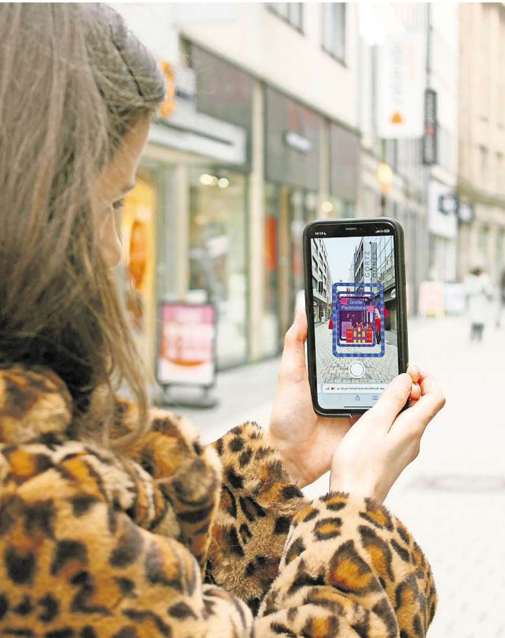
Die Straße lebt: 14 neue Augmented-Reality-Arbeiten, zu finden an ausgewählten Straßenschildern, lassen Hannovers Stadtgeschichte virtuell lebendig werden.

Unterstützt wird das Projekt auch von der Landeshauptstadt Hannover und der Hannover Marketing & Tourismus GmbH (HMTG). Ab Mai plant die HMTG geführte Touren zu den 14 neuen Augmented-Reality-Straßenschildern. Einen Anteil von diesen Einnahmen erhalten die Studierenden nicht. Laackmann setzt sich aber dafür ein, dass für Studierende die Teilnahme an den Touren kostenlos ist. „Das bietet sich schließlich für alle Studierenden an, die neu in der Stadt sind und sie besser kennenlernen wollen“, sagt sie.