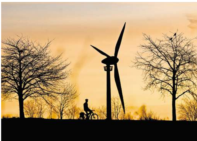
5940 zusätzliche Windräder sowie 480 Quadratkilometer Photovoltaikflächen, um klimaneutrale E-Fuels herzustellen?