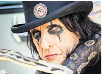
Alice Cooper rockt am 22. Juni auf der Waldbühne Northeim.

Ein Shuttlebus zur Waldbühne wird eingerichtet. Alle Infos dazu gibt es unter www.livingconcerts.de Tickets gibts im VVK für 70 Euro zzgl Gebühren an den bekannten VVK-Stellen und unter www.reservix.de