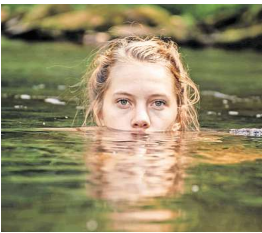
Abtauchen: Die Wasserqualität der Badeseen in der Region Hannover wird regelmäßig geprüft.

► Ricklinger Bad und Ricklinger Kiesteiche Das Ricklinger Bad, der Siebenmerteich und der Ricklinger Dreieckteich im Südwesten Hannovers schneiden alle mit „aus-