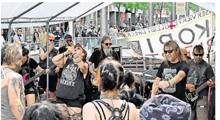
Musikalische Unterstützung: Die Band „Unwucht“ unterstützt den Protest gegen die Schließung des Punkertreffs „Kopi“ in Hannovers Nordstadt.