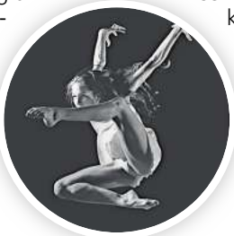
Sondervorführungen von „Tanja – Life in Movement“