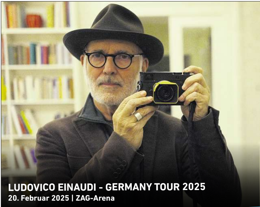
LUDOVICO EINAUDI - GERMANY TOUR 2025 20. Februar 2025 | ZAG-Arena

HANNOVER. Tauschen statt kaufen: Im Krokus, Thie 6, findet am Sonnabend, 25. Mai, von 14 bis 17 Uhr eine Kleidertauschparty statt. Maximal zehn saubere, gut erhaltene Kleidungsstücke und bis zu fünf Accessoires mitbringen und dafür bis zu 15 andere Teile mitnehmen! Anmeldung erwünscht unter STZ-KroKuS-Kultur@hannover-stadt.de oder (0511) 16834261. Am Freitag, 31. Mai, lädt dann am Krokus das große Nachbarschaftsfest zum 18. Tag der europäischen Nachbarschaft ein. Von 15 bis 19 Uhr gibt's Buffet, Musik, Spiele wie Gartenschach und VierGewinnt sowie Straßenkreide-Malen bei freiem Eintritt.