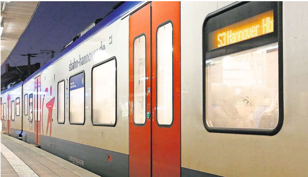
Pünktlicher als 2023: Fahrgäste der S-Bahn Hannover müssen weniger Verspätungen und Ausfälle verkraften – auch, weil etliche Großbaustellen beendet sind.

dieses Jahr seien weitere 100 Ausbildungen geplant. Aktuell setzt die S-Bahn noch auf Triebfahrzeugführer aus Leihunternehmen, daran soll sich bis zum Jahresende nichts ändern – auch wenn im Juli zehn neue Beschäftigte aus der Ausbildung kommen. Deutlich höher als bei dieser Berufsgruppe fällt die Fluktuation bei den Kundenbetreuerinnen und Kundenbetreuern aus. Ebenfalls ab Juli, wenn die aktuell laufenden Kurse enden, soll sich diese Situation entspannen.