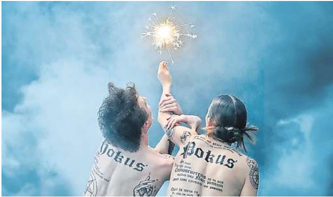
Magisch: Ballett „Hokus & Pokus“.