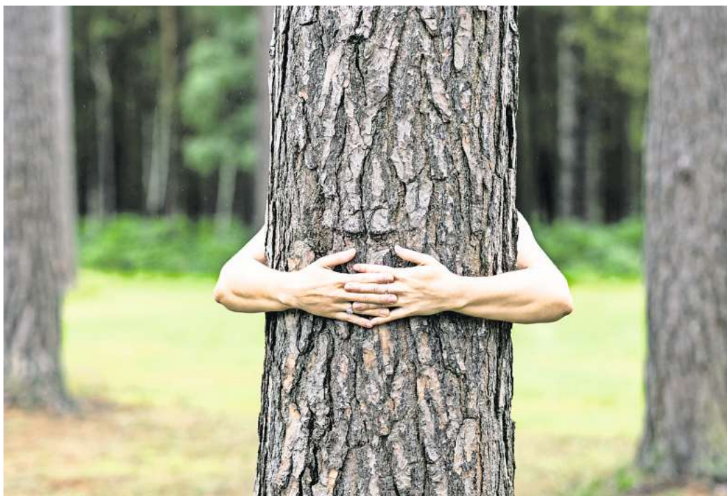
„Der Umgang mit der Natur ist ein ganz wichtiger Punkt.“ Bei Stress kann es helfen, einen Waldspaziergang zu machen. Oder eben auch mal einen Baum zu umarmen.

Das hilft aber nicht immer. Die Richtung ist aber schon gut. Denn der Umgang mit der Natur ist ein ganz wichtiger Punkt. Also zum Beispiel ein Waldspaziergang mit offenen Sinnen. Das heißt, sich den Wald anzuschauen, die Bäume, Äste und Blätter. Grün als Farbe tut schon gut. Und den Vögeln zuzuhören.