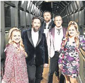
Live: Club for Five aus Finnland.

Alle Termine und Tickets: acapellawoche.com