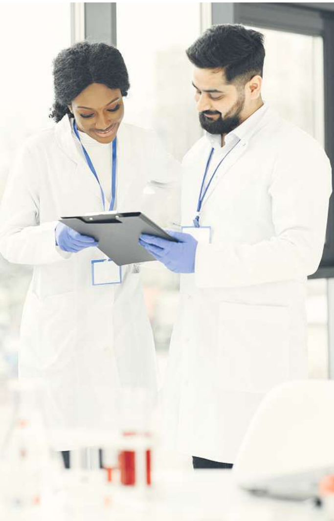
Potenzial für höhere Erwerbsbeteiligung: Vor allem bei Mädchen mit Migrationshintergrund steigt das Bildungsniveau. Im Jahr 2022 lag der Anteil der Gymnasiastinnen unter ihnen bei 47 Prozent.