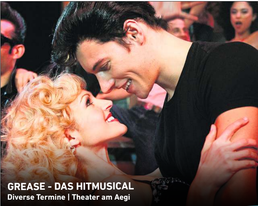
GREASE - DAS HITMUSICAL Diverse Termine | Theater am Aegi

Der Eintritt kostet 12, ermäßigt 6 Euro. RED