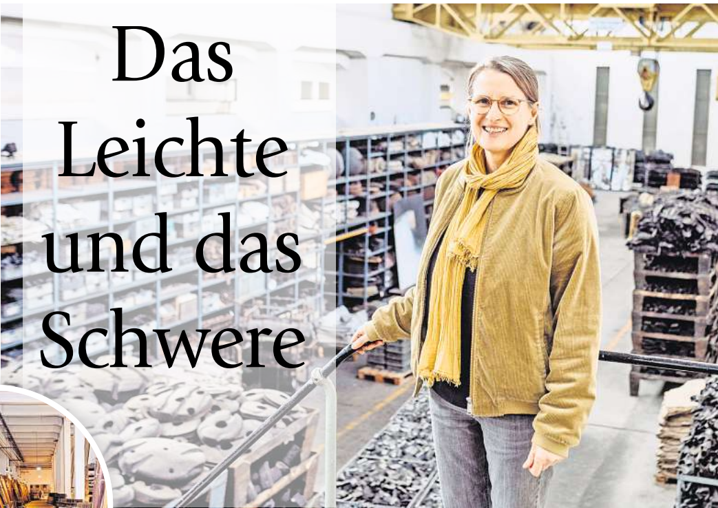
Installation „Litzmannstadt“: 2500 Lazarettliegen lehnen an der Wand, dazwischen Namenslisten und Fotos von Deportierten aus dem Getto im polnischen Lodz, das die Nazis umbenannten.

EIN ZUHAUSE FÜR „LITZMANNSTADT“ 2012 wurden die „Verlassenschaften“ der Öffentlichkeit vorgestellt – einige Monate nach Hans-Jürgen Breustes Tod. Und nach langwierigen Sanierungsmaßnahmen: Fluchtwege, Brandschutz und Sanierung der Elektroanlagen waren notwen-