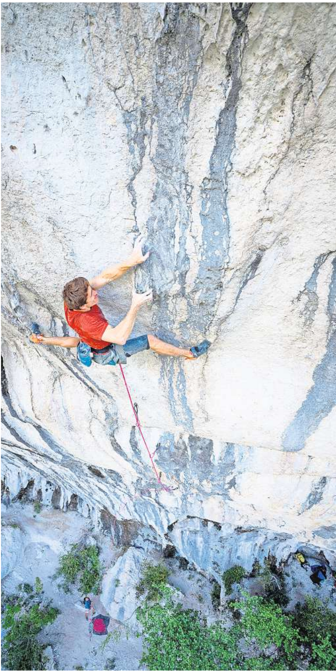
Dem Franzosen Sébastien Bouin gelingt die Erstbegehung der Route „DNA“ in der Verdonschlucht in Südfrankreich. Der Film „Reel Rock: DNA“ ist beim Banff-Filmfestival im Theater am Aegi zu sehen.