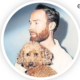
Pop trifft Poesie und politisches Kabarett: Enno Bunker ist im Rahmen des Programms „Act now!“ live im Pavillon.

schung aus Pop, Poesie, Politik und Punchlines trifft der selbsternannte „hauptberufliche Flausenleger“ den Nerv eines nachhaltig wachsenden Publikums, das der früheren Barpianist sich nicht nur übers Internet, sondern vor allem live mit mehr als 600 gespielten Konzerten in Clubs, Hallen, Wohnzimmern und auf Festivals erarbeitet hat. Zwischen Elektrohymnen und Klavierballaden bricht Bunker nicht selten mit dem gewöhnlichen Konzertformat und bringt zwischen den Songs einige selbstironische, kabarettistische Unterhaltungseinlagen. Der Eintritt für das Konzert kostet an der Abendkasse 33 Euro.