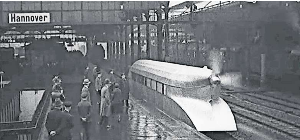
Die Zukunft von gestern: Der „Schienen-Zeppelin“ mit Heckpropeller 1931 im Hauptbahnhof Hannover.

Diese demonstrieren dort, wie man sich keinesfalls verhalten darf: So kommt der Bugatti-Fahrer beim regelwidrigen Wenden friedlichen Radfahrern ins Gehege und rumpelt dann auch noch über einen Bordstein. Die Verkehrserziehung von damals wirkt heute unfreiwillig komisch. Und auch der Kampf um Verkehrsraum kann sehr belustigend wirken. Jedenfalls wenn er lange zurückliegt.