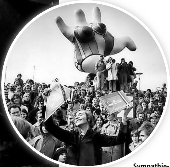
Sympathiebekundung: Fans der Nanas organisierten 1974 Aktionen, um die Installation der Plastiken zu unterstützen