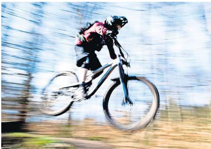
Mountainbiking ist ein beliebter Sport: Doch die Fahrerinnen und Fahrer sind teilweise auch auf illegalen Strecken unterwegs.

„Mit dieser Situation müssen wir jetzt gemeinsam mit den Deisterfreunden umgehen“, so der Regionssprecher weiter. Für nicht genehmigte Bauwerke sei entweder ein Rückbau oder eine Kompensation vorgesehen.