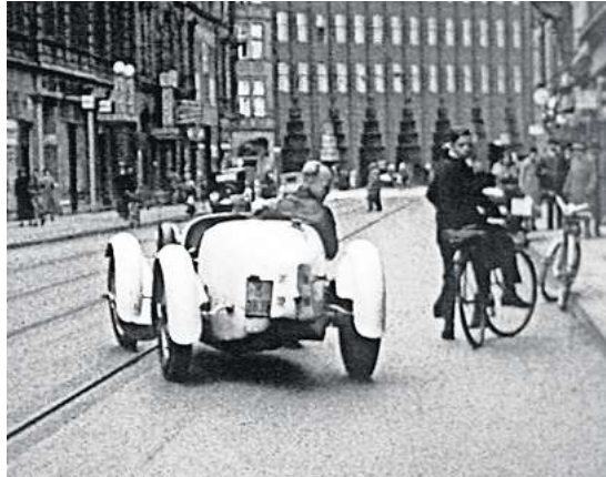
Ein Bugatti-Fahrer beim regelwidrigen Wenden kommt friedlichen Radfahrern ins Gehege