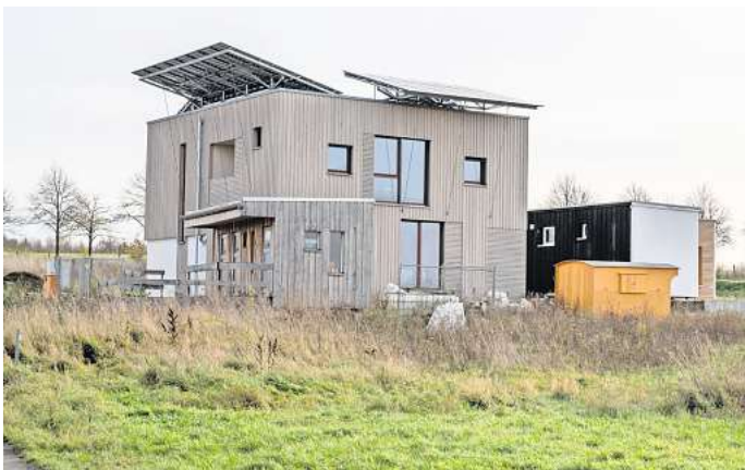
Insolvent: Das hannoversche Öko-Wohnprojekt Ecovillage auf dem Kronsberg im Stadtteil Bemerode ist am Ende.