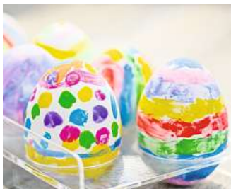
Ei, Ei, Ei: Im Schulbiologiezentrum dreht sich alles um Ostern.