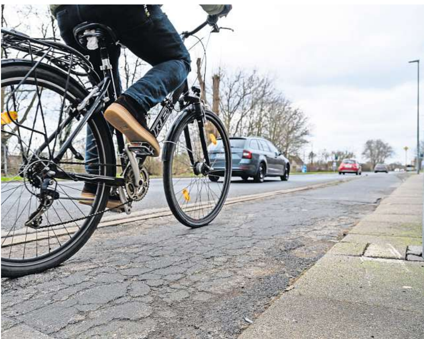
Der Radweg am Sahlkamp soll komplett erneuert werden