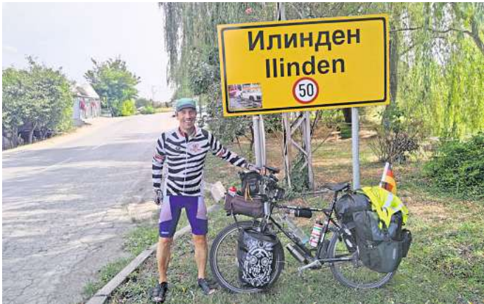
In Mazedonien: Mit dem Trikot vom TSV Victoria Linden vor dem Straßenschild Ilinden.