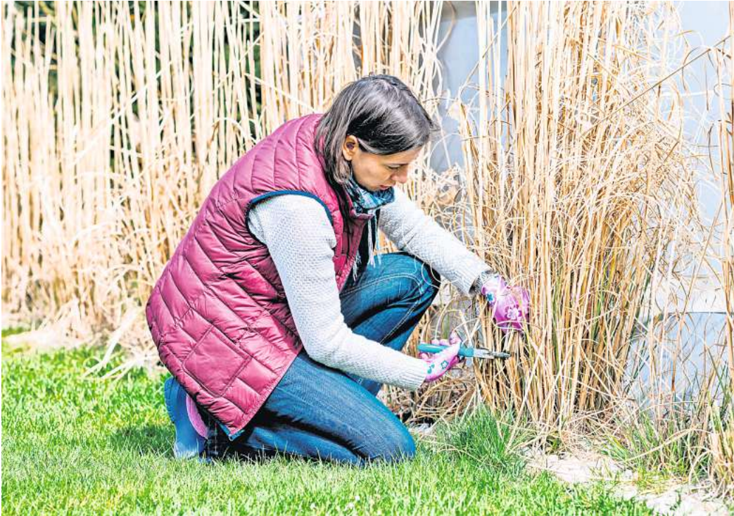
Gut, dass die Tage schon deutlich länger sind und auch in den frühen Abendstunden noch gegärtnert werden kann.

Falls Sie kein Gewächshaus oder einen Dachunterstand für Tomaten haben, lohnt es sich, robuste Züchtungen anzubauen, die weniger anfällig sind. Gut bewährt haben sich Wildtomaten und Sorten wie Golden Currant, Resi oder Philamina: Sie trotzen dieser Pilzkrankung lange und schmecken aromatisch. Allerdings sind Setzlinge schwerer zu bekommen als Samen. Wenn Sie sicher sein möchten, im Mai genug robuste Setzlinge fürs Freiland zu haben, ist in diesem Monat noch Zeit, Saatgut zu kaufen und bei Raumtemperatur auszusäen.