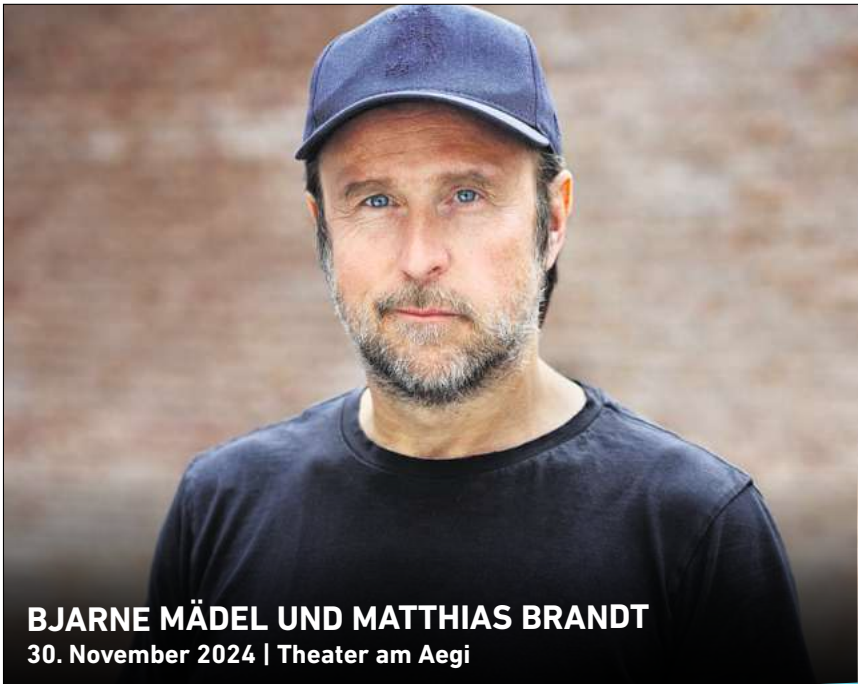
BJARNE MÄDEL UND MATTHIAS BRANDT 30. November 2024 | Theater am Aegi

Ihr persönlicher Ticketservice der HAZ & NP