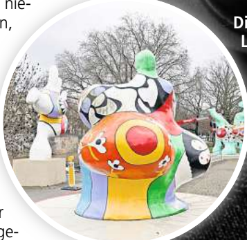
Die Nanas am Leineufer werden in diesem Jahr 50 Jahre alt